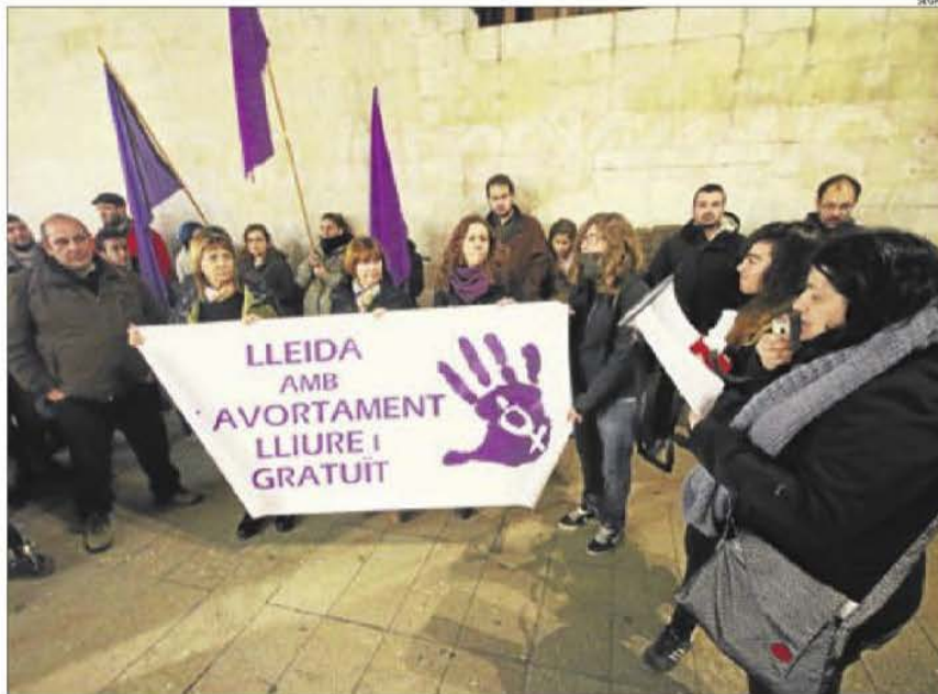
Imatge d'arxiu d'una manifestació a favor de l'avortament lliure i gratuït.