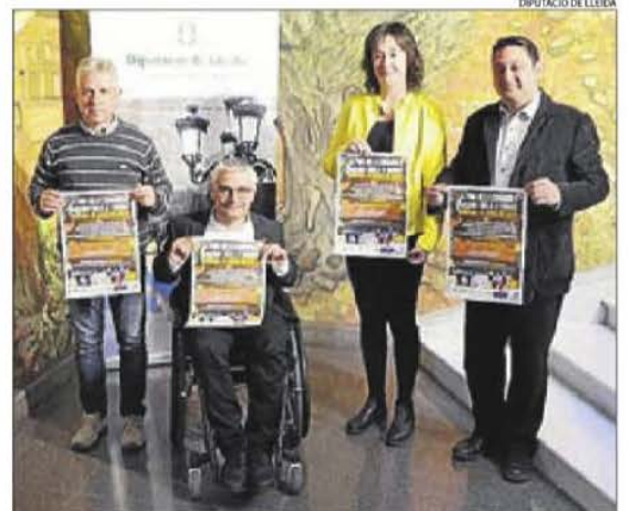
Presentació de la fira de l'Albi, que se celebrarà diumenge.

| LLEIDA | La Fira Artesanal i dels Tres Tombs de l'Albi, que se celebrarà aquest diumenge dia 15, incorporarà els caragols amb un aplec solidari i els beneficis es destinaran a assumir part de les despeses del temporal del mes d'octubre. La jornada també inclourà els tres tombs amb seixanta cavalls i carruatges; un mercat de productes artesanals i visites guiades. Tancarà la fira un dinar popular al pavelló.