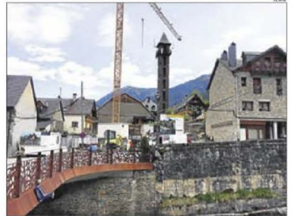
Imatge d'arxiu d'habitatges en construcció a Vielha.

al conjunt de la demarcació de Lleida se'n van començar 669 i se'n van acabar 432, segons una projecció de l'APCE de l'any passat. El nombre de pisos iniciats l'any passat és el més alt des del 2010, quan van ser