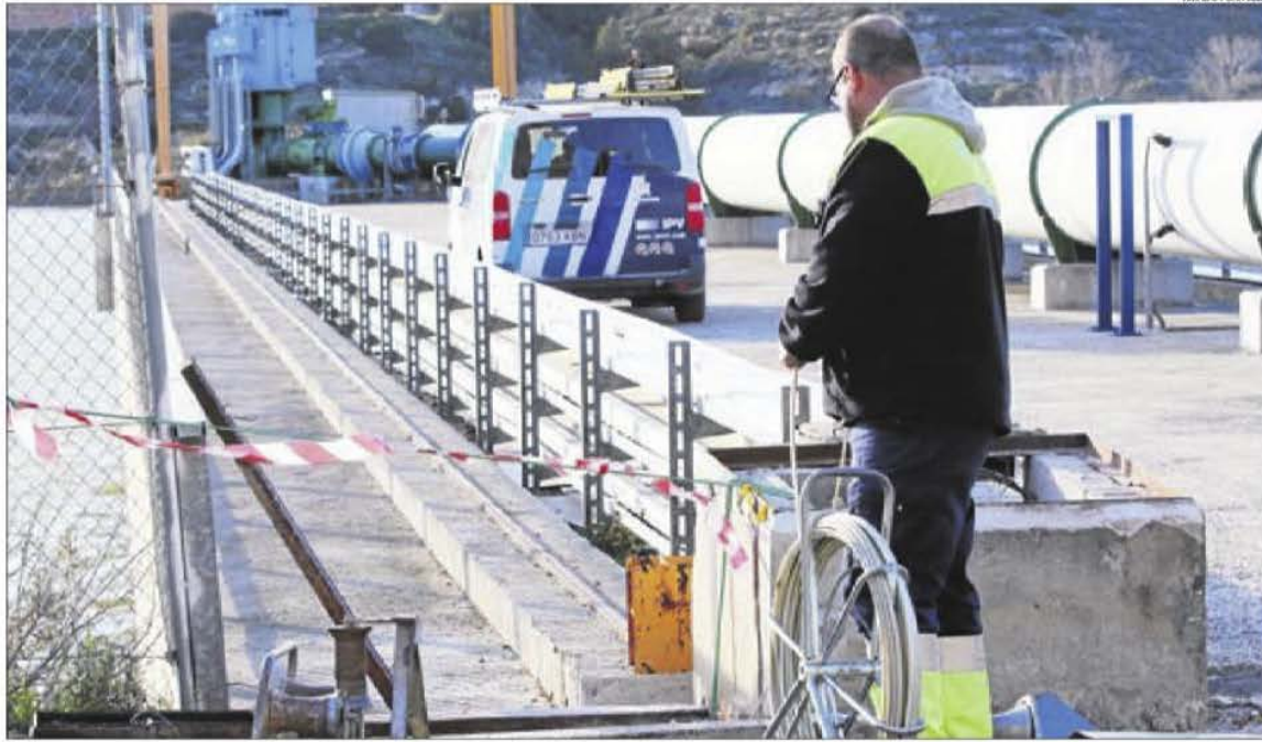
La reparació de la presa d'aigua del Segrià Sud a l'Ebre, on fa una setmana es va robar el cable de coure de les connexions.