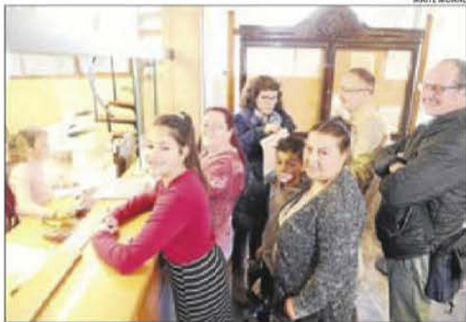
L'Ampa i la plataforma, al presentar les firmes al consistori.