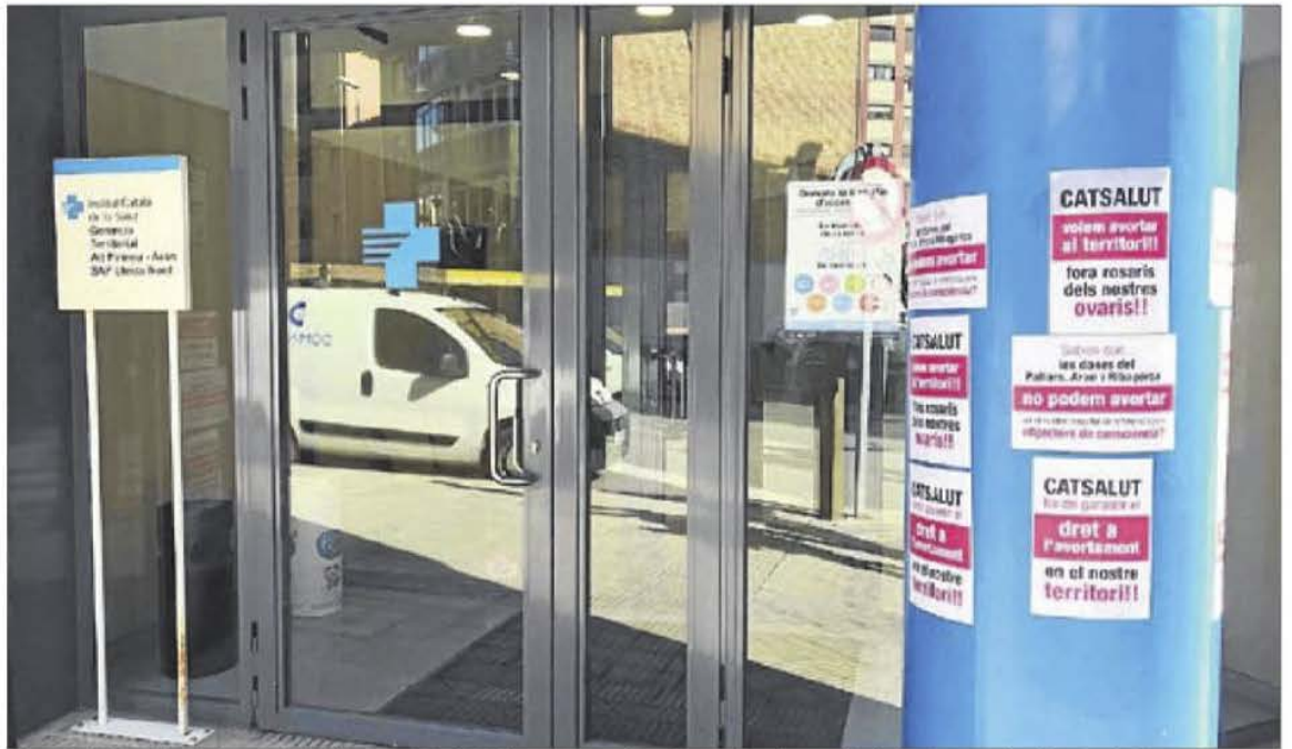
L'hospital del Pallars, el CatSalut i diferents CAP del Pallars van quedar coberts ahir de cartells de denúncia pel col·lectiu de dones.

Aquest diari no va aconseguir obtenir ahir la versió de la conselleria de Salut malgrat intentar-ho.