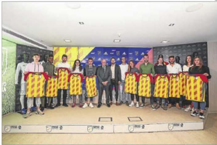
L'FCF va presentar ahir la samarreta que Catalunya estrenarà el dia 30 al Camp d'Esports.

El lateral de Cambrils, de 33 anys, diu que li agradaria retirar-se al club blau