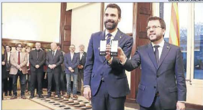
El vicepresident del govern, Pere Aragonès, lliura el projecte de pressupostos 2020, amb el mòbil i via AirDrop, al president del Parlament, Roger Torrent.