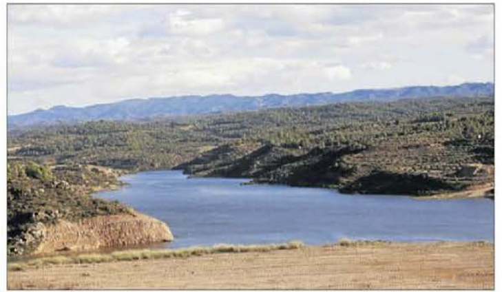
Reserven 18 milions d'euros per finançar part de l'obra del pantà de l'Albagés.

També el canal Segarra-Garrigues, que rebrà 8,8 milions d'euros, dels quals 6,3 es destinaran a la xarxa de distribució de diversos sectors de regadiu i la resta a altres actuacions relacionades amb el desenvolupament del canal. Els pressupostos també preveuen 18 milions d'euros pel conveni signat amb l'empresa constructora del canal i el pantà de l'Albagés, Acuaes, per al finançament de la part de l'obra que corresponia emprendre als regants i que en el seu moment va assumir la Generalitat. En el mateix àmbit dels regadius, els pressupostos inclouen gairebé 2,3