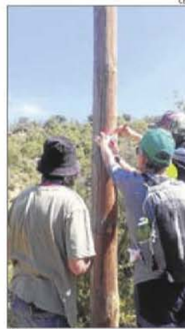
Pintant les marques en un pal.

Comitè de Senders de la FEEC, que haurà d'aprovar el recorregut i posteriorment informar els diferents ajuntaments i finalment passar al marcatge amb els tradicionals colors blancs i vermells dels senders de Gran Recorregut.