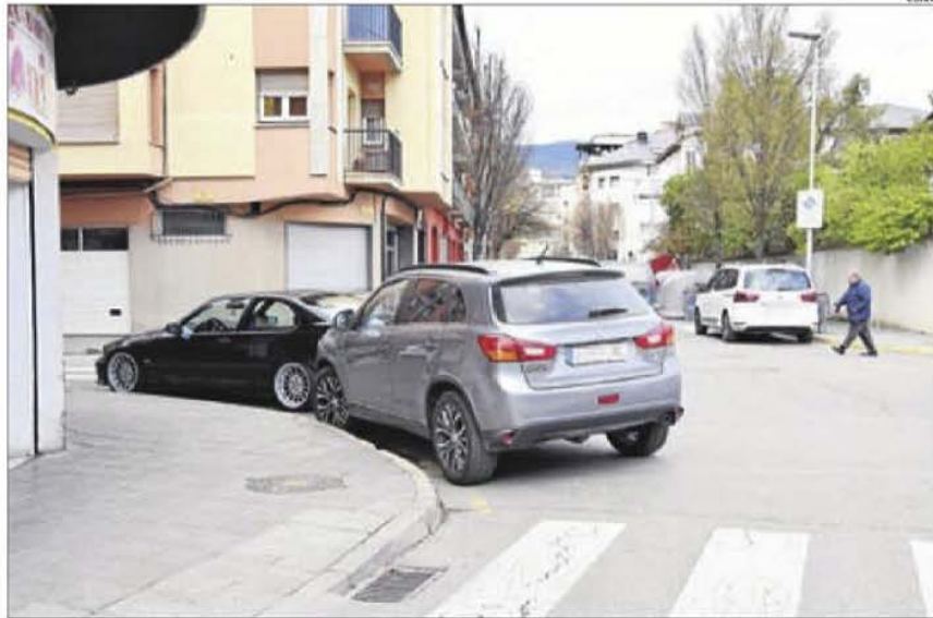
Dos vehicles estacionats en una intersecció pintada de groc com a senyal de prohibició.

Pel que fa a tipologies i citades en ordre, els estacionaments indeguts més habituals són els de les zones de càrrega i descàrrega, els aparcaments sobre les voreres, els que ocupen zones senyalitzades amb línia groga que indica la prohibició d'estacionar-hi (sobretot a les