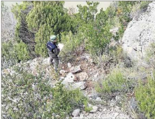
Imatge de l'allau del gener al congost de Mont-rebei.