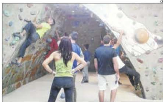
Competicions d'anys anteriors.

Es muntaran les vies amb diferents graus de dificultat i es podran anar provant durant tota la jornada.