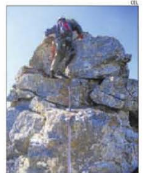
Escalant a la cresta del Ventall.