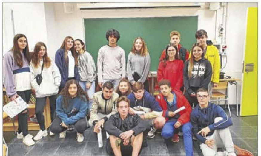
Grup de nous jutges d'atletisme que van superar el curs el febrer passat.