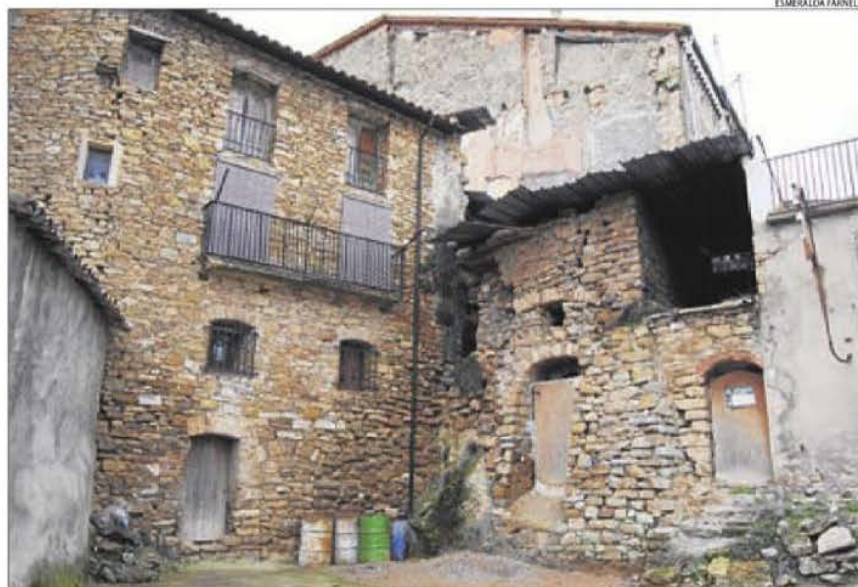
El centre de Figuerola d'Orcau, un dels molts nuclis amb cases buides i abandonades.