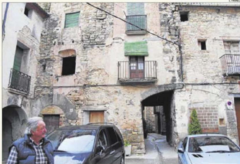
Tres dels immobles buits i deshabitats del nucli de Figuerola d'Orcau, a Isona.