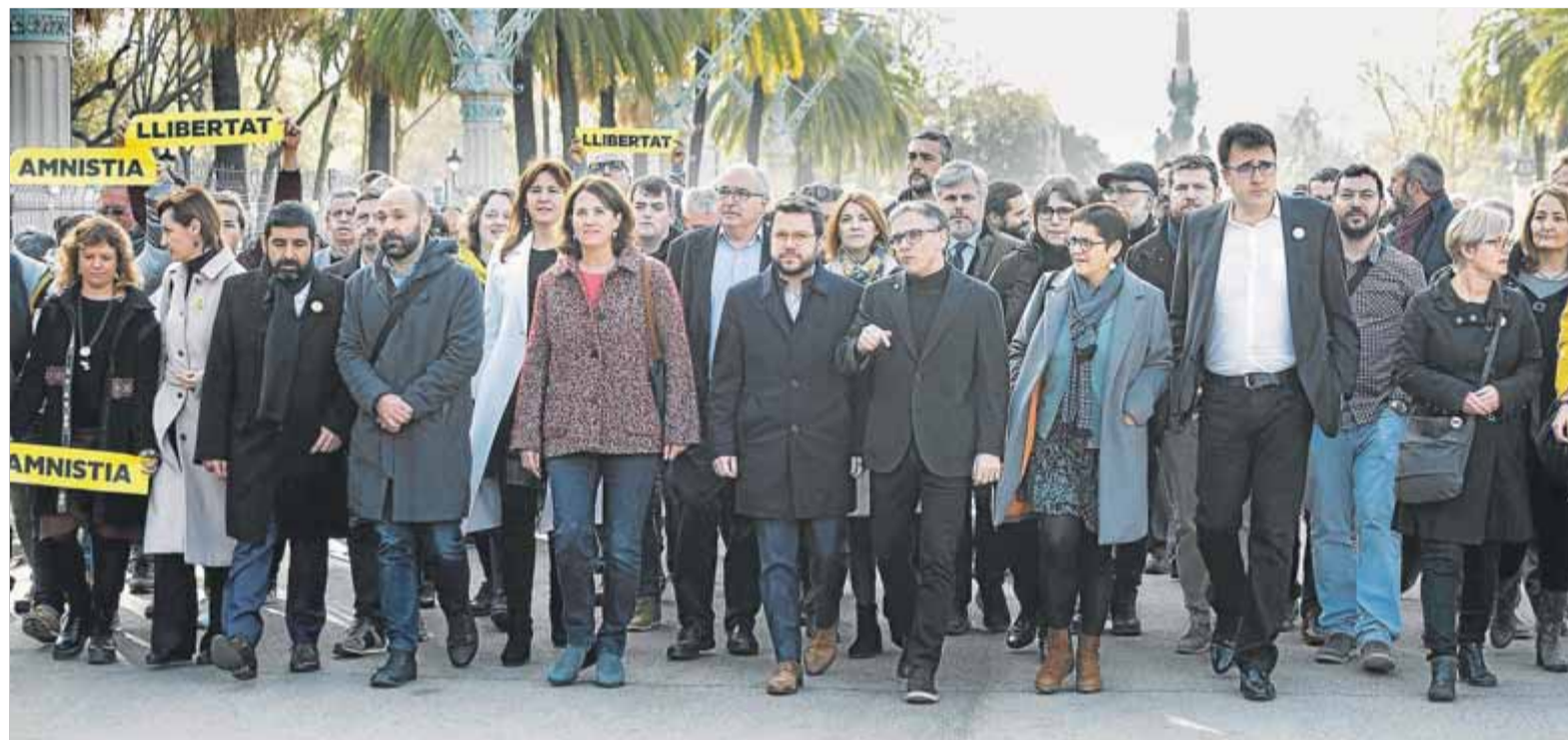
Jové i Salvadó, acompanyats del vicepresident del govern, membres d'ERC, JxCat i la CUP, a més dels representants de l'ANC i d'Òmnium, ahir