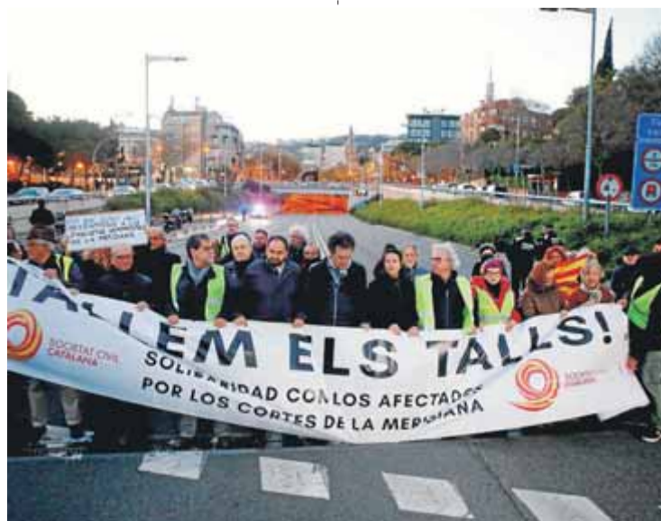
Els membres de SCC tallen la Via Augusta per protestar pels talls que des de fa 150 dies s'efectuen a la Meridiana

El president de SCC va denunciar, a més a més, el tractament diferenciat que havien rebut dels responsables del go-