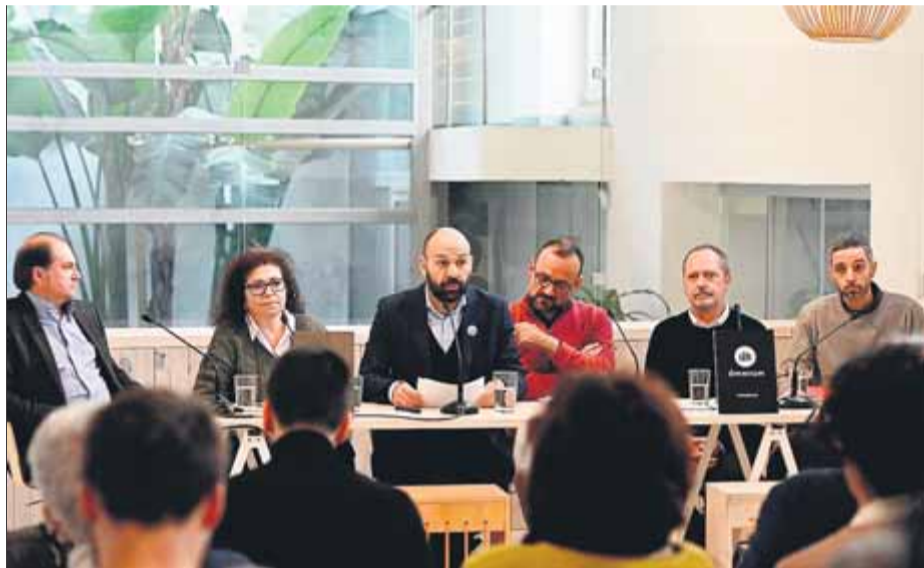
El vicepresident d'Òmnium, amb el penalista Benet Salellas i quatre catedràtics, ahir

En un acte a l'Espai Ecooo, al barri madrileny