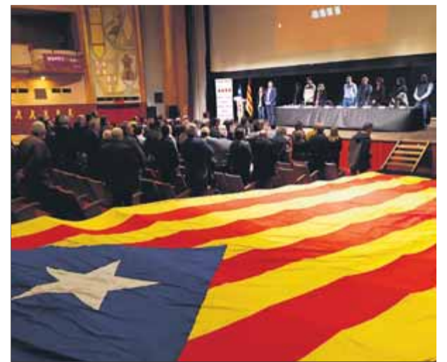
L'assemblea de l'AMI es va fer ahir a l'Espluga