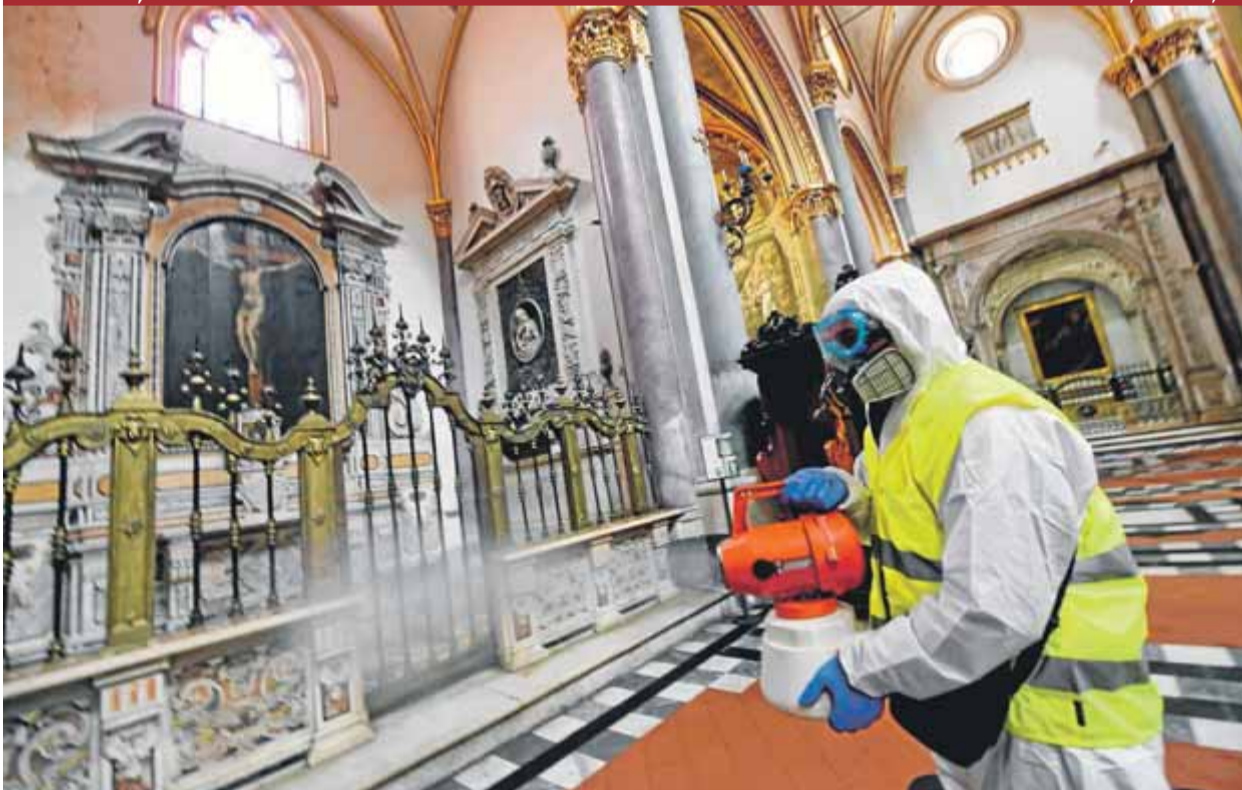
Fumigació a l'església de San Domenico Maggiore de Nàpols per evitar la propagació del coronavirus ■