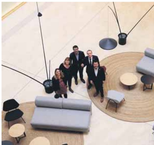
Aragonès i altres càrrecs visitaven ahir la nova seu ■ ACN

Per altra banda, Aragonès també avalava ahir la