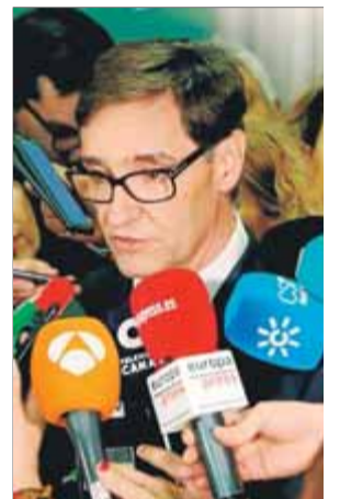
El ministre Illa rebatia ahir Puigdemont

Arran dels deures que Puigdemont ha marcat a la mesa, la portaveu del PSOE, Adriana Lastra, equipara JxCat i el PP a l'hora de qualificar-los com a "enemics" del diàleg. "Hem de ser conscients que la me-