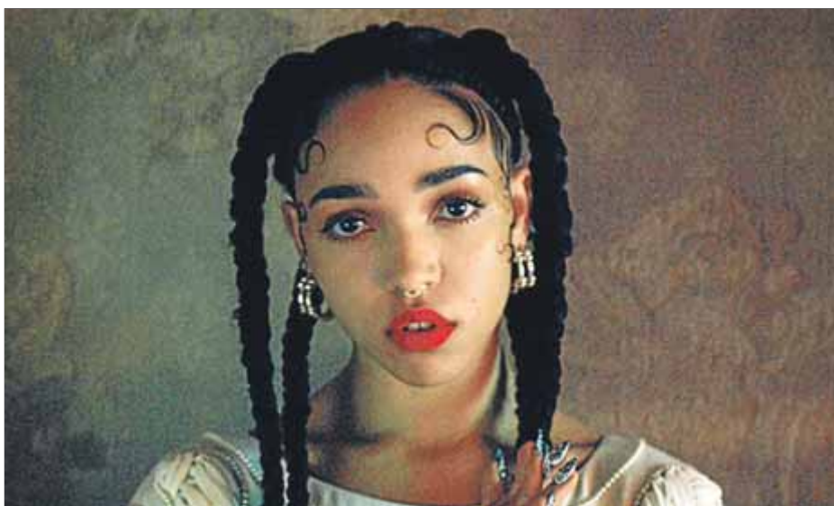
La cantant, ballarina i directora d'escena britànica FKA Twigs

El primer tema parla de la dificultat d'estimar sota altres mirades i es titula Thousand eyes . La cançó parla de aquells que només volien veure'ls, dels ulls que els perseguen a cada moment. La seva forma és exemplar, la veu de soprano de la cantant crea un crescendo , que gairebé sembla una cantata medieval, per assumir posteriorment una caiguda. El piano acompanya la veu i és com si tota la cançó fos una al·legoria sobre la pujada, la caiguda i la possibilitat de tornar a renèixer. Tot el disc està ple de pujades i baixades. En el tema Home with you , on parla al·legòrica-