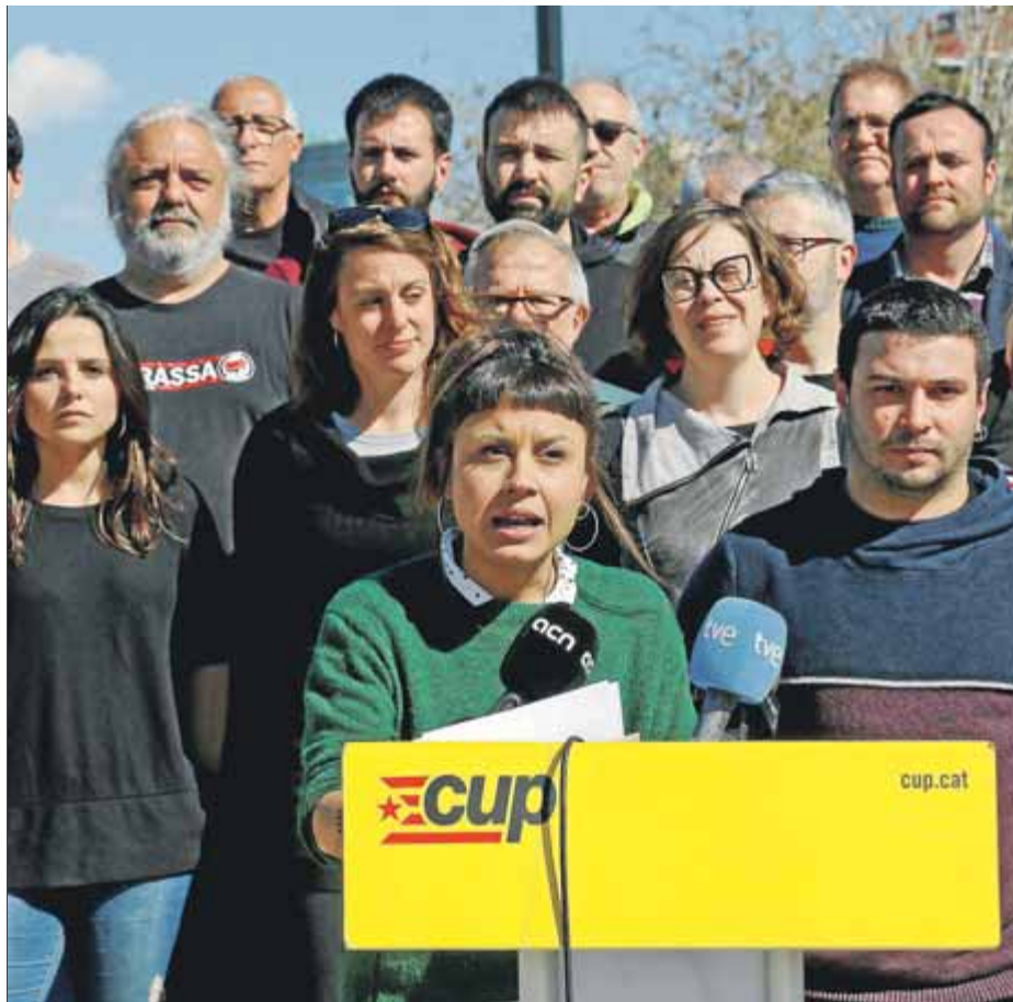
Rovira i Fernández, amb diputades i altres membres de la CUP, ahir a Barcelona

Rovira va defensar que ara cal “acumular forces” que permetin arribar a “una fase de resolució” del conflicte, ja que la formació considera que encara no s'ha arribat a aquest marc de ruptura vinculat a “la conquesta de drets socials i democràtics amb l'exercici efectiu del dret a l'autodeterminació”, va reblar Edgar Fernández, també portaveu dels anticapitalistes, davant dels mitjans al parc de l'Estació del Nord de Barcelona. Per aquest motiu la proposta de la CUP depèn de ser “moltíssims més” i “més decisius que mai” i se centraran a “aglutinar el descontentament de totes aquelles persones que han vist com altres projectes polítics quedaven absorbits per dinàmiques institucionals” mentre no els solucionaven els problemes. Rovira considera: “Si som més forts a les institucions podem condicionar l'agenda política del país”, situant-hi el referèndum o un altre mecanisme