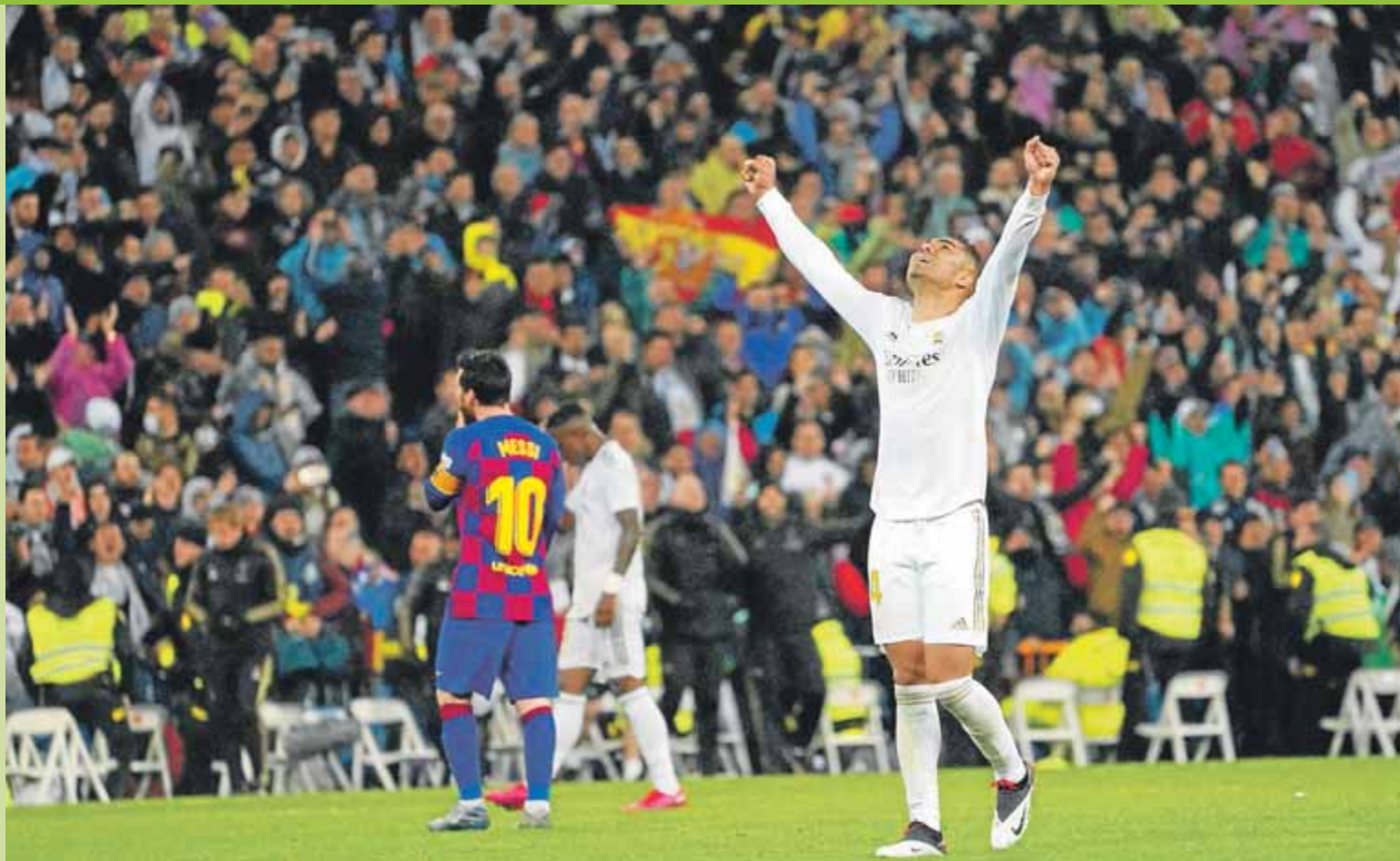
Casemiro, en plena celebració, ahir, durant el clàssic ■ MIQUEL LISO