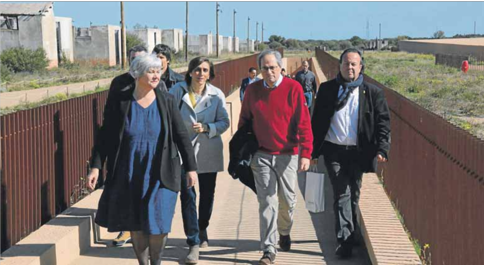
El president Quim Torra es va quedar ahir a la Catalunya del Nord i va visitar el camp de presoners de Ribesaltes, on va evitar parlar de la mesa de diàleg