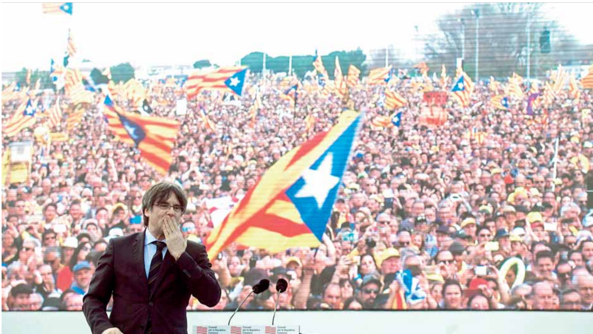
Carles Puigdemont, en la seva intervenció al multitudinari acte d'ahir a Perpinyà

EMBÚS • Els controls policials espanyols i els accessos a les autopistes franceses fan que molts autocars arribin tard