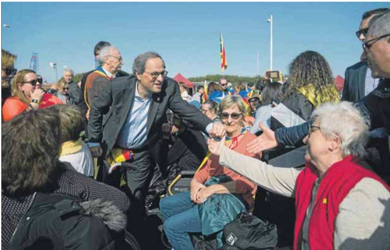
A dalt, una panoràmica general del Parc de les Exposicions, que es va omplir amb més de 100.000 persones, i en va deixar desenes de milers més a fora. A sota, el president Torra saludant gent a l'espai reservat per als minusvàlids