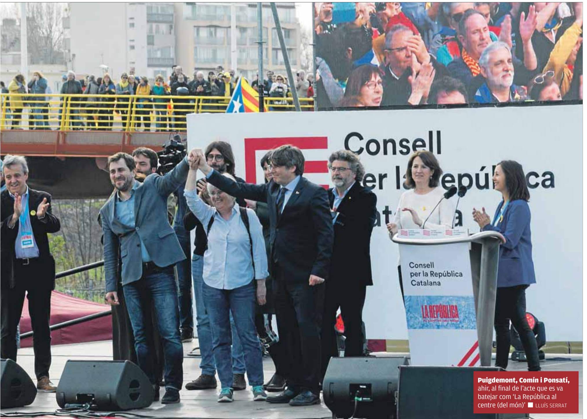
Puigdemont, Comín i Ponsatí, ahir, al final de l'acte que es va batejar com 'La República al centre (del món)'