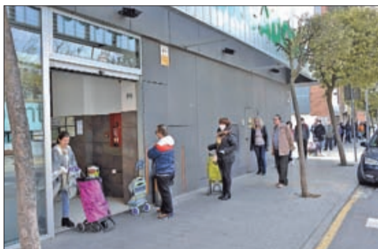
Cues als supermercats de Lleida

Pel que fa a Catalunya, es manté la tendència a l'alça i ja hi ha prop de 509.000 treballadors afectats per un expedient de regulació temporal d'ocupació, 50.000 més que divendres passat, segons les últimes dades del departament de Treball, una xifra que s'ha més que duplicat en una setmana. En concret, hi ha 7.042 empreses més que s'han acollit a la mesura en un dia, quan n'eren 58.843, i se situen ja en les 65.885. La segona setmana d'es-