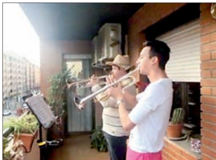
Cada dia els dos trompetistes surten al balcó

i treballadores dels serveis essencials de la ciutat. Fa dues setmanes, la mateixa associació ja va donar 2.000 mascaretes als Mossos i la Guardia Urbana.