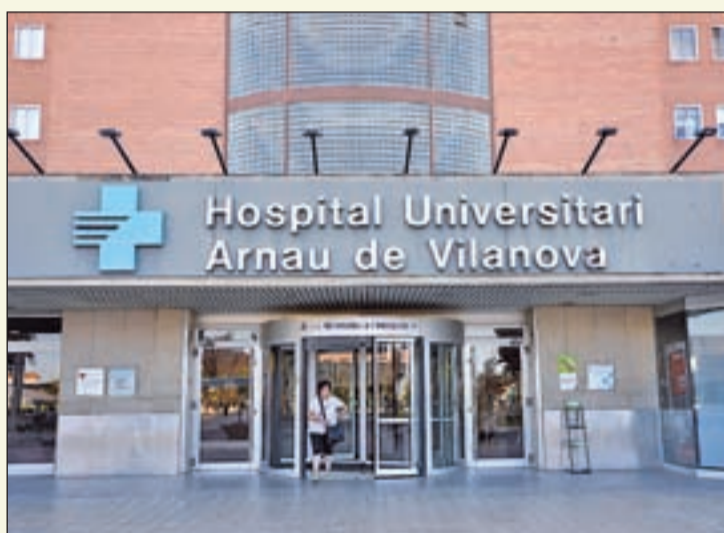
Façana principal de l'Hospital Arnau de Vilanova

Actualment, 16 persones es troben ingressades en centres hospitalaris de la demarcació de Lleida i Alt Pirineu i Aran amb coronavirus SARS-CoV-2. D'aquests