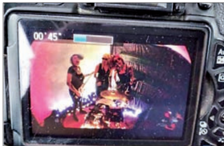
Ratpenades sustituirán en octubre a Shöck