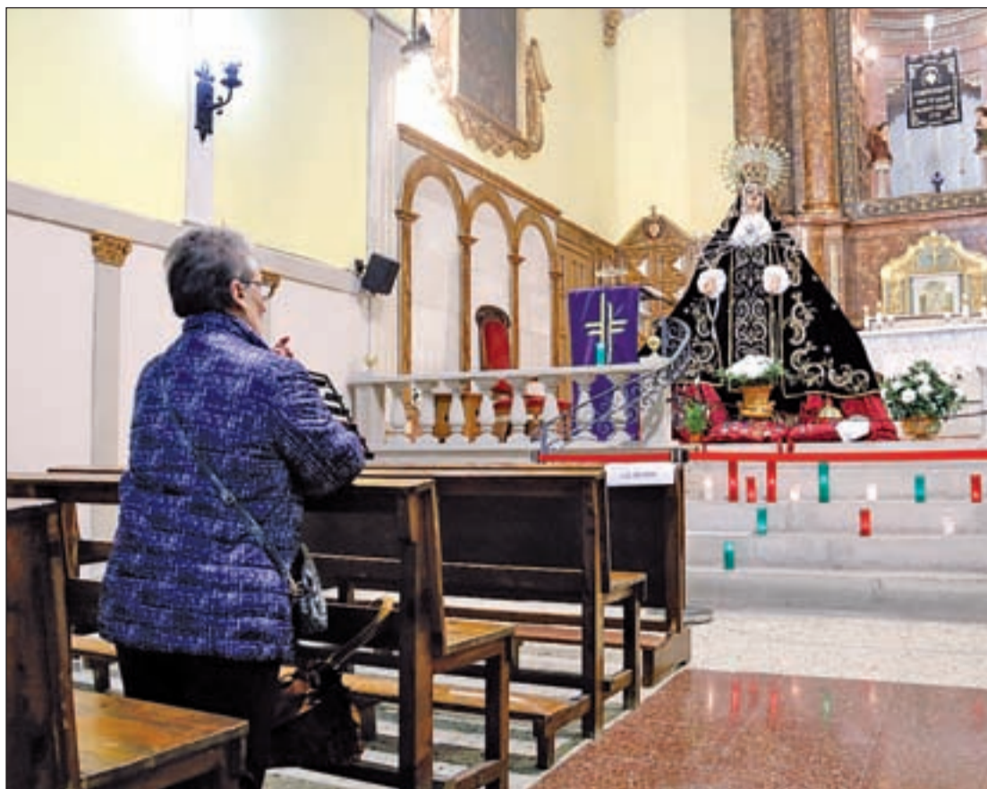
L'oratori va estar obert de les 9.00 hores a les 13.00 hores i de les 17.00 hores a les 20.00 hores

implementar el sistema de consulta del correu electrònic amb webmail, que facilita accedir al correu sense haver de tenir-lo instal·lat al mòbil personal o ordinador de casa. D'altra banda, el CSIF de Lleida exigeix a la direcció de Ponent que faciliti la màxima protecció contra el contagi del covid-19. Defensa que cal adoptar mesures urgents de flexibilitat horària.