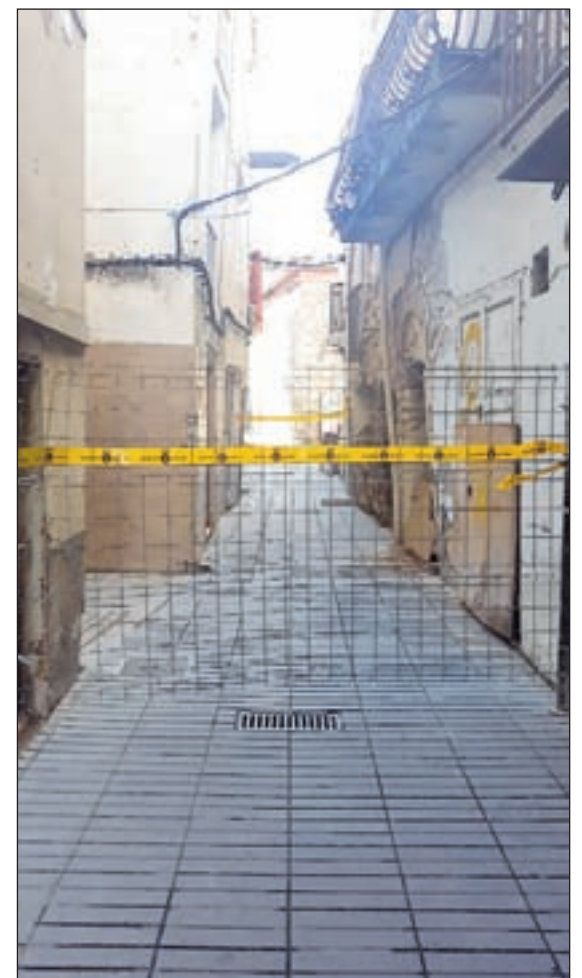
Imatge del carrer del Forn tallat i dels edificis pendents d'enderrocar pel seu mal estat

caure l'arrebossat de la façana i els serveis tècnics de l'ajuntament van considerar necessari tallar el carrer", assegura el regidor