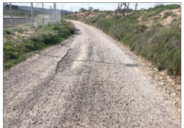
Algunes de les afectacions produïdes pels aiguats

L'actuació també preveu llaurar reg asfàltic i refer amb graves el Camí del Salat, del pati del Nincanor fins al desguàs, i finalment, l'aportació de material, refinar i compactar el camí de Maisa. La Junta també va aprovar la sol·licitud de subvenció directa per les despeses derivades del mateix temporal.