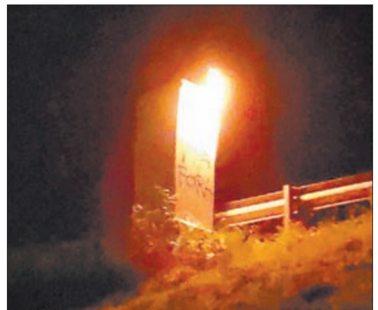
L'aparell situat a l'N-II, a Alcarràs, va ser cremat

del 5 de desembre es va fer el primer sabotatge, que va afectar uns 25 radars a Ponent. En aquella ocasió, l'Estaca manifestava que la seva acció es basava en "la voluntat de derogar els límits re-