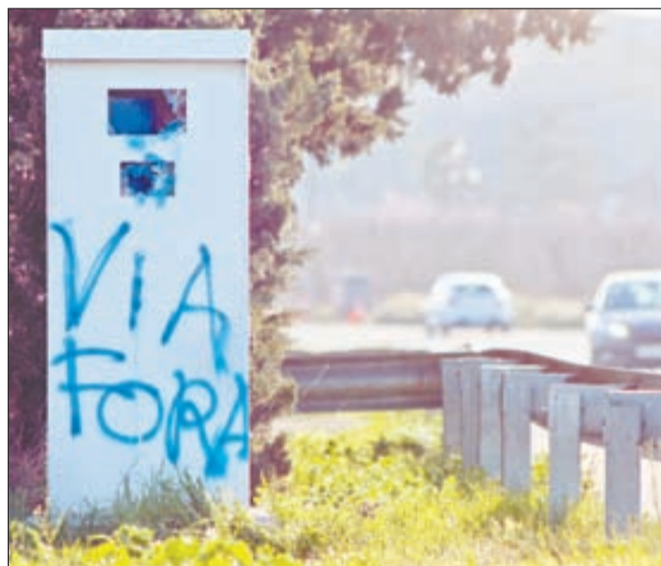
Estat en què va quedar el radar situat a Lleida, a Pardinyes

fondre a través Telegram , el grup independentista va manifestar que "poc a poc anem fent via per les carreteres catalanes encara espanyoles". Així mateix, indicava que "no permetrem que la por i