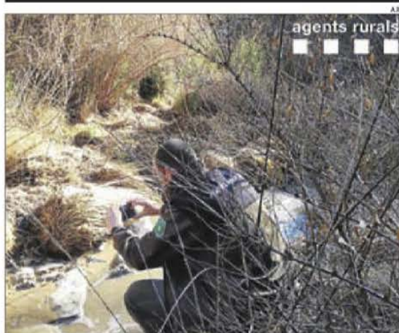
Un agent pren mostres al riu Flamisell.

■ Trànsit projecta geolocalitzar mòbils de conductors per saber la velocitat mitjana en carreteres. Per la seua part, l'INE va rastrejar mòbils a Espanya per a estudis sobre mobilitat. L'ús d'aquesta tecnologia està subjecte a restriccions per preservar el dret a la intimitat.