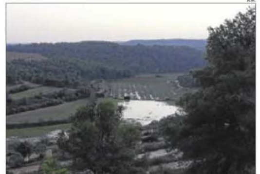
L'extensió inundada supera les 300 hectàrees.