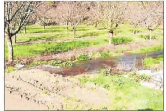
Alguns camps de Maials negats per l'aigua.