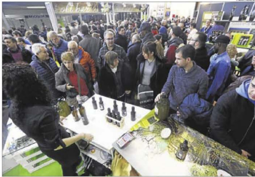
Visitants a l'edició anterior de la Fira de l'Oli celebrada a les Borges Blanques al gener.