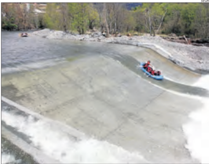
Només la presa d'Hostalets s'ha adaptat per al pas de barques.

L'obra forma part del projecte per fer navegable la Pallaresa de Llavorsí a Sant Antoni