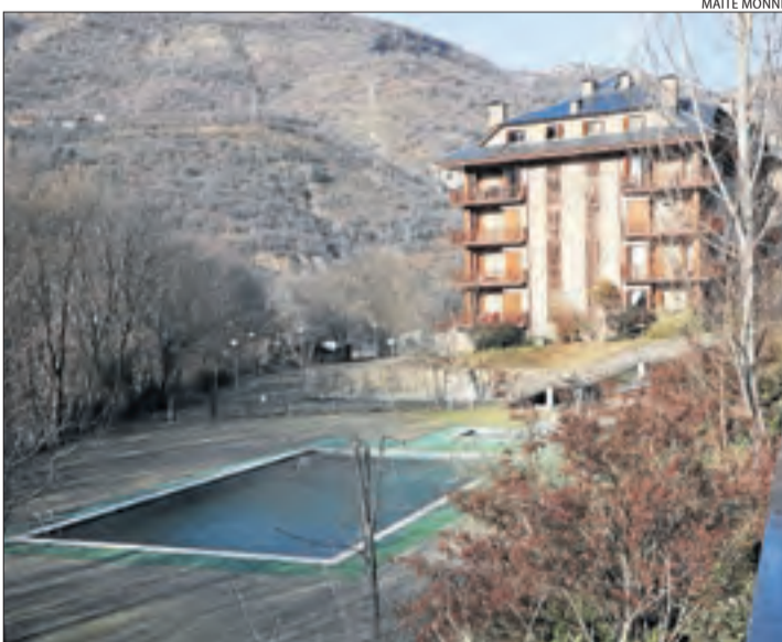
Una de les dos piscines públiques de Sort cedides a particulars.

Així ho va avançar l'equip de govern de Som Poble du-