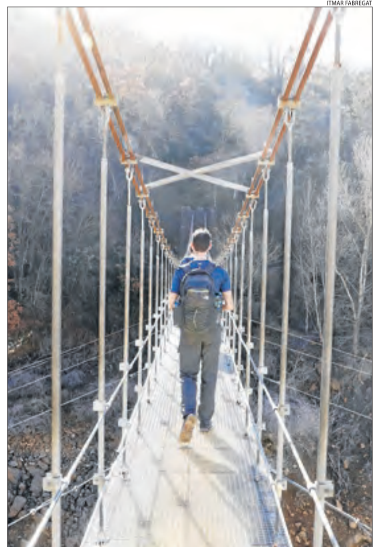
Visitants creuen el pont entre la part oscenca i la lleidatana.