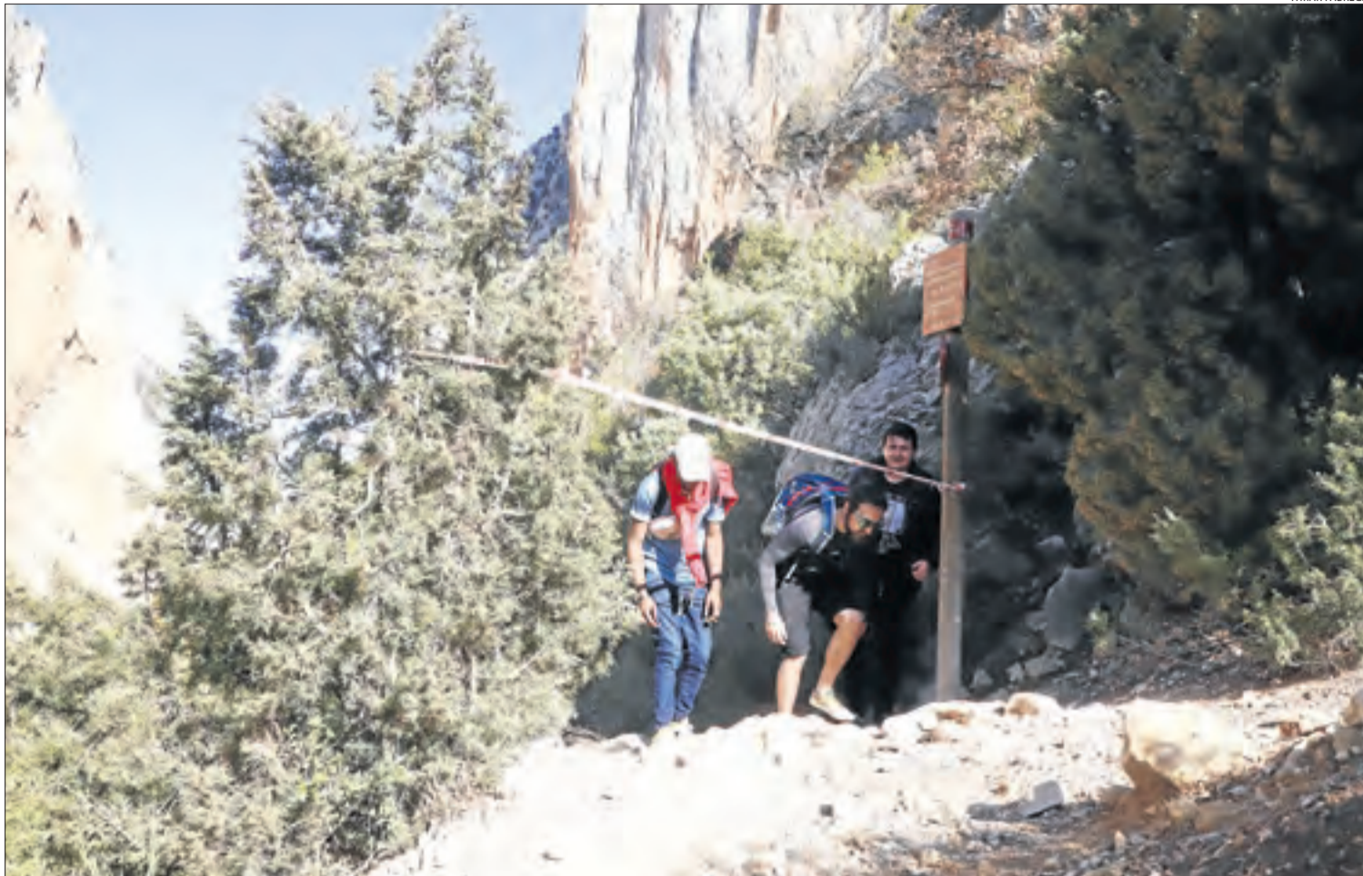
Excursionistes al passar ahir per sota d'una cinta per restringir el pas a una zona afectada per allaus a Mont-rebei.