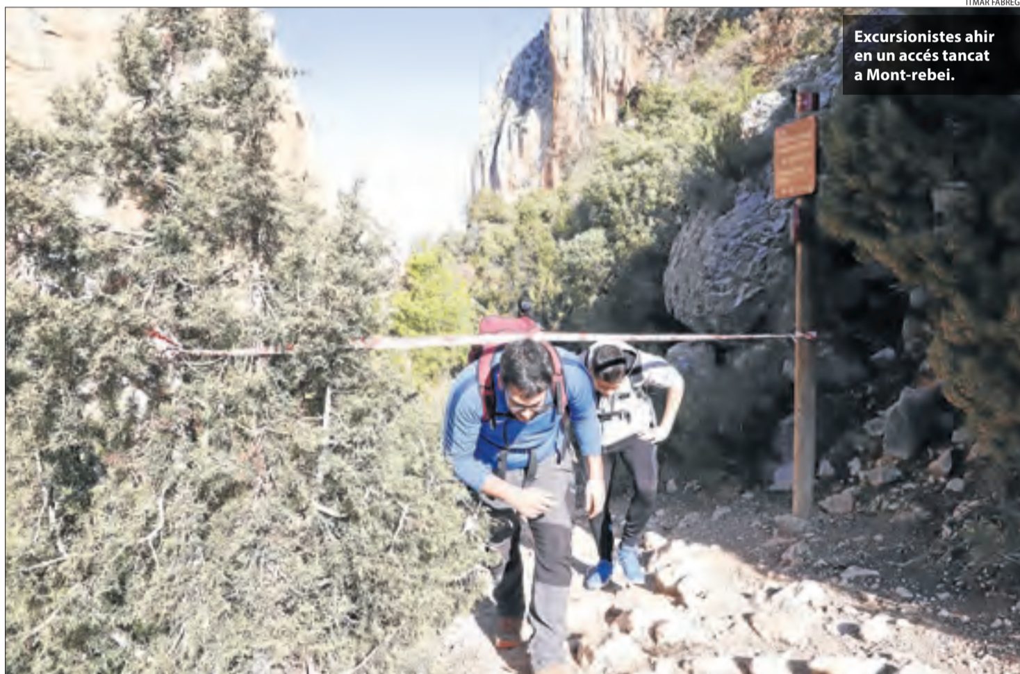
Excursionistes ahir en un accés tancat a Mont-rebei.