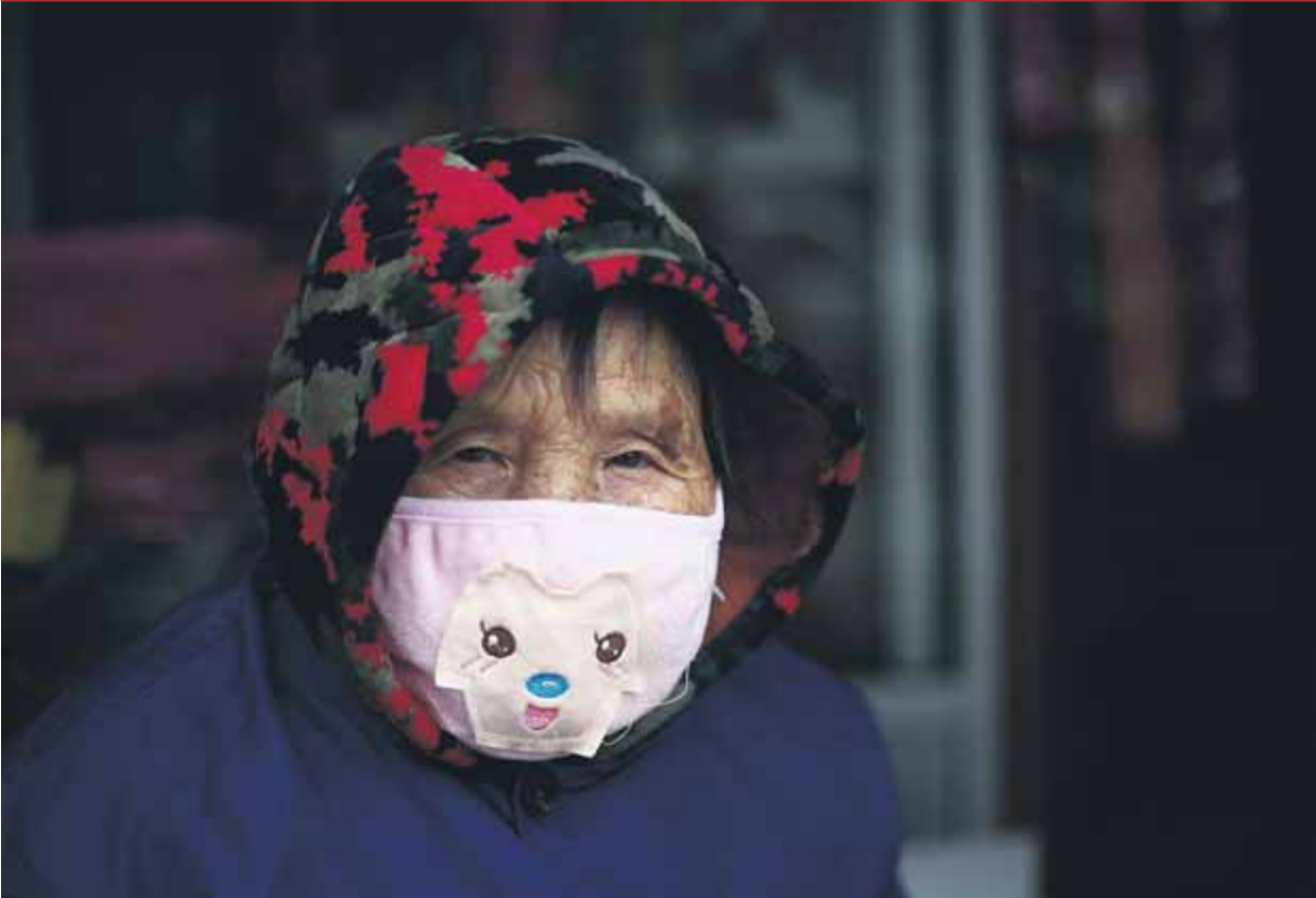
Una dona es protegeix amb una màscara a la província de Hubei, on es van localitzar els primers casos del virus