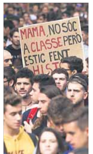
Manifestants, en la vaga general del 18-0