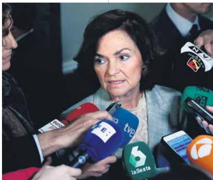
La vicepresidenta Calvo nega que hi hagi repressió