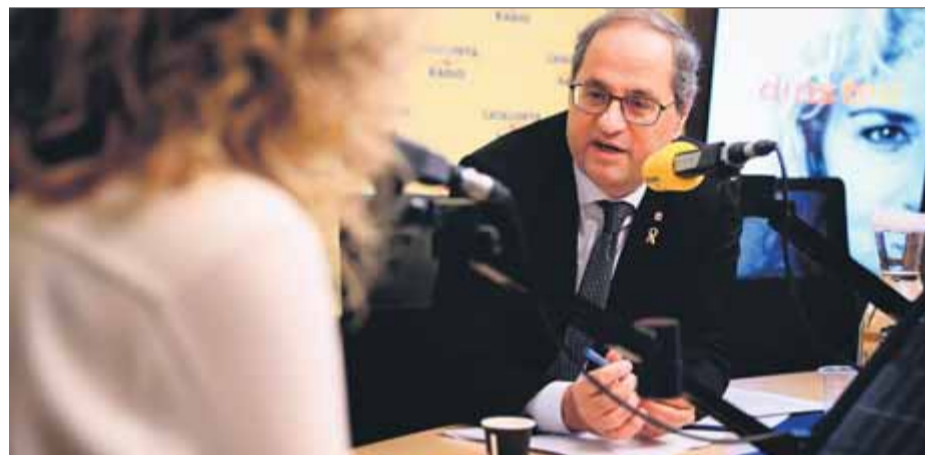
El president Torra durant l'entrevista ahir a Catalunya Ràdio

En la conversa telefònica del 9 de gener passat, hi afegeix, Torra "li va deixar clar que la reunió dels dos presidents havia de servir per encarrilar la taula de negociació" entre els dos