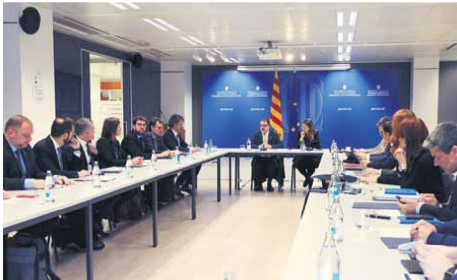
Bosch es va reunir a Brussel·les amb els delegats de la Generalitat a l'exterior

El conseller va assegurar als mitjans que des del departament s'encarregaran de demanar a instàncies internacionals que