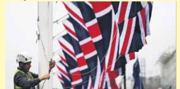
Un operari arria banderes de la Unió, a Londres