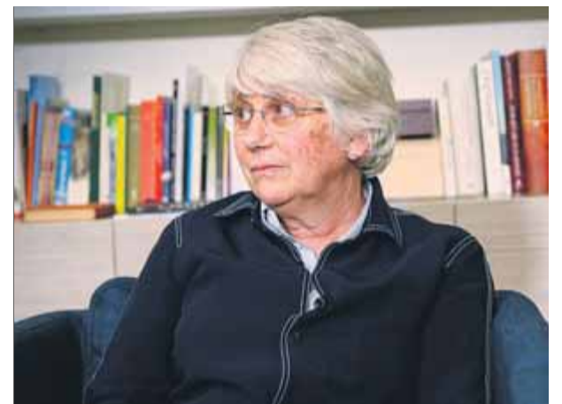
L'exconsellera del govern català Clara Ponsatí fotografiada a Waterloo fa uns mesos

De moment, el ministeri ha refredat la seva guerra contra les delegacions catalanes a l'exterior avalant l'obertura de les seues a l'Argentina, Mèxic i Tunísia. Això sí, González Laya exigeix a canvi "joc net" a la Generalitat en la seva projecció internacional. ■