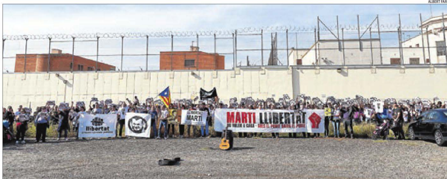
Centenars de persones es van manifestar ahir des del Camp d'Esports fins al centre penitenciari de Ponent.

VITÒRIA | El portaveu del PNB, Aitor Esteban, va justificar ahir que el seu partit no subscrigués el manifest que van rubricar una desena de partits independentistes pel dret a decidir al·legant que "cal anar més enllà de les declaracions i les fotos".