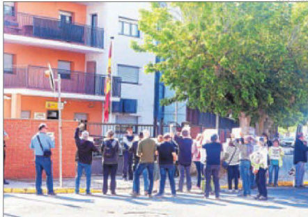
La protesta de Tàrraga, davant de la caserna de la Guàrdia Civil.

El centre per la defensa dels drets humans Iridia va criticar l'actuació policial durant els enfrontaments entre manifestants i agents. L'entitat va qualificar que "desproporcionat" que un policia posés el genoll al coll d'un detingut i va arremetre contra una actuació a persones que eren a la terrassa d'un bar. Així mateix, una furgoneta de la Brigada Mòbil dels Mossos d'Esquadra que circulava per la C-58 va rebre un impacte d'un objecte contundent que van llançar des d'un pont. No hi va haver ferits i es desconeix qui és l'autor dels fets.