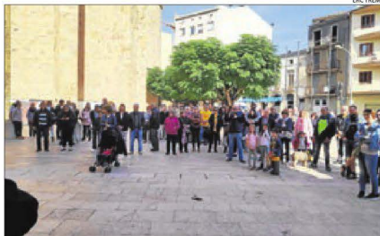
Imatge de la concentració independentista d'ahir a Tàrraga.