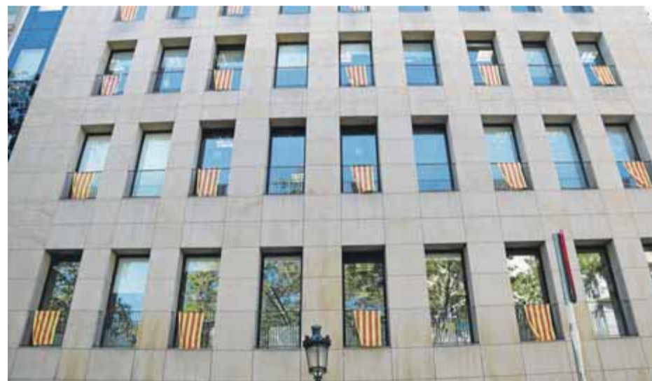
Façana de seu de la direcció general d'Indústria del Govern i d'ACCIÓ amb senyeres a les finestres on abans hi havia llaços grocs ■ ACN

■ Ciutadans porta a les juntes electorals de zona vint-i-tres ajuntaments gironins perquè retirin els símbols "partidistes"