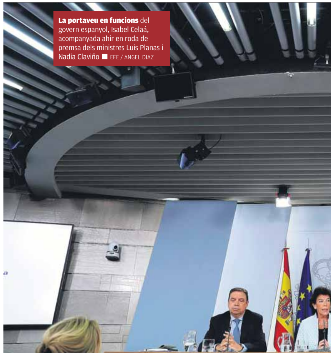
La portaveu en funcions del govern espanyol, Isabel Celaá, acompanyada ahir en roda de premsa dels ministres Luis Planas i Nadia Claviño

L'anunci d'aquest procediment permès en llei orgànica de l'alt tribunal i justificat pel ministre Planas perquè "evita plantejar un nou recurs al TC quan ja hi ha establerta doctrina", també va anar acompanyat d'un advertiment al president del Parlament, Roger Torrent, i a la resta de membres de la mesa. I