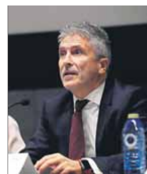
El ministre de l'Interior, Grande-Marlaska

ERC i Bildu han demanat la compareixença del ministre Fernando Grande-Marlaska al ple de la Diputació Permanent del Congrés per informar de "la possible filtració des del Ministeri de l'Interior" de dades de la investigació contra els set presos.