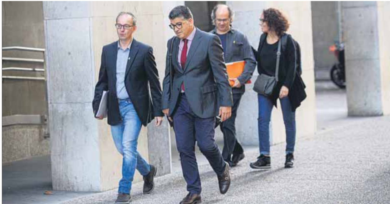
Advocats del grup de Voluntaris pel Dret de Defensa en la seva arribada, ahir, als jutjats de Girona

El jutjat d'instrucció número 2 de Girona va començar a prendre declaració ahir a sis dels 35 efectius de la Policia Nacional que estan sent investigats per les càrregues contra els votants, durant la jornada del referèndum del 1 d'octubre del 2017. Els agents van assegurar que mai havien viscut situacions de tanta violència i odi cap a ells. En el seu cas van actuar en tres o quatre col·legis electorals de la capital gironina, si bé l'interrogatori es va centrar en els fets que es van desencadenar a l'escola Verd. Els policies van assenyalar que es van “sentir amenaçats”, que els manifestants els miraven amb menyspreu, que van rebre insults i que els cridaven “espanyols”, “marxeu d'aquí” o “sou forces d'ocupació”. Els investigats hi van afegir que van passar por; que van acabar prota-