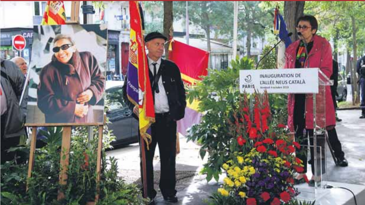
La filla de Neus Català, intervenint en la inauguració del passatge de París dedicat a la seva mare