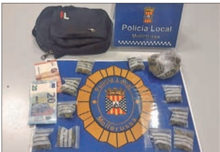
Imatge de tot el que van comissar els agents

La policia local de Mollerussa va detenir dilluns un veí de la localitat, M. B., de 34 anys, com a presumpte autor d'un delictes contra la salut pública en ser sorprès en una zona al costat de les vies de tren amb marihuana i diners en metàl·lic. En aquest sentit, la detenció va tenir lloc el vespre, quan una patrulla que estava efectuant tasques de seguretat ciutadana per la zona del carrer del Comerç va presenciar com l'home, que estava acompanyat de tres persones més, llençava una bossa de mà que duia i la intentava amagar sota una matolls en veure el cotxe policial. L'acció sospitosa va fer que els agents procedissin a identificar-lo i en l'escorcoll de la citada bossa van trobar diners en metàl·lic i una bossa gran i 10