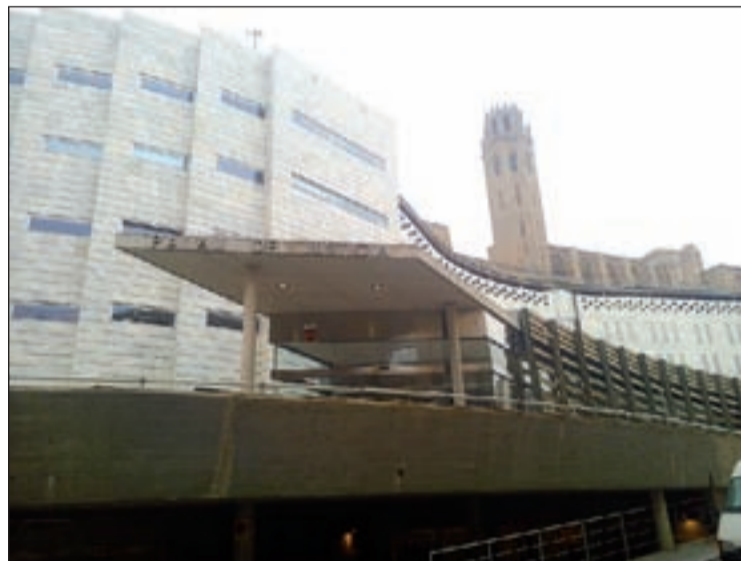
Les parts van arribar a un acord que va evitar el judici

Pel que fa als fets, l'acusada, que actualment té 21 anys, va reconèixer que durant els primers dies del mes de setembre de 2017, quan ella en tenia 18 anys, li va proposar a la seva cosina, que tenia 14 anys, acompanyar-la