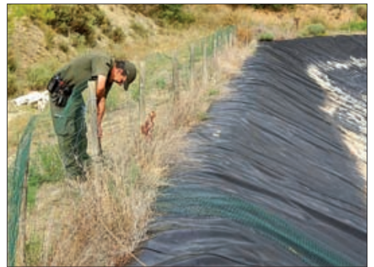
Es va comprovar que s'instal·laven sistemes antilliscants

circumstància que el detingut ja compta amb antecedents penals per tràfic de drogues.