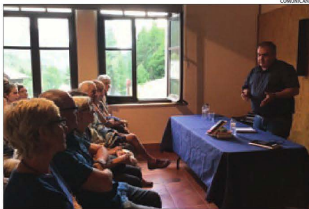
Més de 60 persones van acudir a la presentació de la novel·la.