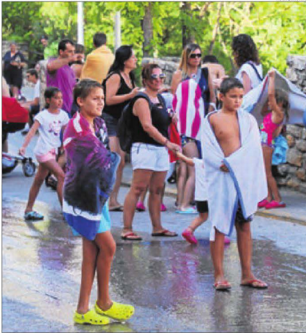
Una festa de l'escuma va fer les delícies dels nens a Ager.