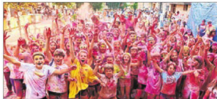
Una de les anteriors edicions de la festa.

De dia, fa una crida a l'acció al convocar zumba, torneig de vòlei, gimcana, bàsquet 3x3 o futbol. També insta a ser solidaris, tot celebrant el segon