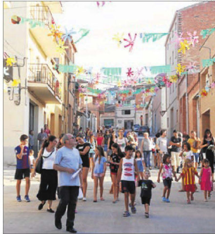
Els carrers d'Arbaca, engalanats per al tradicional concurs.