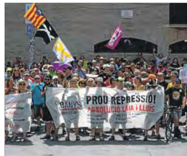
Manifestació en favor dels dos acusats, abans-d'ahir, pel centre de Barcelona

Per aquests fets, el fiscal demana quatre anys de presó per atemptat a l'autoritat i dos anys més, com a Laia Roca, per moure un contenidor al mig de la via. La parella va ser identificada hores després per la Guàrdia Urbana en circumstàncies que la seva defensa, que en demana l'absolució, qüestiona. ■