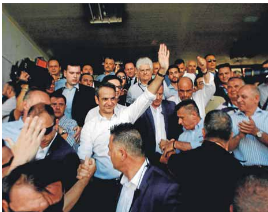
Mitsotakis celebra la victòria electoral amb els seguidors de Nova Democràcia

El resultat certifica el fracàs de l'esquerra de Syriza després de la intervenció econòmica