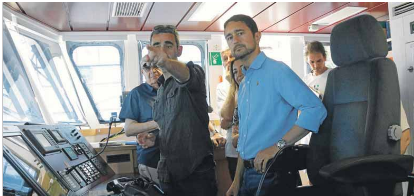
El conseller de Territori, Damià Calvet, ahir dalt del vaixell de Greenpeace 'Rainbow Warrior' al port de Barcelona ■ ACN

■ La crisi entra al govern amb el conseller Calvet instant la direcció republicana a presentar-los “una proposta concreta” ■ Dirigents del PDeCAT rebutgen anul·lar els acords municipals amb el PSC