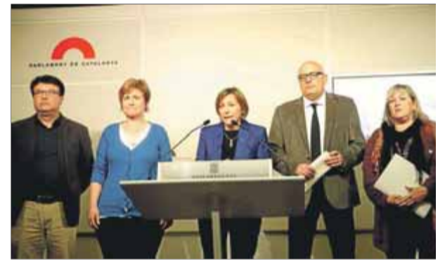
Els membres de la mesa del Parlament processats per desobediència, amb la presidenta, el 2017