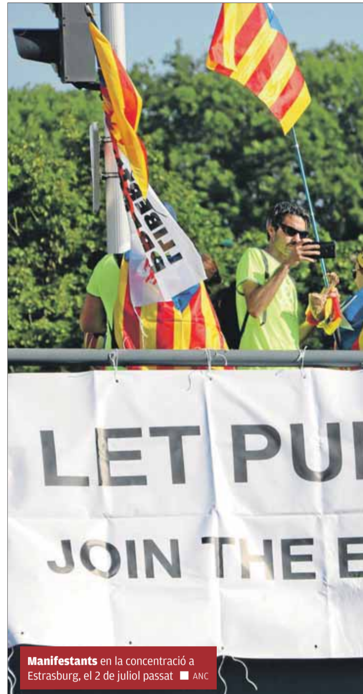
Manifestants en la concentració a Estrasburg, el 2 de juliol passat

La reclamació de Puigdemont i Comín l'hauran de resoldre primer els jut-