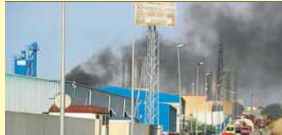
El fum de la nau cremada, ahir, a Tarragona