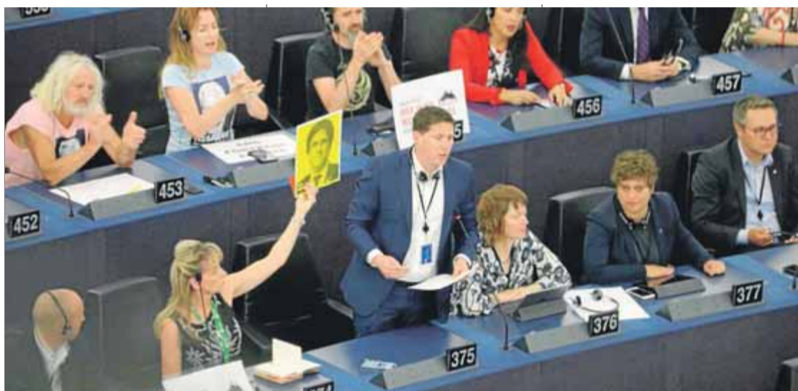
Diputats del Sinn Féin mostren cartells dels eurodiputats catalans que no han pres possessió del càrrec

Hem vist també com la situació dels tres eurodiputats cata-