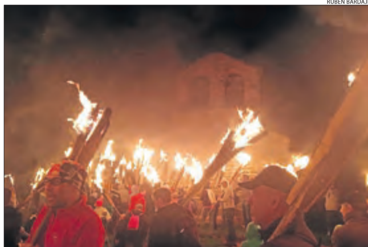
La població de la Durro és la primera que celebra falles.