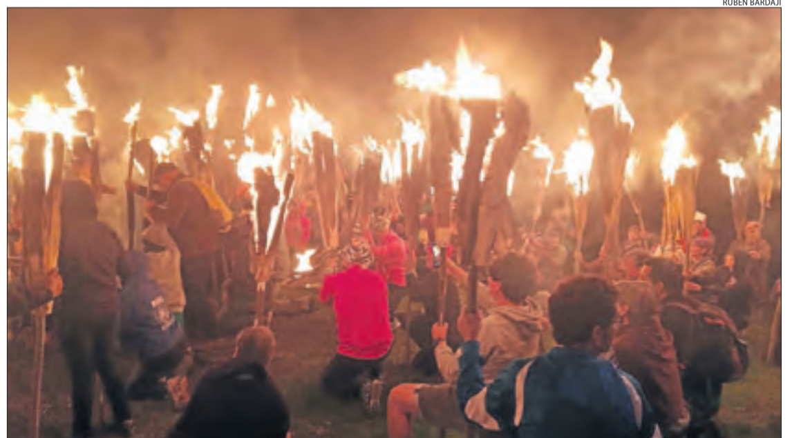
Fallaires que van participar en la baixada dissabte a la nit a Durro.

avui el relleu de Durro i es preveu que un centenar de fallaires participi a la festa, entre els quals també dones per segon any consecutiu.