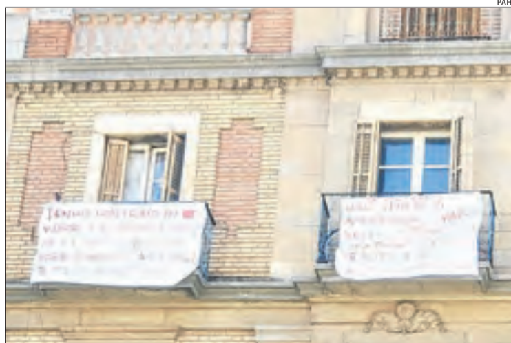
Pancartes que denuncien assetjament immobiliari.