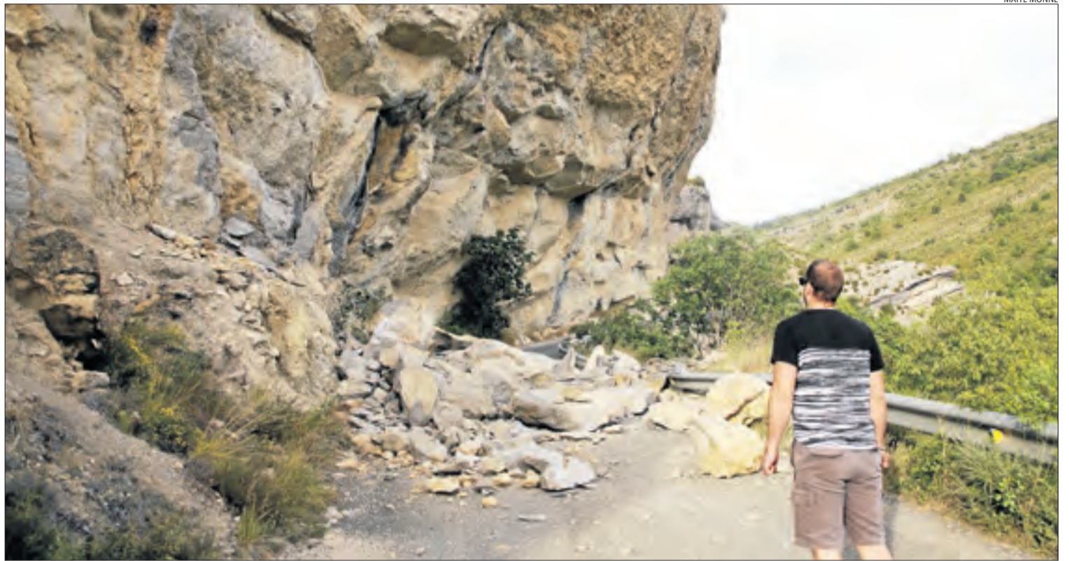
Les roques despreses que tallen la carretera d'accés a Mont-rebei.

La Diputació afirma que avui acudirà un tècnic per determinar la titularitat del tram afectat