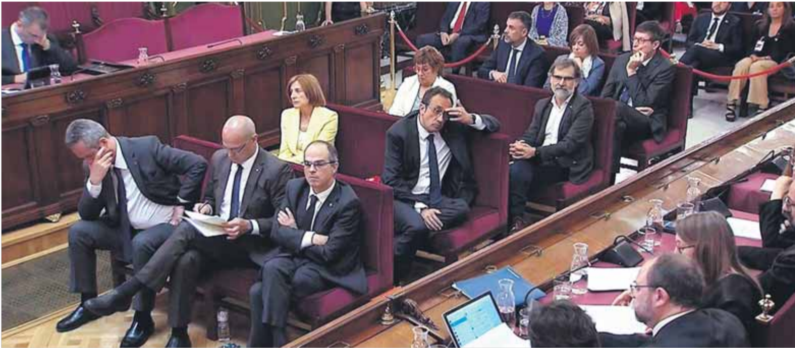
Part dels acusats en la darrera sessió del judici, en què van fer ús del seu dret a l'última paraula

■ Reclama al Suprem que els mantingui en presó per “risc de reiteració delictiva” en no mostrar penediment en les seves darreres paraules ■ Hi afegeix el risc de fugida davant la sentència