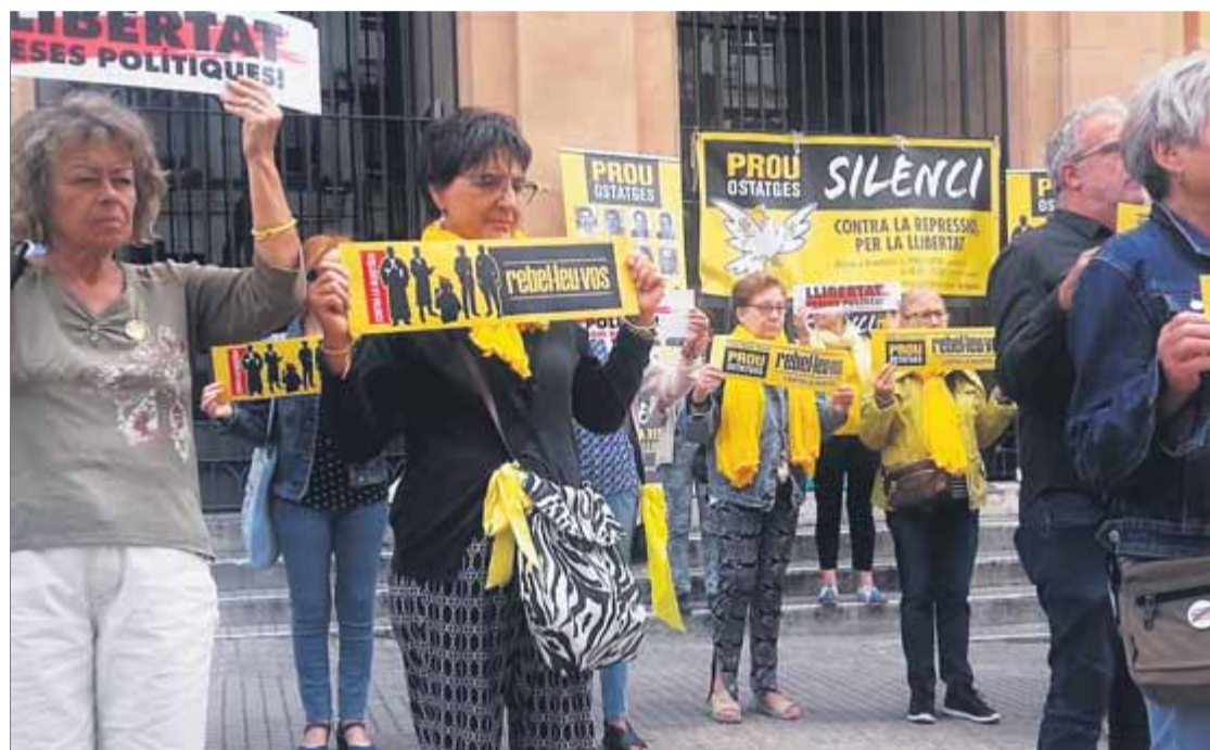
Una de les accions del col·lectiu Silenci... Rebel·leu-vos, a Tarragona aquest any ■ EL PUNT AVUI

L'experiència a Tarragona, que precisament aquest dimarts dia 11 va complir un any, ha estat brutal. El convenciment i la persistència dels integrants de Silenci... que en bona part no es coneixien entre si, vinguts de diversos llocs i per diverses raons—han permès, durant aquests dotze