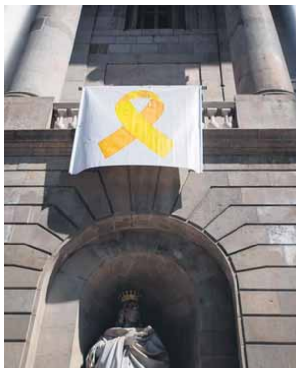
El llaç groc penjat ahir al balcó de l'ajuntament de Barcelona, tal com va anunciar Colau