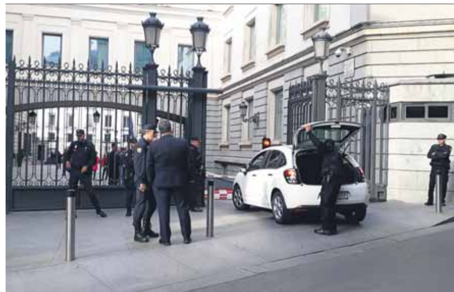
Controls i escorcolls ahir a les portes del Congrés de Diputats ■ EL PUNT AVUI

Dels 54 electes, 20 eurodiputats són del PSOE (amb Borrell al capdavant); 12, del PP (entre els quals, Montserrat); 7, de Ciutadans; 6, d'Unides Podem; 3, de Vox; 3, d'Ara Repúbliques (un dels quals és Junqueras); 2, de Junts (Puigdemont i Comín), i Izaskun Bilbao, del PNB (Coalició per una Europa Solidària). ■