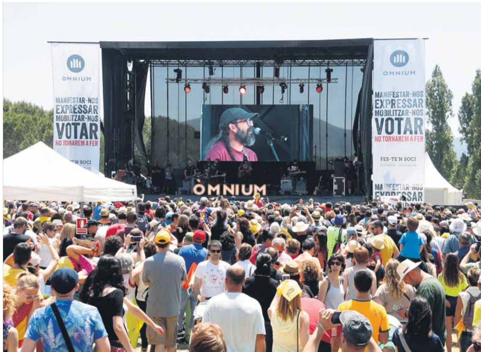
Els manresans Gossos, durant el concert que van oferir ahir en la segona edició del festival Cultura Contra la Repressió

■ El festival Cultura Contra la Repressió, impulsat per Òmnium, aplega 25.000 persones a Santa Perpètua de Mogoda, municipi de Jordi Cuixart ■ Hi van actuar Txarango, Gossos o Oques Grasses