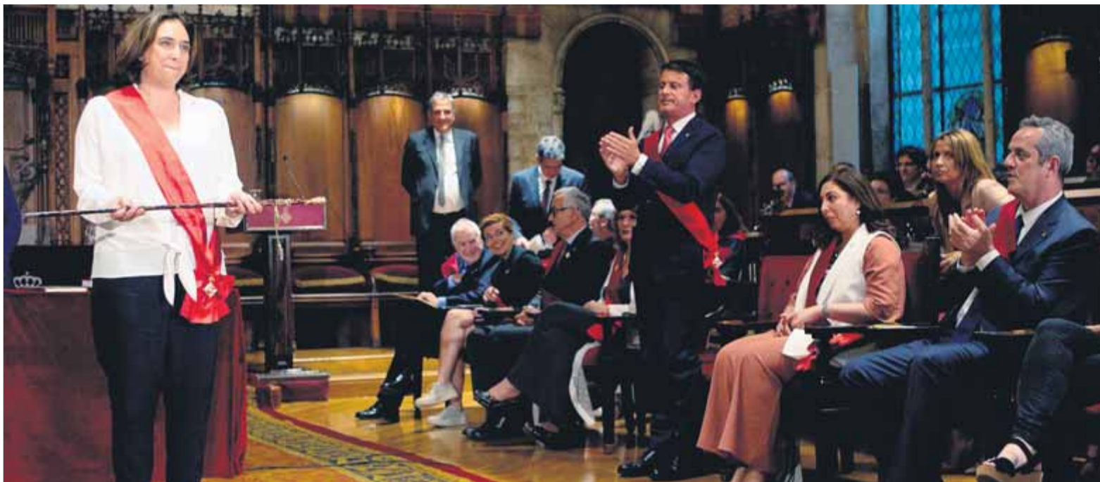
Moment en què Manuel Valls s'aixeca per aplaudir la seva alcaldessa

■ Carrizosa remarca que comparteixen valors i programa amb l'ex-primer ministre francès i l'insta a continuar treballant plegats a Barcelona ■ El diputat taronja torna a la càrrega contra el llaç groc