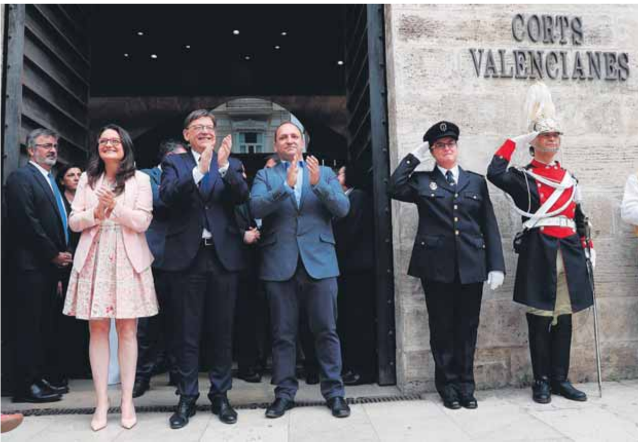
Ximo Puig, Mónica Oltra i Rubén Martínez Dalmau, ahir, a la porta de les Corts Valencianes