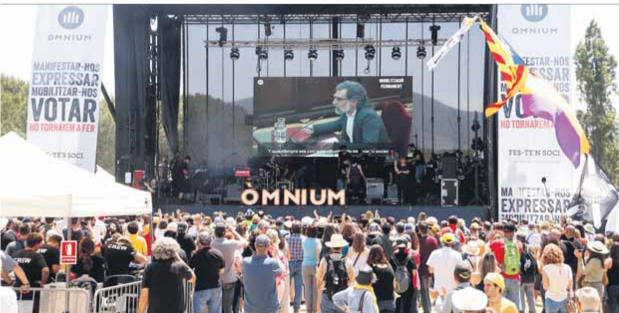
L'escenari del festival, ahir, a Santa Perpètua de Mogoda, amb una projecció de Cuixart durant el judici

RÀNQUING • Les forces independentistes concentren la major part d'alcaldies, amb JxCat (370) i ERC (359) al capdavant