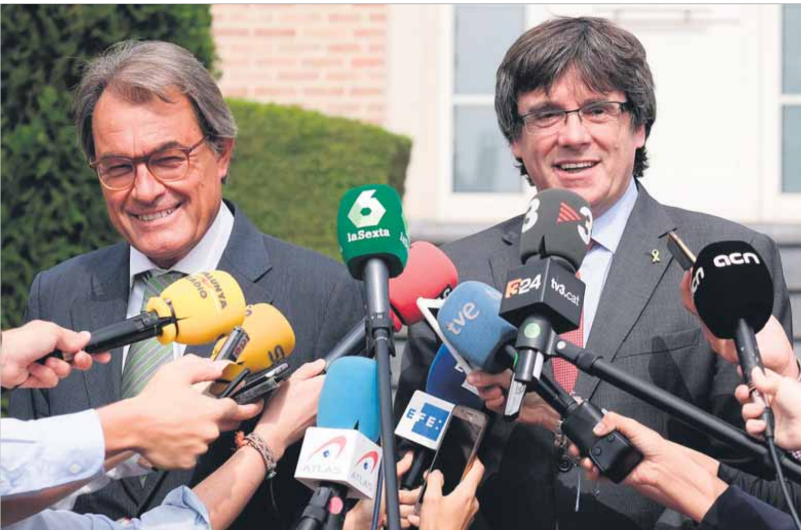
Artur Mas i Carles Puigdemont, el 4 de setembre passat, a Waterloo