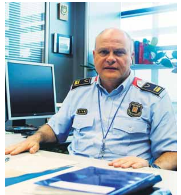
L'intendent Vicenç Gasulla, sotscap de la comissaria general de mobilitat dels Mossos d’Esquadra

■ Aquest estiu, la policia llança una campanya en set idiomes perquè es respectin les normes de circulació