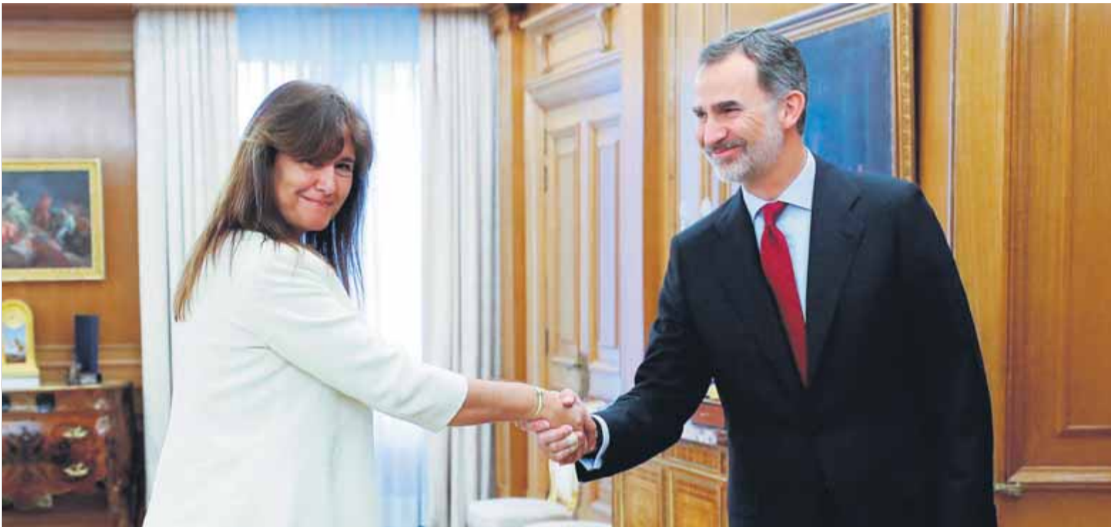
La portaveu de JxCat Laura Borràs encaixant la mà del rei Felip VI en la seva visita a La Zarzuela per a la tanda de contactes del rei

La portaveu de JxCat infligeix a Felip VI la cita més incòmoda citant els presos polítics, lliurant-li la carta de Sánchez i reprotxant-li el 3-0 ■ El rei defensa el discurs del 2017 i Asens també li ho retreu