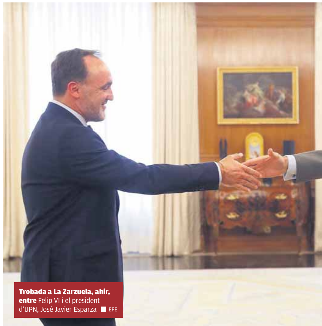
Trobada a La Zarzuela, ahir, entre Felip VI i el president d'UPN, José Javier Esparza

Els dos vots que falten fins als 175 no els donarà Coalició Canària, perquè Ana Oramas es va negar ahir amb vehemència a avalar una coalició o aliança del PSOE amb Podem. "CC només donaria suport a un govern de Sánchez en minoria", va dir Oramas. I aquí és on entraria en joc el navarrès Javier Esparza (UPN), que, després de ser rebut per Felip VI, s'oferia