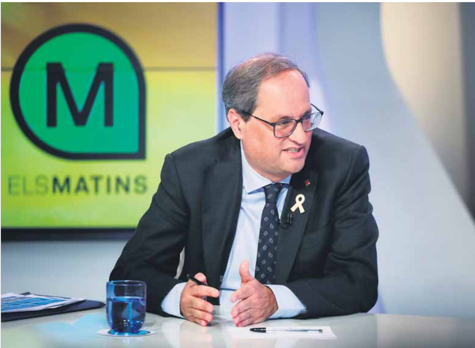
El president de la Generalitat, Quim Torra, durant l'entrevista a TV3