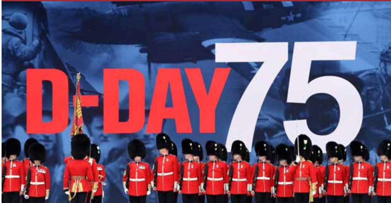
Un grup de soldats participant en l'acte de commemoració del desembarcament de Normandia, a Portsmouth

Demanen sortir de la presó i prendre possessió com a eurodiputat i regidor