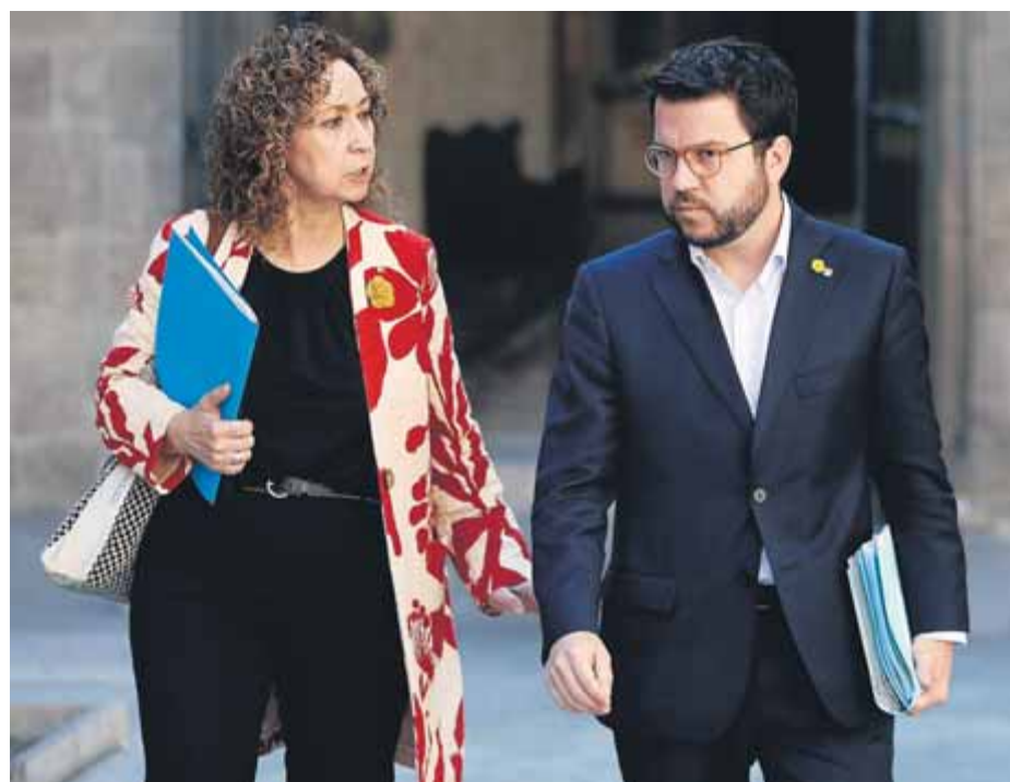
El vicepresident, Pere Aragonès, amb la consellera de Justícia, Ester Capella

efectiva és el control i la inspecció del pagament dels tributs, ja que un dels focus del frau continua sent el nombre de contribuents que no paguen impostos. Així, el pla anterior (2015-2018) va fer aflorar 740 milions d'euros gràcies a 207.685 actuacions. La part més important es va recuperar de deutors de l'impost de successions i donacions, amb 271,3 milions; seguit de l'impost sobre transmissions patrimonials i actes jurídics documentats (260,8 milions) i l'impost sobre el patrimoni (171,3 mi-