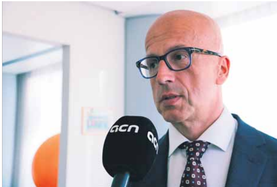
El vicepresident Telicka vol que Tajani doni explicacions sobre el vet

peu i membre de la CDU alemanya. A la queixa inicial del conservador polonès Zdzislaw Krasnodebski s'hi van afegir ahir dos vicepresidents més: el liberaltxec Pavel Telicka i la socialista francesa Sylvie Guillaume. Telicka va anunciar ahir que ha demanat per escrit explicacions a Tajani pel vet a Puigdemont i Comín i en semblants termes ha reaccionat la vicepresidenta Guillaume. Responent a la carta de 75 eurodiputats adreçada a Tajani i als vicepresidents del Parlament, Guillaume ha demanat a Tajani "una clarificació" sobre el tema i ha destacat que cap dels vice-