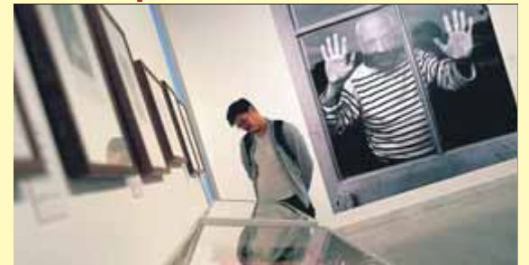
Una de les sales de la nova exposició

CANVIS • El govern destina 32,4 milions al dispositiu i articula un nou model organitzatiu amb menys efectius però més mesos