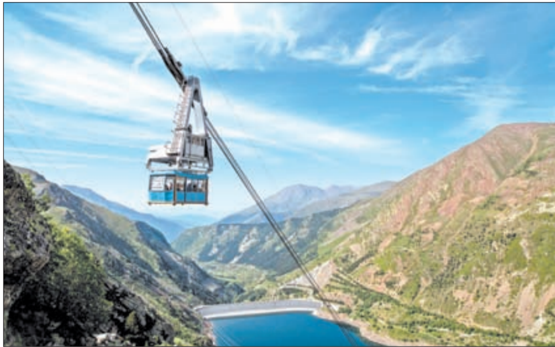
FOTO: / El telefèric de la Vall Fosca va transportar l'any passat més de 25.000 turistes