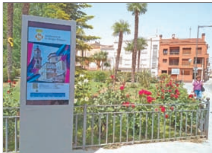
Nou panell digital instal·lat als Jardins del Terrall

L'Ajuntament de les Borges Blanques ha instal·lat aquesta setmana un tòtem digital als Jardins del Terrall amb informació sobre les diverses activitats que hi ha programades al municipi. Es tracta d'una iniciativa que pretén millorar els canals de comunicació del consistori amb l'objectiu de difondre informació actualitzada i en temps real.