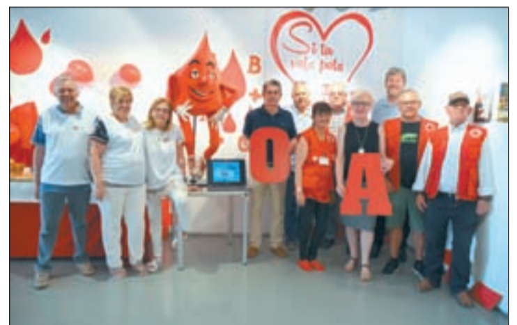
La Marató va començar a les 10.00 hores

cies municipals perquè estiguin a l'abast de tothom. El model escollit, que és portàtil gràcies a les rodes que incorpora, té com a principal avantatge la facilitat amb la qual es col·loca i es transporta. Així mateix, l'elevador disposa d'un doble sistema d'accionament que permet a l'usuari utilitzar-lo sense ajuda de ningú des de l'interior de la piscina.