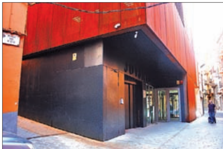
El jutjat de Balaguer va ordenar l'ingrés a presó

El titular del jutjat d'Instrucció en funcions de guàrdia de Balaguer va ordenar presó pel conductor d'un turisme que va causar un accident de trànsit el passat 2 de juny a Cubells. En aquest sentit, segons van explicar ahir fonts properes al cas, la investigació iniciada pels agents de l'Àrea Regional de Trànsit de la Regió Policial de Ponent del Mossos, per tal d'esbrinar les causes de l'accident, va portar a la conclusió que el detingut, un jove de 27 anys, de nacionalitat xinesa i amb domicili desconegut, va fer un avançament a un camió en un tram prohibit, concretament al quilòmetre 36 de la C-26, on hi havia línia contínua, provocant una col·lisió frontal amb un vehicle que