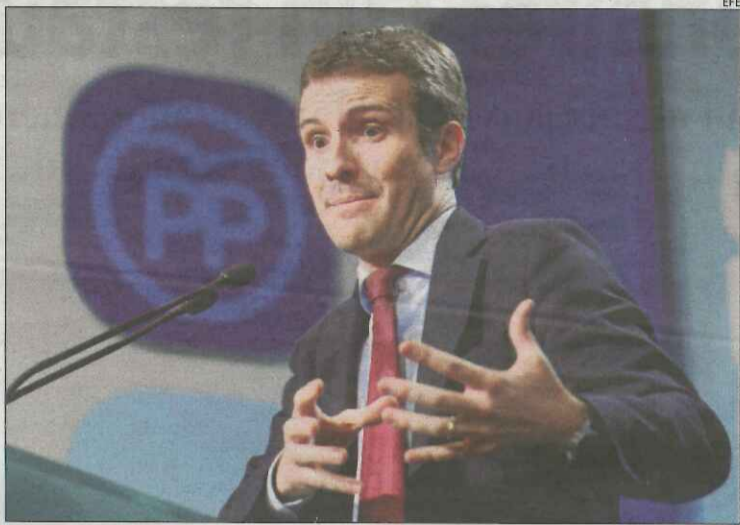
Imatge d'arxiu del president del PP, Pablo Casado.

De moment, Abascal va admetre haver tingut contacte "informal" amb el líder del PP, Pablo Casado, en una conversa telefònica. En canvi, no ha tin-