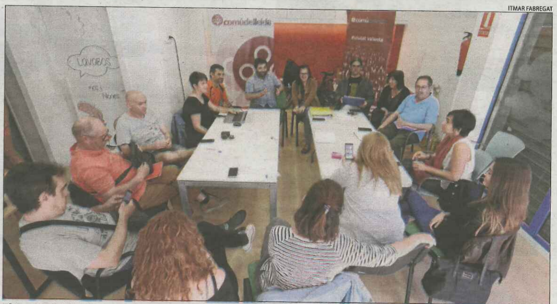
El Comú de Lleida va reunir ahir el seu comitè executiu.

mateix, el Comú va reunir ahir el seu comitè executiu per analitzar la situació actual i començar a fixar les seues posicions. Talamonte va apuntar que amb tota probabilitat necessitaran més reunions del comitè abans de començar les converses amb els republicans. De moment, el Comú no ha deixat clar si prefereix formar part d'un govern amb ERC i Junts per Catalunya o bé quedar-se a l'oposició i negociar cada projecte. En tot cas, la decisió la prendran en assemblea.