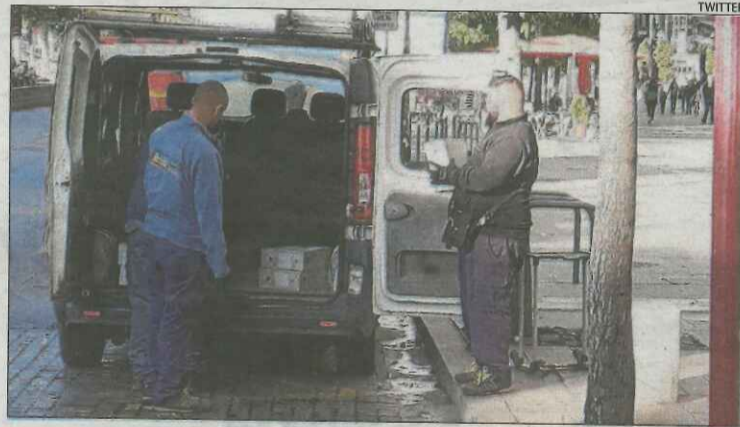
Trasllat de documents ■ Ahir es van traslladar fitxers de Sant Francesc a l'arxiu de Gardeny. Fonts municipals van indicar que s'efectua periòdicament i ho va desvincular del canvi de govern.

D'aquesta manera, ERC ha de negociar el cartipàs, els suports necessaris per poder ser investit (necessita majoria absoluta en la primera volta i en la segona es designa directament el cap de llista de candidatura més votada) i també el pacte que faciliti la seua governabilitat, amb tota seguretat amb Junts per Catalunya Lleida i, eventualment, amb el Comú, si així ho decideix finalment aquesta formació en assemblea.