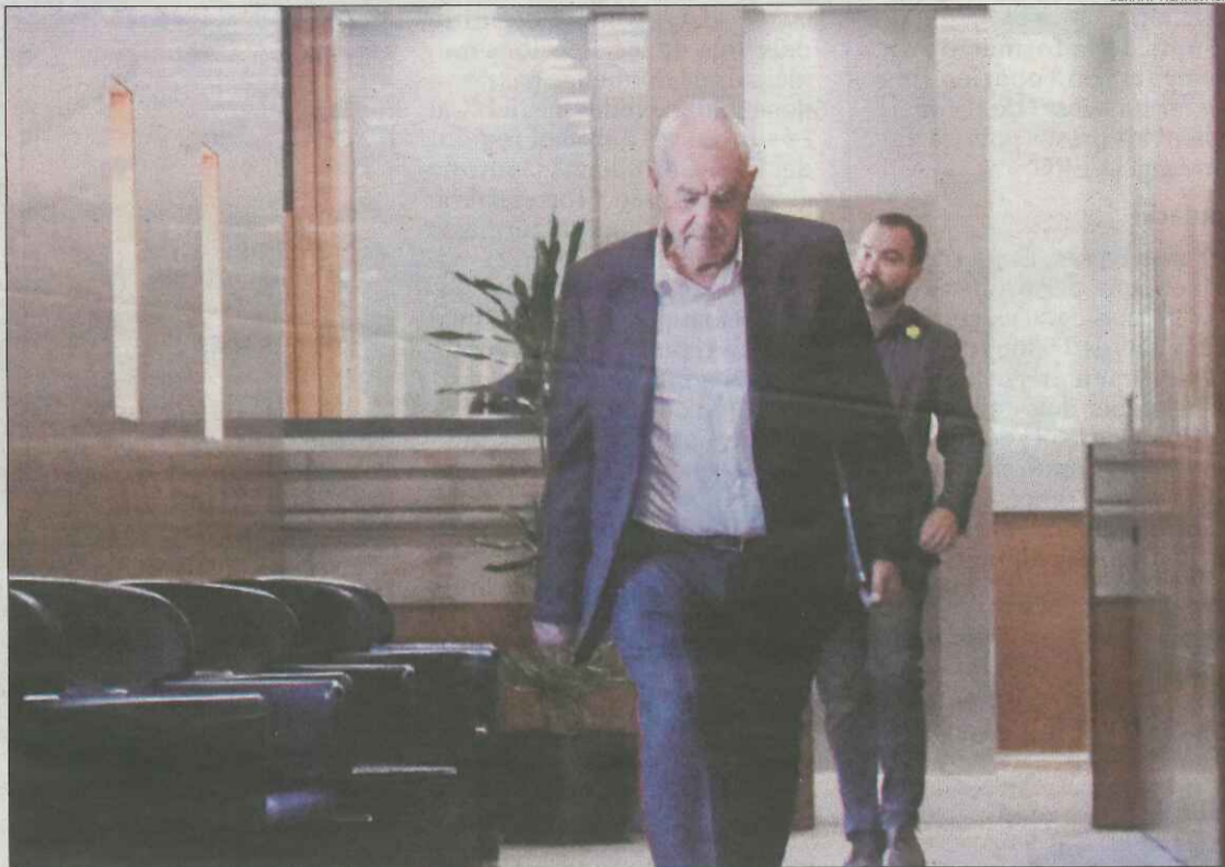
El candidat d'ERC a l'alcaldia de Barcelona, Ernest Maragall, ahir al Parlament.

El mateix Maragall va assegurar, després de reunir-se amb la número dos de JxCat a Barcelona, Elsa Artadi, que la líder de BComú està disposada a fer-lo alcalde de la capital catalana.