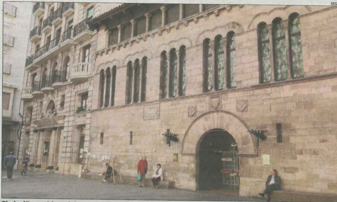
El ple d'investidura del nou alcalde està previst per al 15 de juny.

En ocasions, l'alcalde ha decidit prorrogar el seu nomenament fins a l'aprovació del nou cartipàs, el document que detalla la nova organització mu-