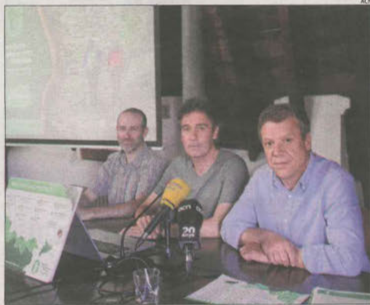
Presentació dels Festivals de Senderisme dels Pirineus, ahir.