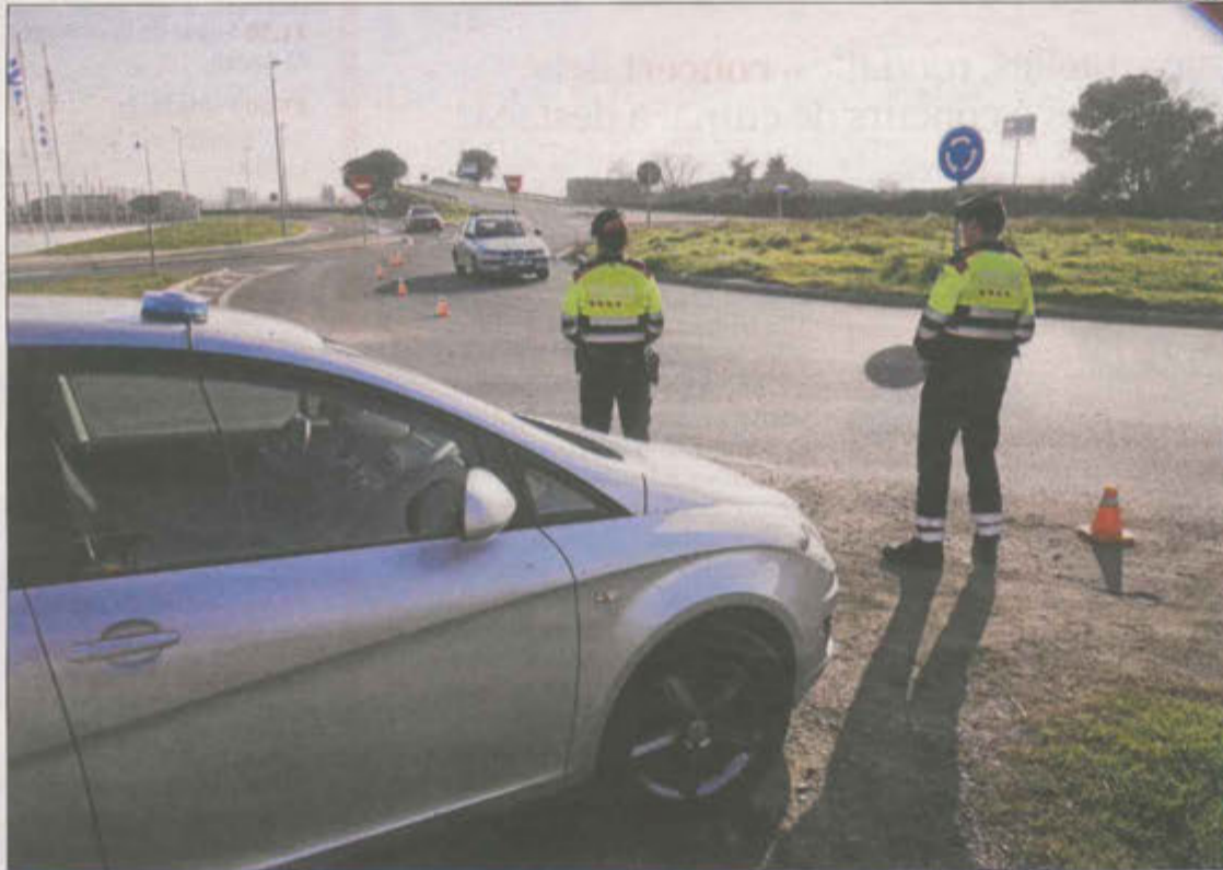
Imatge d'arxiu d'un control dels Mossos d'Esquadra a Vila-sana.