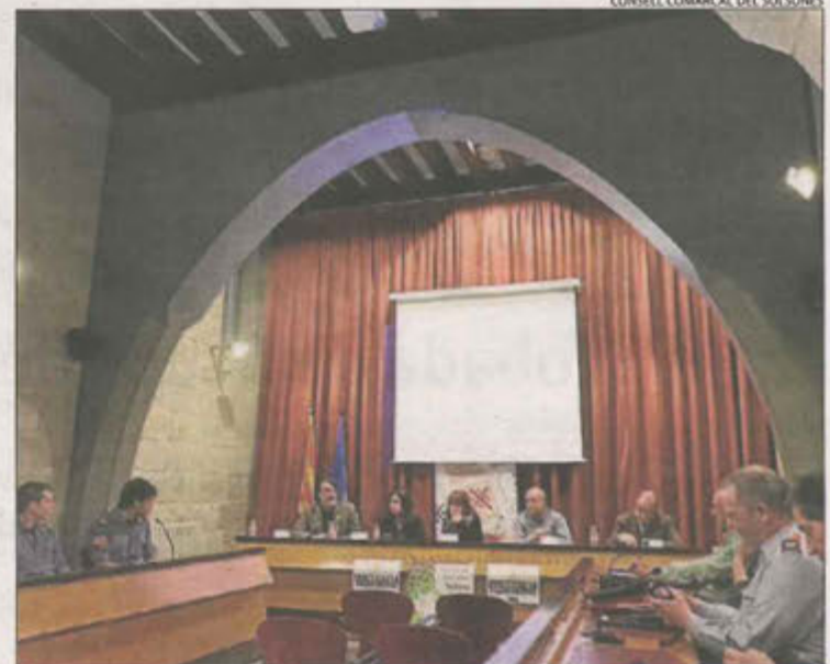
Reunió dimarts de la Taula del Foc al Solsonès.

del, l'administració du a terme campanyes de sensibilització i difusió, a més de planificar projectes per potenciar els bons hàbits dels ciutadans als boscos. Un altre model que es tindrà en compte és el nord-americà, que treballa amb comunitats per prevenir els riscos i les pèrdues en cas d'incendis. A partir d'aquí, el GRAF proposa crear comissions en les quals cada agent porti les seues capacitats en la matèria.