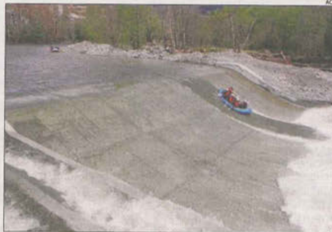
Una barca baixa per la nova presa de l'Hostalet.