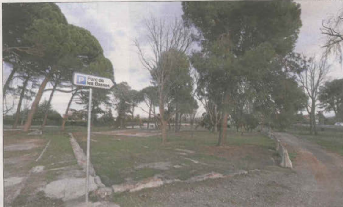
L'antic parc de les Basses, on es projecta un dels càmpings ara paralitzats a Lleida.

En lloc d'això, la solució que proposa el pla director és que els càmpings que sobrepassin