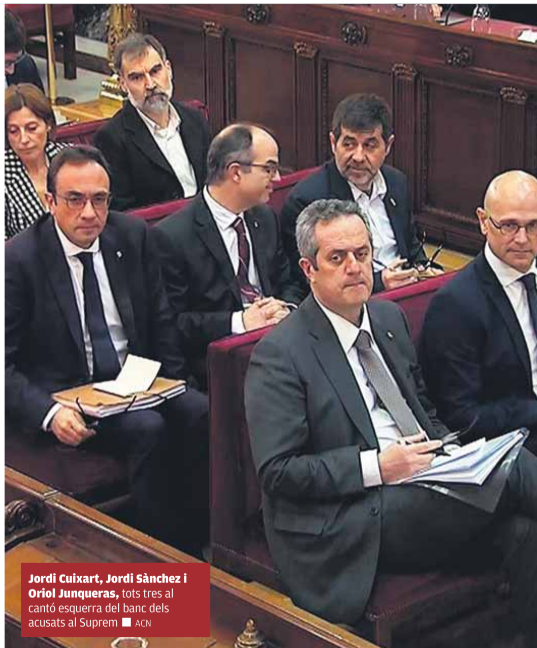
Jordi Cuixart, Jordi Sánchez i Oriol Junqueras, tots tres al cantó esquerra del banc dels acusats al Suprem

Va explicar que el govern espanyol havia enviat fins a 59 pàgines per defensar la seva posició, però que no s'havia pogut imposar en cap punt. A la conferència de premsa també hi era l'exconsellera Clara Ponsatí, que va