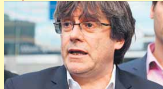
Puigdemont, ahir davant de la seu de l'eurocambra