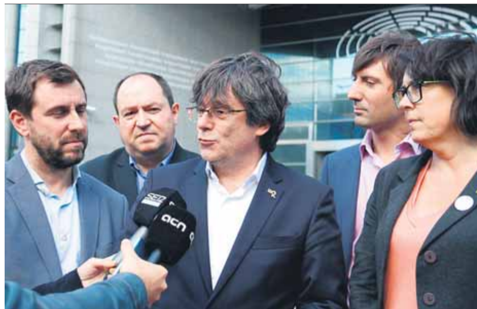
Puigdemont i Comín atenent ahir la premsa a la porta del Parlament Europeu