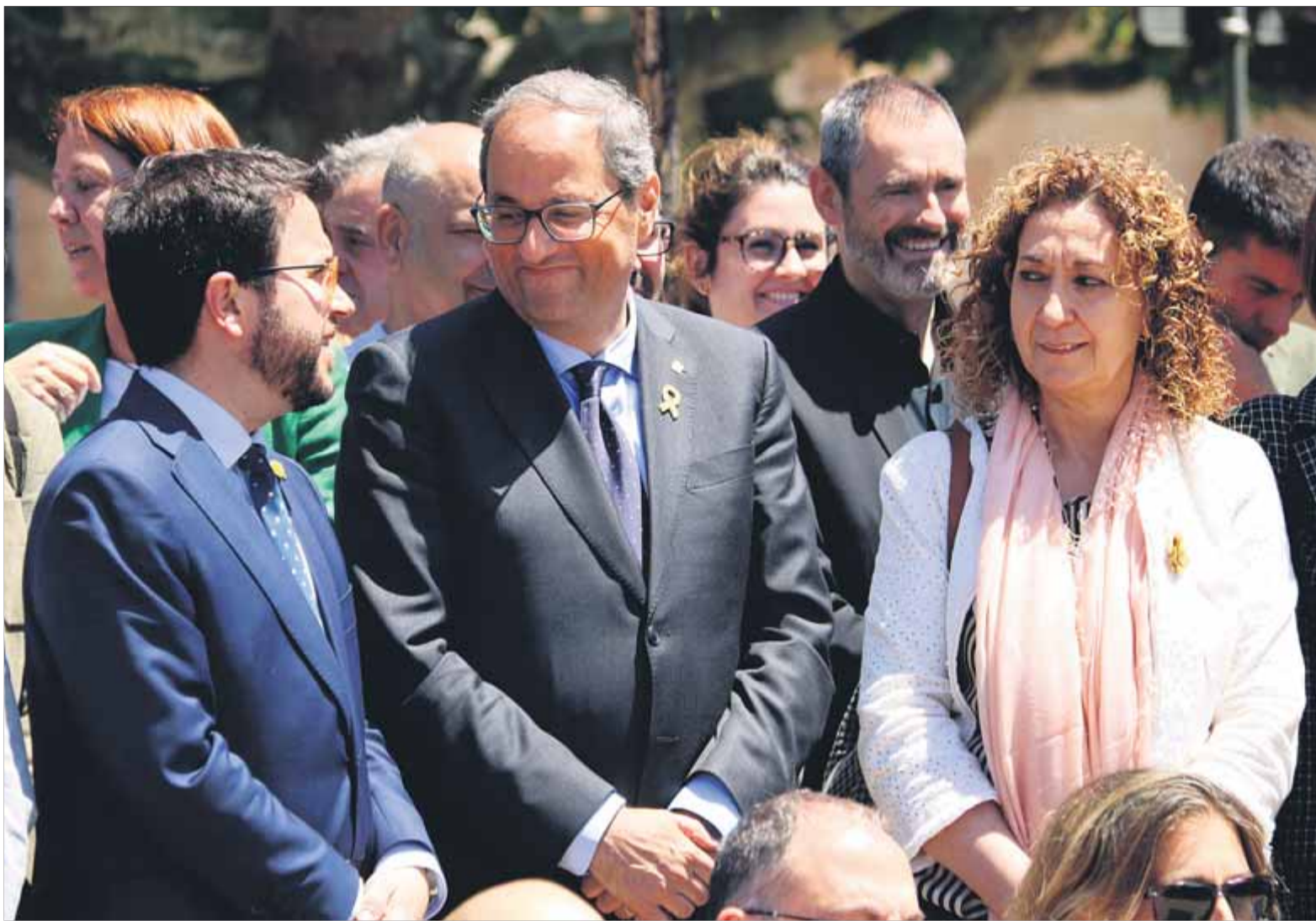
El president Torra i el vicepresident Aragonès, ahir, als afores del Parlament en l'homenatge a Forcadell pel seu aniversari