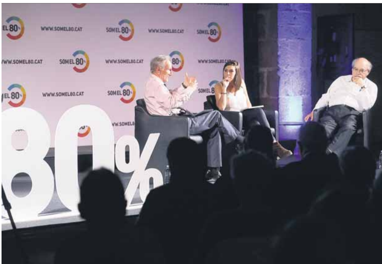
Alguns dels signants del manifest van protagonitzar quatre converses sobre el conflicte polític ■ JUANMA RAMOS