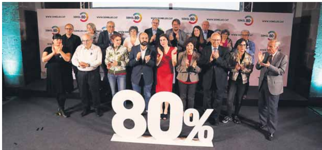
Un moment de l'acte transversal pels grans consensos nacionals que es va fer ahir al Museu Marítim de Barcelona

El Senat materialitza la suspensió de Romeva