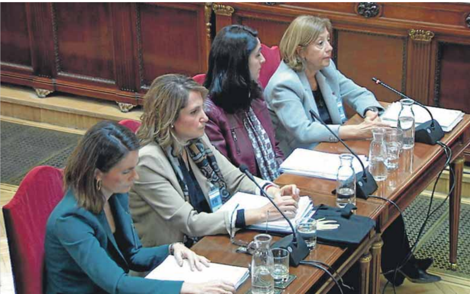
Quatre pèrites del Ministeri d'Hisenda, proposades per la fiscalia i l'advocada de l'Estat, en el judici al Tribunal Suprem, ahir