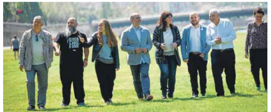
Maragall, amb candidats d'ERC a les llistes de Badalona, Montcada, Sant Adrià i Santa Coloma, ahir al parc fluvial del Besòs

Ahir també es va fer públic que el cara a cara que protagonitzarà amb la candidata de Barcelona en Comú, Ada Colau, tindrà lloc demà, divendres, a dos quarts d'onze del matí a Ser Catalunya.