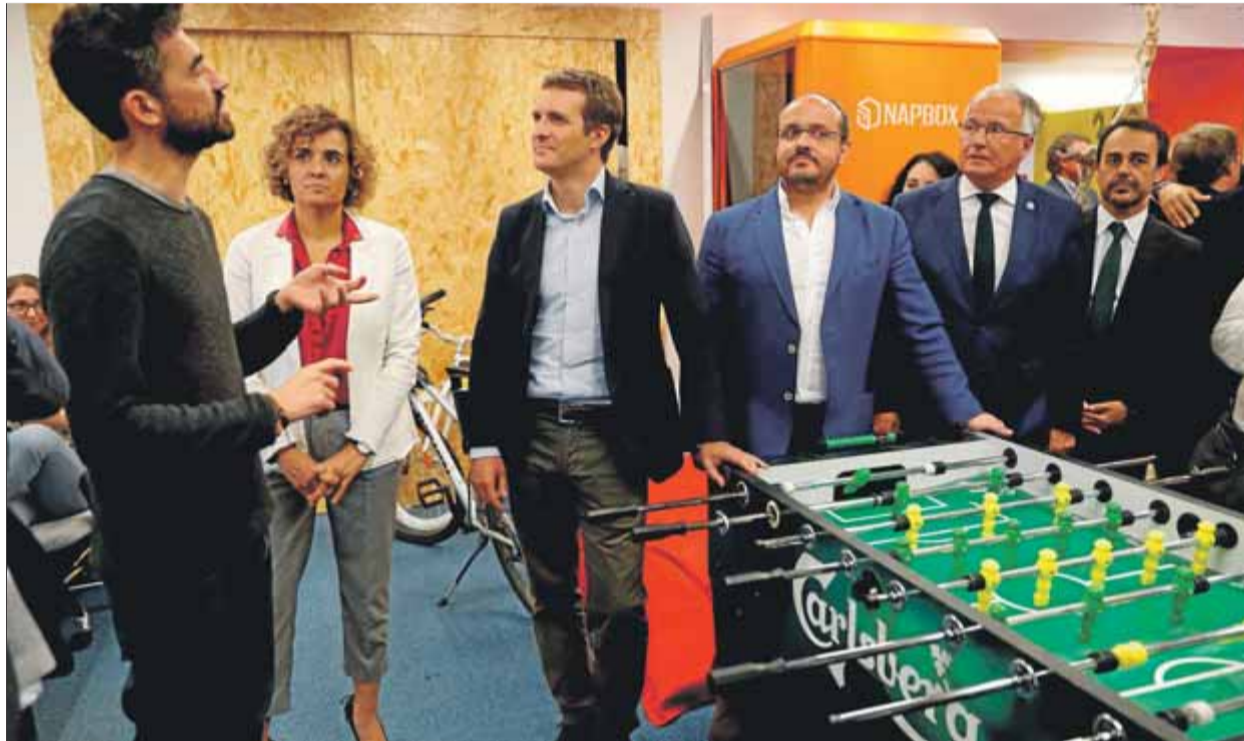
El president del PP, Pablo Casado, i la resta de dirigents visitant ahir el 'hub' tecnològic Pier01 Tech City de Barcelona

Tant és així que Casado ha obert un nou front judicial, ara per les imatges gravades en vídeo per Oriol Junqueras, Jordi Sánchez, Jordi Turull i Josep Rull, que, segons el dirigent popular, suposarien un delictes de desobediència perquè haurien incomplert les ordres del Tribunal Suprem, que els impedia expressament comunicar-se de manera pública durant la seva assistència al Congrés dels Diputats per recollir les acreditacions i participar en la sessió constitutiva. Així ho va explicar el dirigent popular en la seva visita ahir a Barcelona acompanyat dels candidats a les municipals i les europees, Josep Bou i Dolors Montserrat, respectivament. En la denúncia registrada ahir també s'indica la possibilitat d'haver comès un