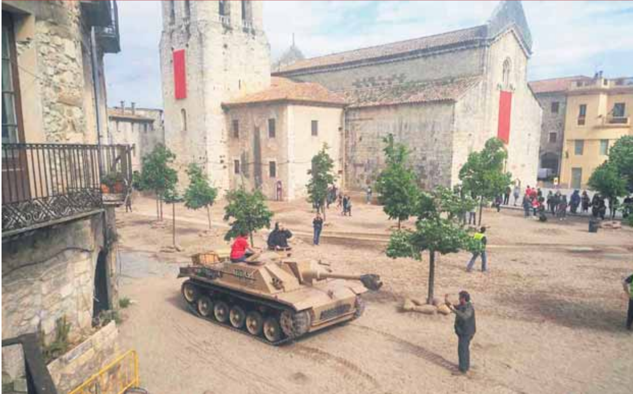
Un tanc al bell mig de Besalú, durant el rodatge de la sèrie d'HBO 'Westworld'