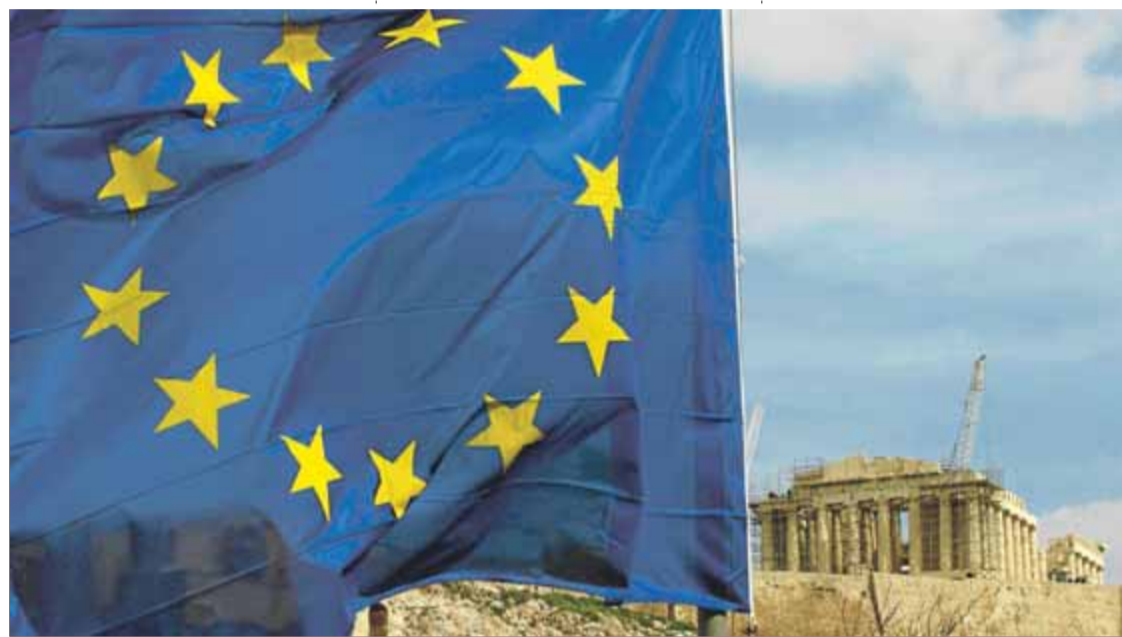
Una bandera de la Unió Europea es veu al davant del temple del Partenó, a Atenes, en una imatge d'arxiu

La manera com Europa gestioni els desitjos d'aprofundiment