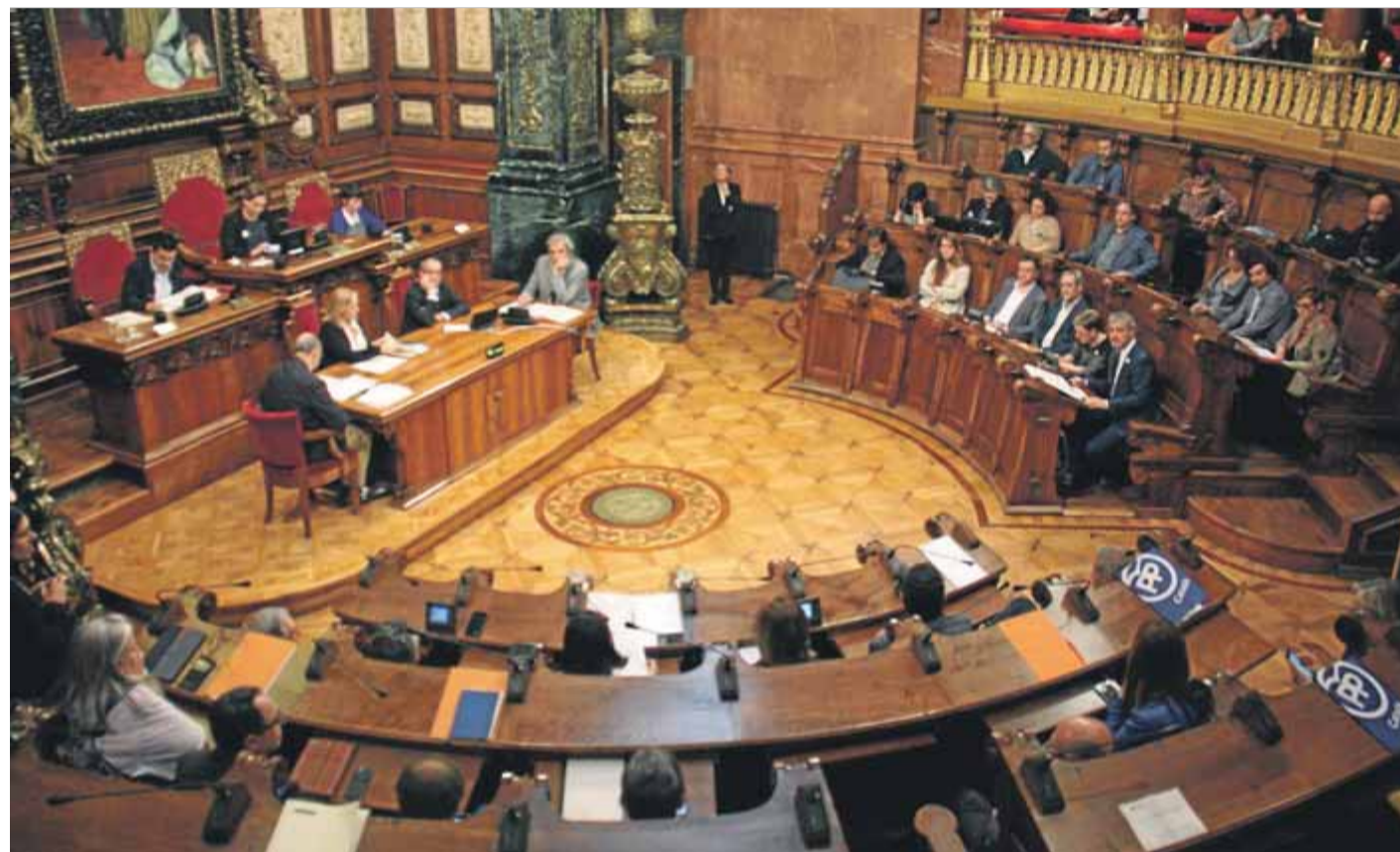
A hores d'ara, és una incògnita quins candidats –i, sobretot, en quin ordre– seuran el 15 de juny al saló de plens del consistori barceloní ■ ACN

Esquerra també ha proposat un govern post 26-M. Maragall l'anomena "el govern del 80%" o "del pacte democràtic". Aquest executiu, liderat per ERC, sumaria els comuns i Junts per Catalunya (JxCat). Cap dels interpel·lats hi està d'acord. Colau diu que mai governarà amb els postconvergens i apressa ERC a decidir quin model de ciutat vol, si el seu o el de JxCat, la qual defensa que ells són "el canvi" i que "apuntalar Colau no és canvi". Fora d'aquí, tam-