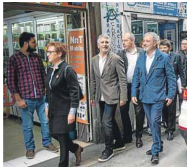
Grande-Marlaska i Collboni, ahir pel Raval

Guàrdia Urbana com el "valor afegit" del cos perquè permet als agents relacionar-se amb els comerços, els veïns i les associacions del barri i conèixer els problemes d'incivisme i inseguretat. De fet, el candidat dona tanta importància a l'incivisme com a la inseguretat i culpa l'alcalde Colau d'haver fracassat a l'hora de "traslladar als ciutadans que hi ha normes i que s'han de complir en l'espai públic". Collboni no atribueix la "crisi d'inseguretat" només al déficit d'un marc legal que no penalitza