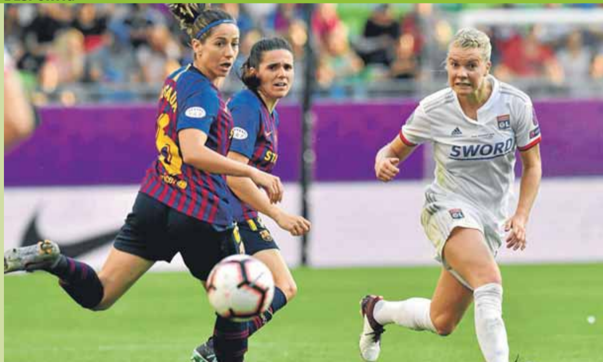
Eugenie Le Sommer, del Lió, en una jugada del partit amb Vicky Losada, a l'esquerra, i Andrea Pereira