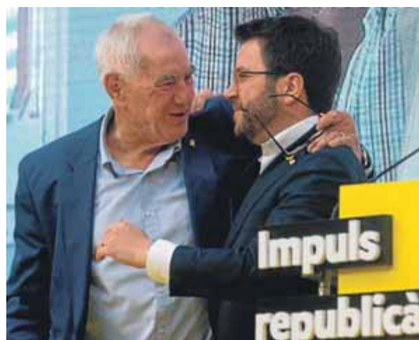
Maragall i Aragonès, ahir en el míting a Sant Andreu

amb ella, sinó a substituir-la i a governar”. El candidat, de fet, va preguntar-li si pensa mantenir la “prioritat d'entesa” amb el PSC de Jaume Collboni, un partit a qui va retreure que “lidera la repressió a Catalunya ara mateix” perquè “forma part de la farsa democràtica de l'Estat”, i ahir especialment per la seva complicitat amb la fiscalia, que acusa de pertinença a organització criminal diversos servidors públics. “El Parlament de Catalunya no és el pati privat de