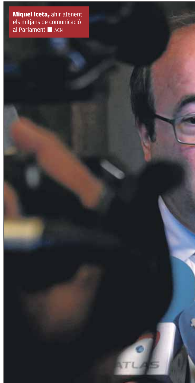
Miquel Iceta , ahir atenent els mitjans de comunicació al Parlament

Arran del vot contrari, i en un intent de desbloquejar la situació, el PSC va reclamar a la mesa del Parlament que la votació secreta per designar el senador, en lloc d'electrònica fos mitjançant paperetes, un sistema que no permet el vot contrari, ja que tot allò que no fos el nom de la per-