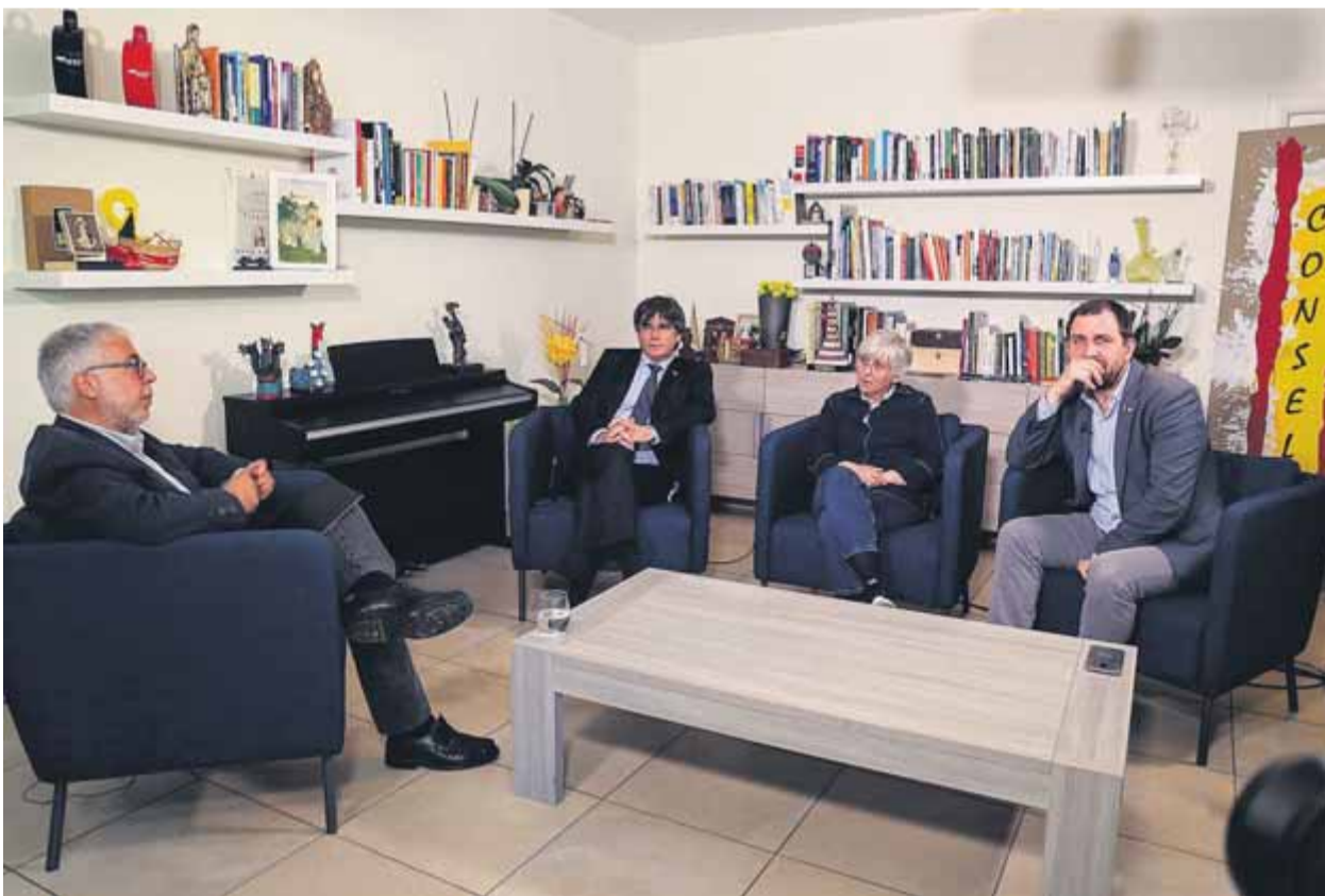
El Punt Avui TV va emetre ahir -i reemet aquest matí- la conversa enregistrada a principi de setmana a Waterloo ■ J.M. PADRÓS