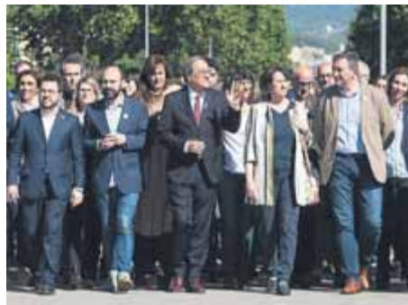
Torra arribant acompanyat al TSJC

El president afirma davant del TSJC que l'òrgan és còmplice de Cs i el PP en l'afer dels llaços