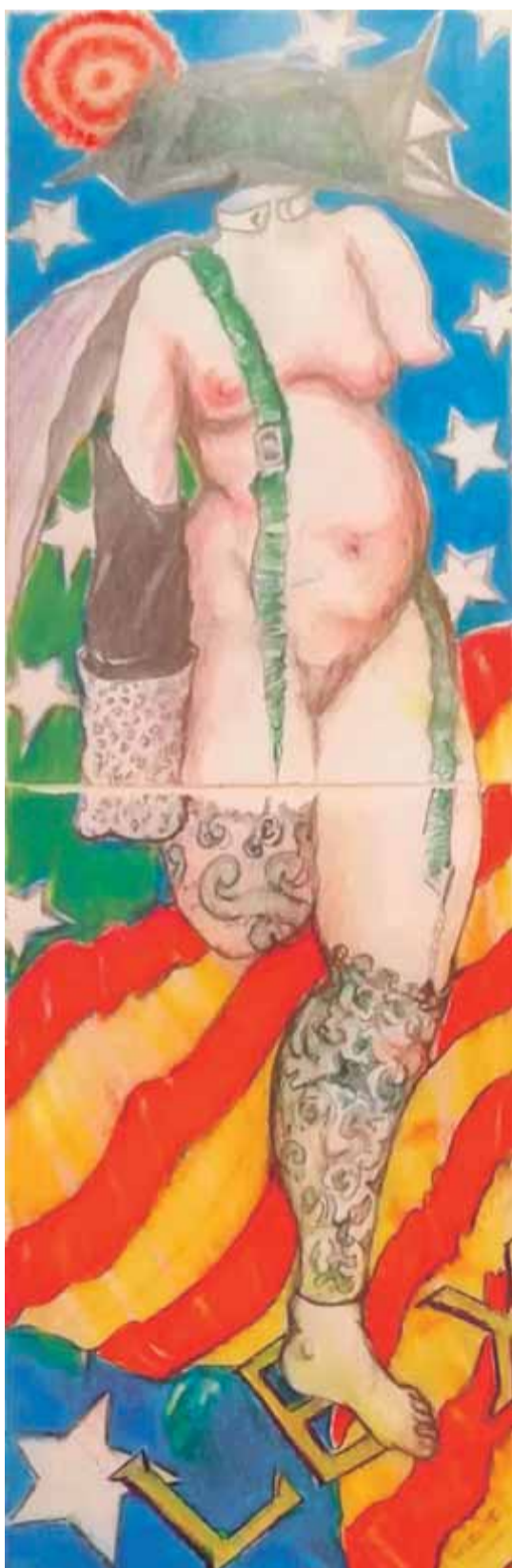
La injustícia, segons Civantos ■ EL PUNT AVUI

L'expressió culminava un dibuix tan subtil i tan prim com la mateixa frase, una ploma groga graciosament dreçada que hi apareix ancorada en el punt d'intersecció d'un llaç groc ajagut damunt una superfície plana i infinita. Tot molt subtil, tot molt elegant, en un conjunt trencat només pel toc de vermell que apareix dins d'un cercle, com un guixot maldestre, a l'interior del qual es llegeix la crida "Llibertat presos polítics".