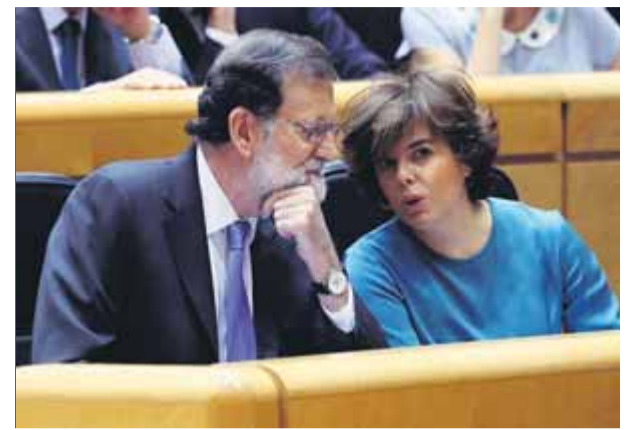
Mariano Rajoy i Soraya Sáenz de Santamaría conversen al Senat en una imatge d'arxiu

greu, l'exili i la presó és greu; i l'alternativa democràtica ha de venir de la suma generosa de la voluntat de canvi i transformació”, va resumir Vehí. “Quan la CUP hi juga hi ha transformació i canvi”, hi afegeix. Pels anticapitalistes, cal una dosi de realitat després d'haver après que “la idea de la llei a la llei no funciona” després de l'1-O, i que “hi ha empreses de l'Ibex 35 i que l'Estat no té cap problema en empresonar ni segrestar les institucions catalanes”, va afegir-hi Vehí. ■