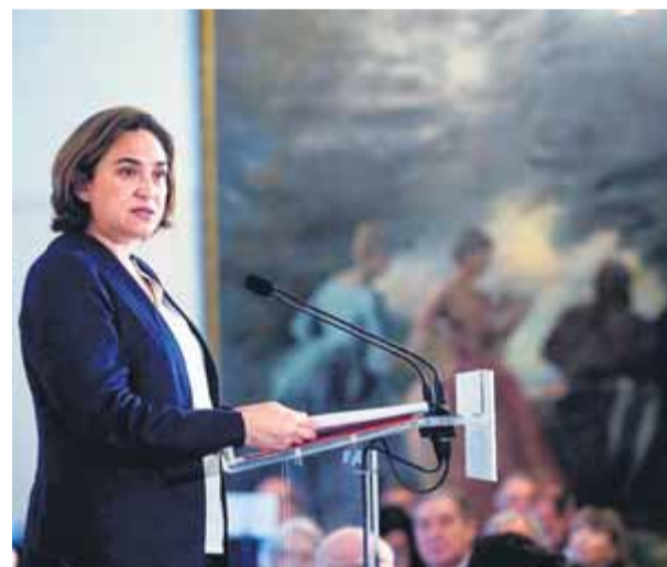
Colau, en l'esmorzar informatiu d'ahir

■ L'alcaldessa recorda que no han augmentat des de l'any 2009 ■ Forn la titlla de "deshonesta i impresentable"