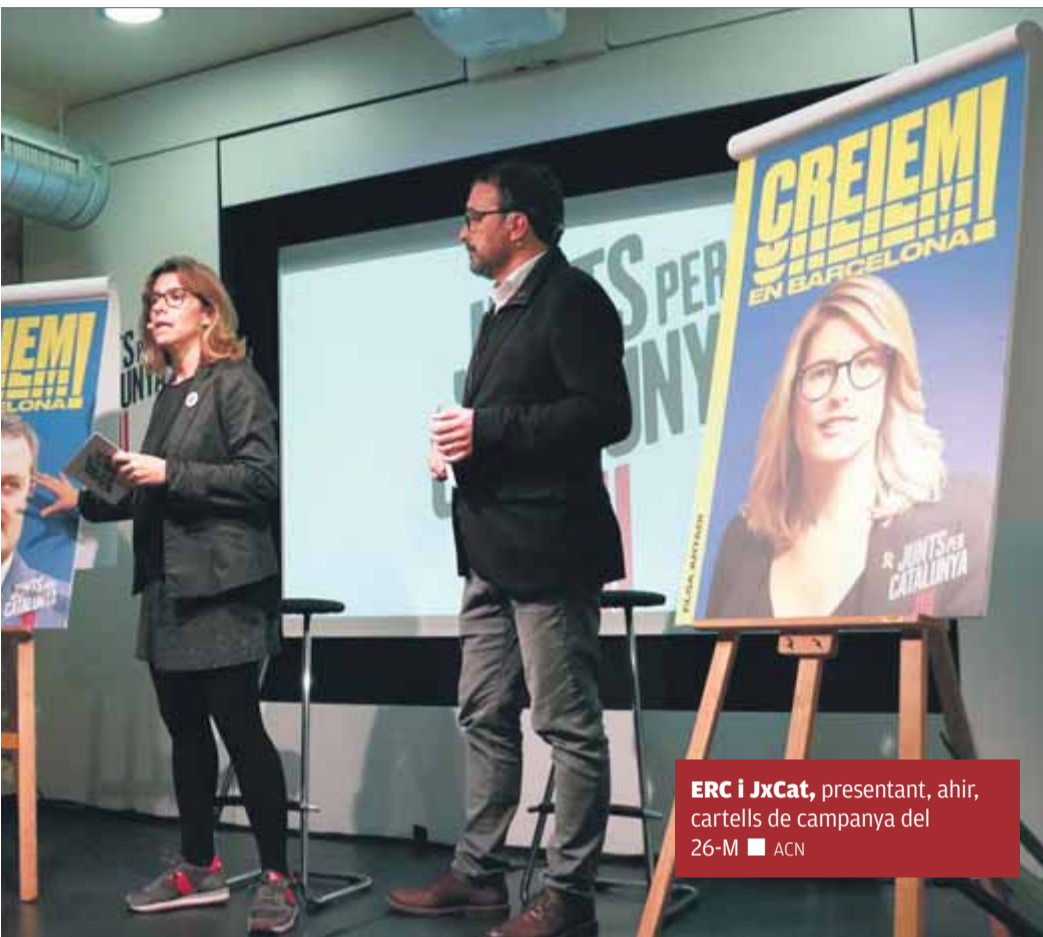
ERC i JxCat, presentant, ahir, cartells de campanya del 26-M ■ ACN