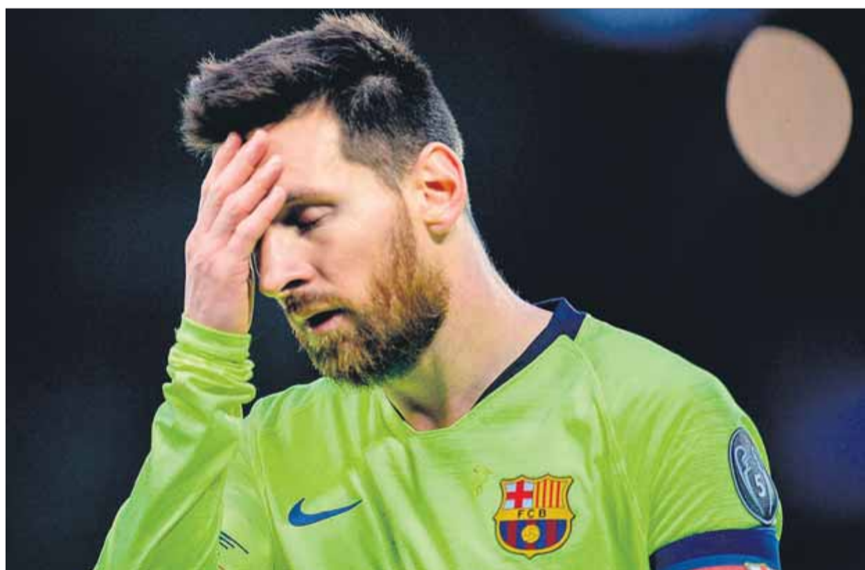
Leo Messi, preocupat i abatut, no va poder fer res per salvar els blaugrana del desastre

ANTECEDENT • Els blaugrana repeteixen el desastre de la temporada passada a Roma