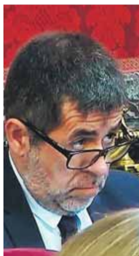
Jordi Sánchez, en la sessió d'ahir