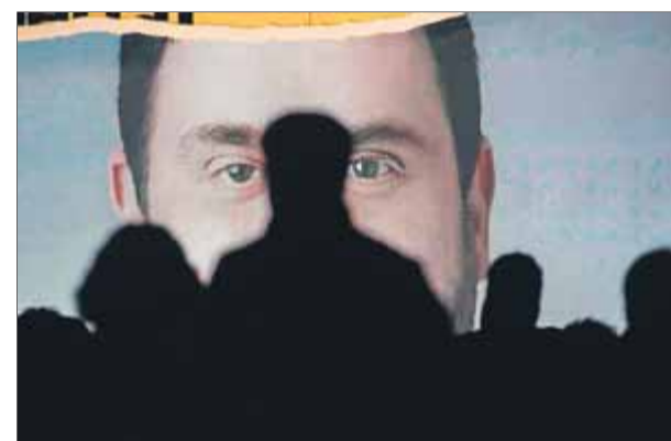
Un rètol electoral d'ERC amb Junqueras

El calendari electoral evita que els partits mostrin les estratègies fins al 26 de maig. Els partits estan més quiets complint els protocols electorals i deixant que cada poble faci la campanya segons les seves conveniències. Hi ha assessors que avisen que els resultats no es poden extrapolar i que res tenen a veure les eleccions generals del 28-A amb les municipals i les europees del 26 de maig. A Catalunya, ERC va anar al davant, un fet que no vol dir que torni a passar el 26-M. Els socialistes estan recuperant l'àrea metropolitana, el graner històric socialista. I, per altra banda, en pocs dies han tingut lloc fets com ara la polèmica judicial al voltant de la candidatura de Carles Puig-