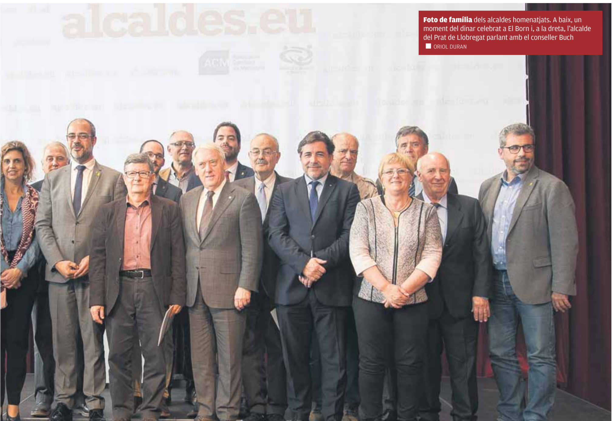
Foto de família dels alcaldes homenatjats. A baix, un moment del dinar celebrat a El Born i, a la dreta, l'alcalde del Prat de Llobregat parlant amb el conseller Buch