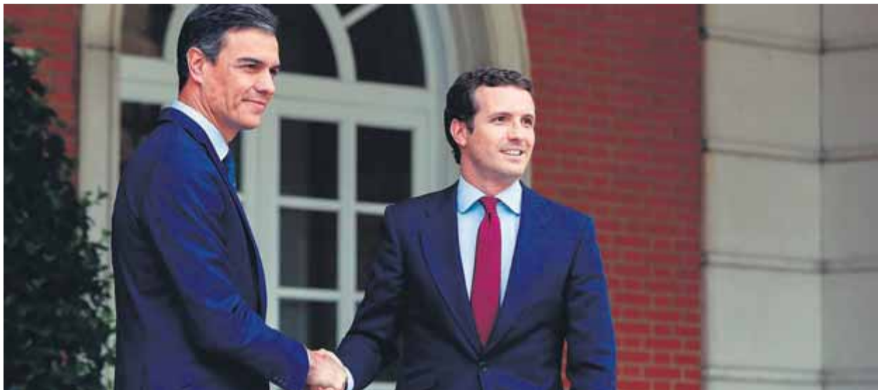
Pedro Sánchez i Pablo Casado, ahir a La Moncloa en la primera reunió després de les eleccions

DRET • Puigdemont emprendre accions legals contra la Junta per abús de llei