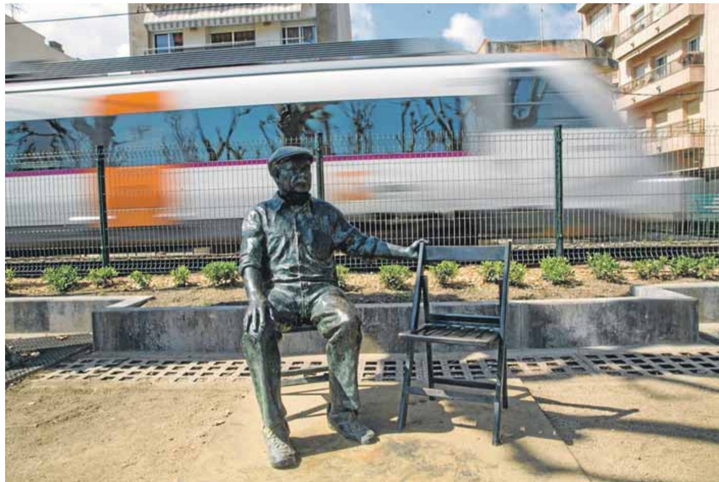
Inversions com la de les estàtues (aquesta dedicada al senat calellenc) exemplifiquen la “política de façana” que molts critiquen

ERC va superar el PSC com a segona força més votada en les darreres municipals i ara es veu en condicions d'arribar a l'alcaldia, especialment després de l'èxit dels republicans en les eleccions de fa uns dies. El seu lema de campanya, Som el canvi , certifica que es presenten com a alternativa. “Sortim a guanyar, però sa-