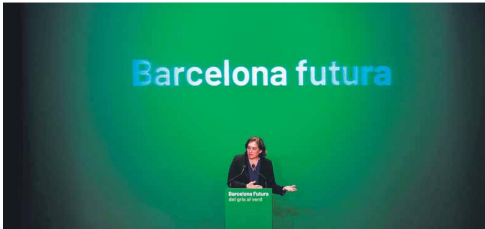
Ada Colau en un moment de la conferència pronunciada ahir a l'espai Francesca Bonnemaison, en què va apostar per una Barcelona verda

L'alcaldessa va dibuixar un eixample de color verd amb tres eixos verticals i tres d'horitzontals amb places per a persones on ara hi ha interseccions d'asfalt per a cotxes. ■