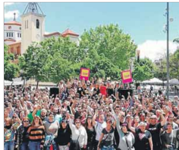
Candidats i simpatitzants de la CUP, en la presentació per a les municipals, ahir a la plaça Creu Alta de Sabadell