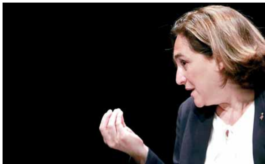
L'alcaldesa Ada Colau en un acte de precampanya

Té 52 anys, és assessora fiscal i consultora d'empreses. Des de fa un any, és la primera tinenta d'alcalde i regidora d'Hisenda, Empresa i Innovació gràcies a un pacte amb CiU. Ha estat vinculada al món associatiu i va ser presidenta del Patronat de la Fundació Esport Base de Vilanova i la Geltrú.