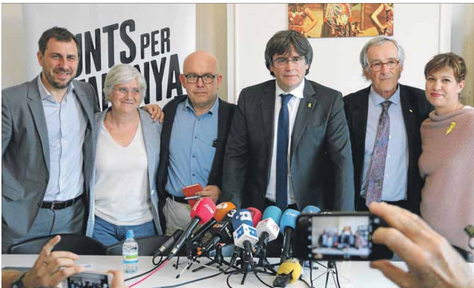
L'expresident Puigdemont, amb els exconsellers Comín i Ponsatí, i amb els seus substituïts el 26-M, l'advocat Boye, l'exalcalde Trias i Talegón, ahir