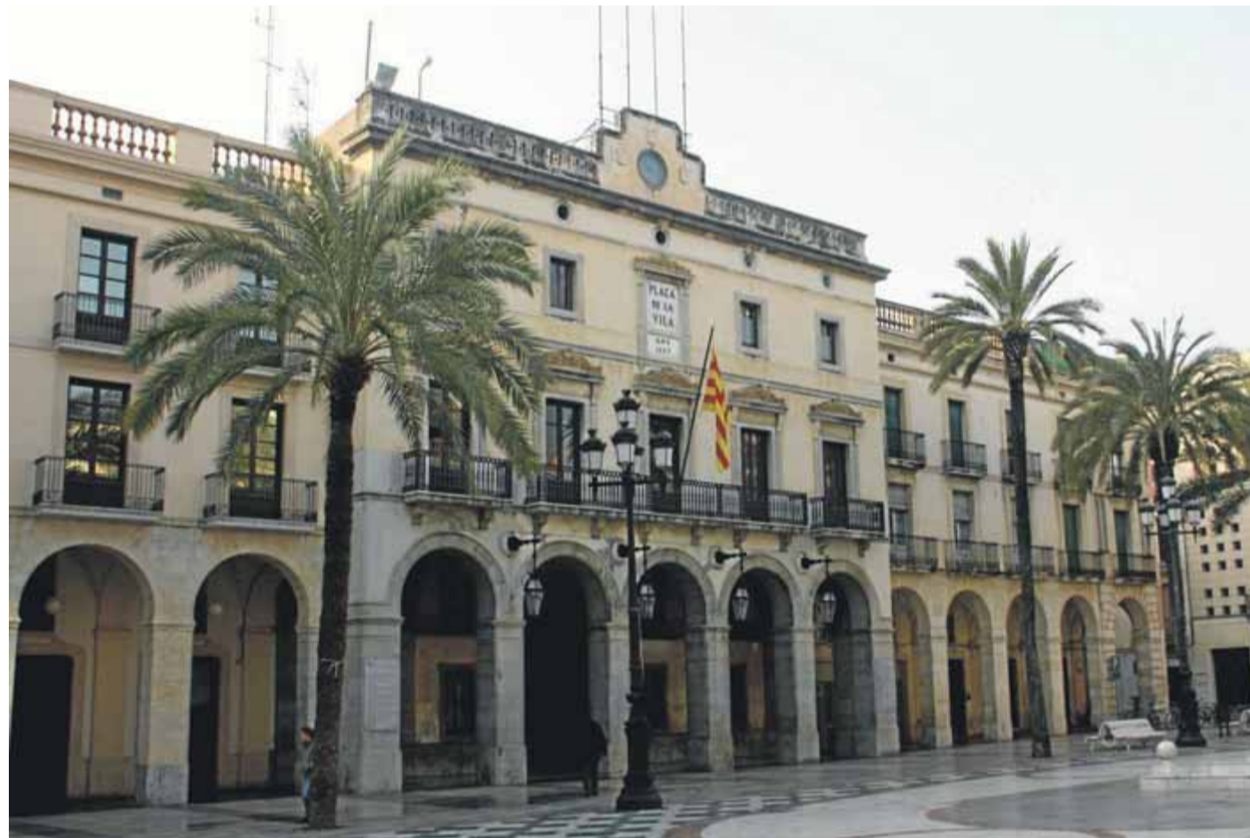
Tretze candidats i candidates es disputen l'alcaldia de Vilanova i la Geltrú en aquestes eleccions municipals ■ A.G.

La tercera formació que s'ha dividit en dos és l'extinta Convergència i Unió, que ara es presenta sota la sigla de JxCat. El sector més conservador i antirrupturista