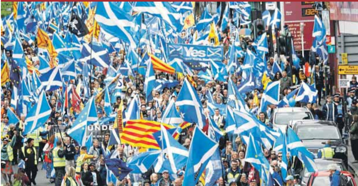
La marxa que es va fer ahir al migdia pel centre de Glasgow, en la qual també hi havia estelades