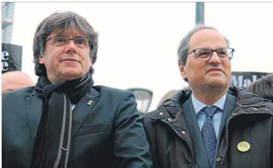
Carles Puigdemont i Quim Torra, ahir en un acte a Brussel·les