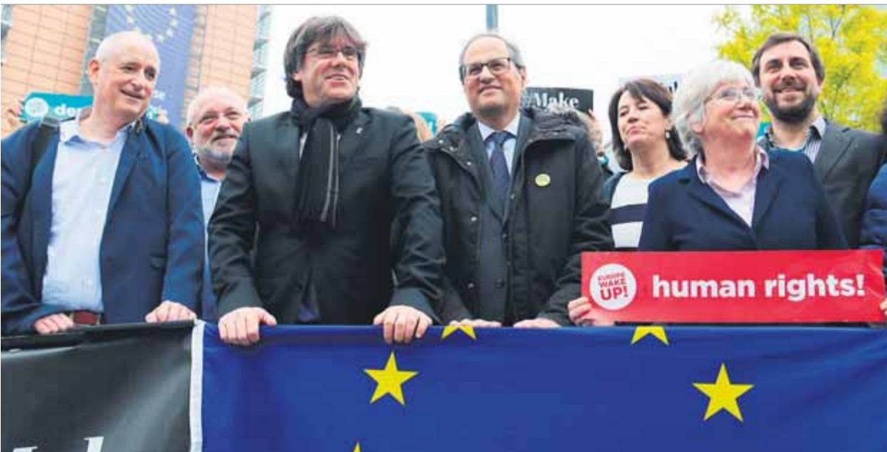
L'expresident Puigdemont i el president Torra, en la manifestació davant de la Comissió Europea

IMPUGNACIÓ • JxCat impugna el vet de la JEC a Puigdemont, Comín i Ponsatí al·legant vulneració de drets CRIDA • Demana participació en les iniciatives que s'han engegat i en la protesta d'avui