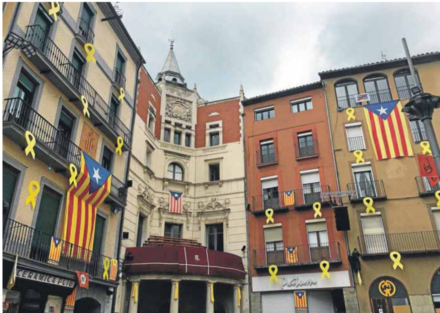
L'estelada de la discòrdia al balcó de l'ajuntament de Berga, que va suposar la inhabilitació de l'alcaldessa

titut Serra de Noet, que ha estat més d'una dècada funcionant en barracons prefabricats.