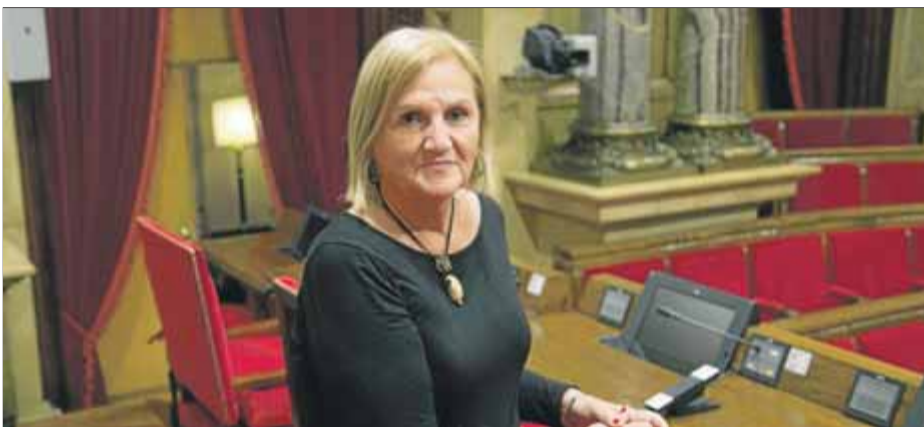
L'expresidenta del Parlament, a l'hemicicle en una imatge del maig passat