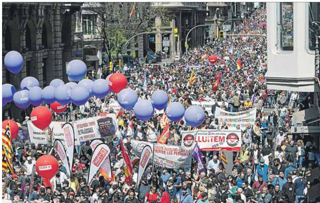
La Via Laietana de Barcelona, plena en la manifestació dels sindicats majoritaris

FUTUR • Els majoritaris veuen en els resultats del 28-A un aval "a les polítiques d'esquerres"