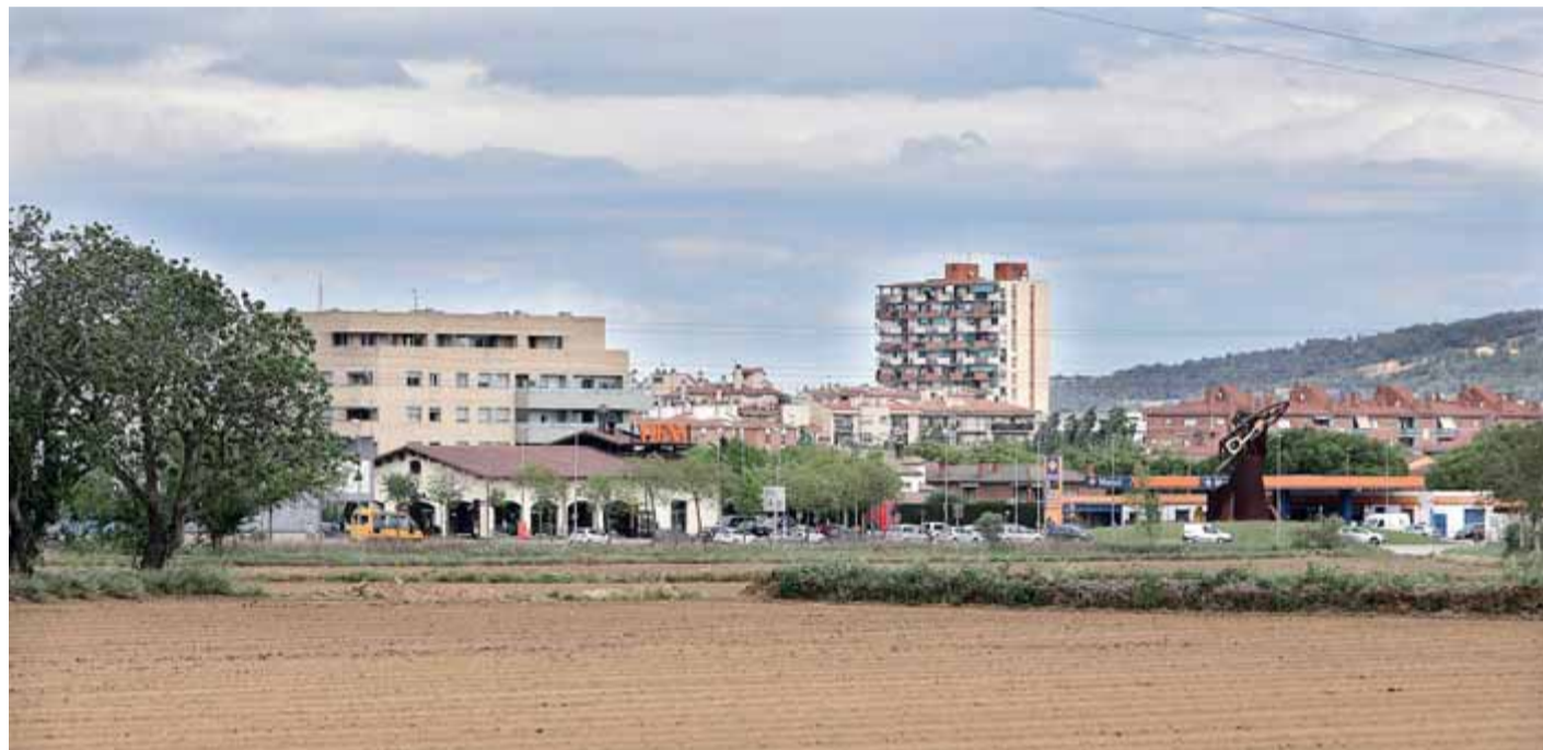
El sector sud de Salt, que va de la sortida 7 de l'AP-7 fins a tocar del nucli urbà, i també transcorre en paral·lel a la C-65, fins a Girona ■ MANEL LLADÓ

Aquest mandat, al capdavant de l'Ajuntament hi ha una coalició entre ERC i IpS-CUP, que governen en minoria (dels 21 regidors, els republicans en van obtenir cinc en les eleccions del 2015, i IpS-CUP en va aconseguir tres). El ple està bastant fragmentat, ja que també hi ha els grups Canviem Salt, Cs, PxC, el PSC i CiU, així com tres edils del PDe-