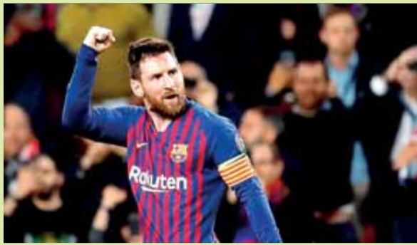
Messi, després de marcar el tercer, un golàs de falta directa

Els blaugrana van saber patir i viatgen a Liverpool amb tres gols d'avanatge