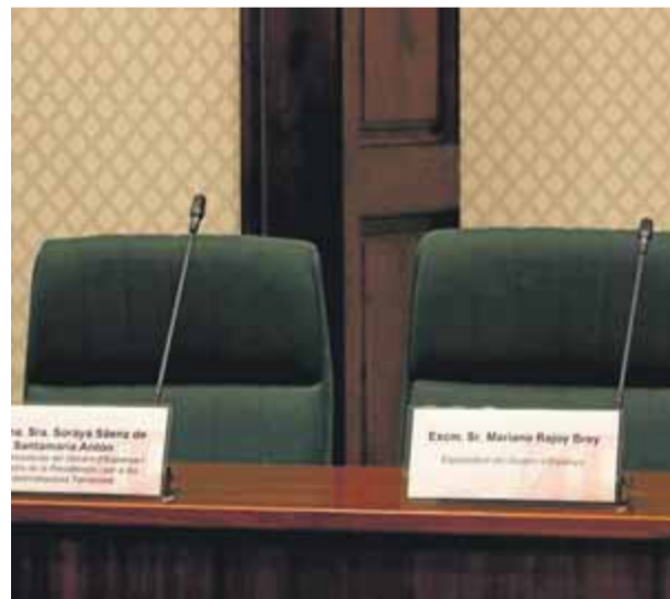
Rajoy i Santamaría van deixar ahir les cadires buides

amb la seva aplicació a Catalunya quan eren a l'executiu. Rajoy i Santamaría van enviar breus burofaxos dilluns en què s'emparen en un dictamen del Consell d'Estat del 25 d'abril que conclou que "els membres del govern de l'Estat, actuals i pretèrits, no estan obligats a atendre la sol·licitud de compareixença" davant la citada comissió. En una carta, més extensa però en termes similars, enviada la setmana passada, Cospedal també justificava que les cambres autonòmiques només poden investigar "activitats