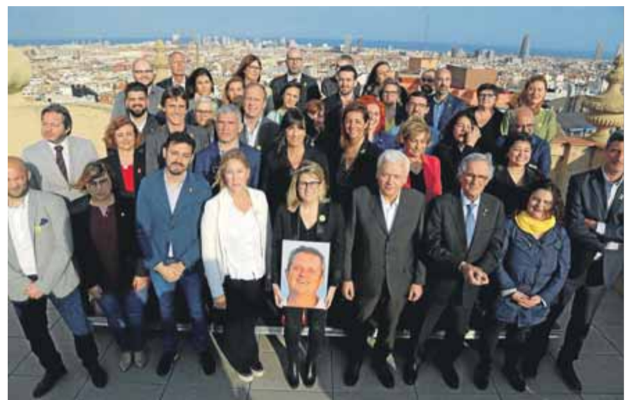
JxCat va presentar ahir la seva llista per Barcelona ■ JUANMA RAMOS

Som un partit que advoca per la neutralitat institucional. Li puc anticipar tres mesures del programa electoral en aquesta línia: recuperarem el nom de la plaça Constitució, perquè creiem que ja ens representava, tenint en compte que la Constitució del 78 continua plenament vigent; recuperarem les relacions institucionals amb l'administració nacional [estatal], i encarregarem una auditoria a la gestió que ha fet el govern en els últims quatre anys, perquè ha estat molt lleial a un grup de ciutadans pel tema del procés i s'ha abandonat per complet la Girona de tots. ■