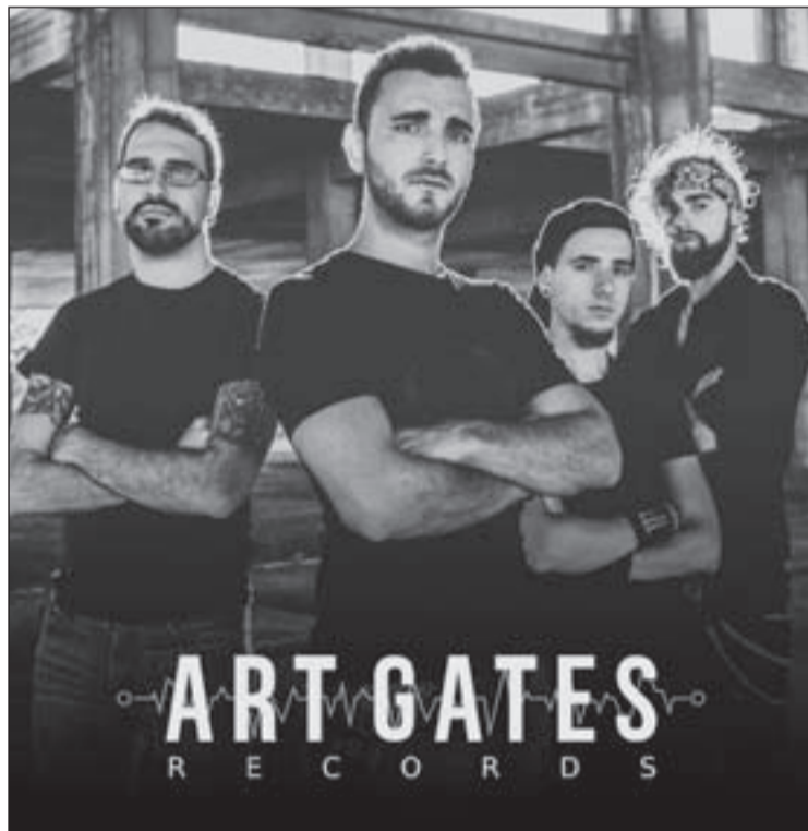
Steinbock siguen aplicados en su proyecto

La banda está muy ilusionada y está estudiando cuál será el segundo videoclip promocional de este larga duración que tome el relevo a 'Trash'. El fichaje por esta discográfica de Valencia también incluirá la campaña de promo-