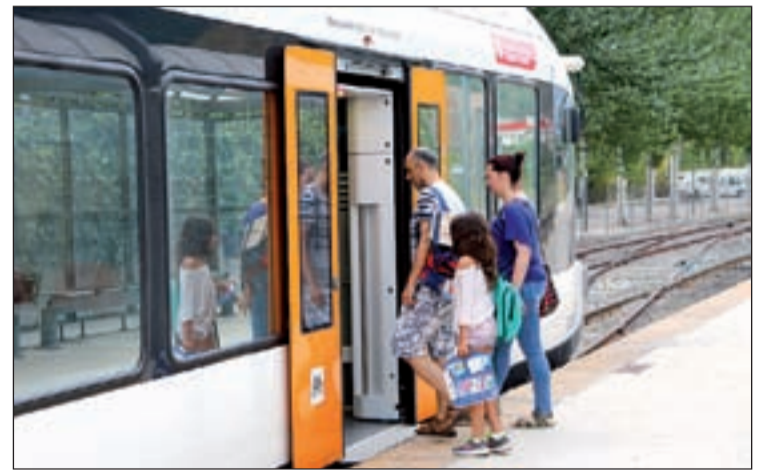
Una família pujant al tren a l'estació de la Pobla de Segur

Les principals causes d'aquest exòde, segons CCOO, són les con-