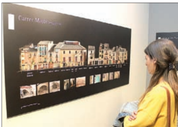
Una visitant observant una de les imatges exposades

Tàrrrega reconstrueix en una exposició el seu passat urbanístic medieval. La mostra visualitza un innovador treball de recerca topogràfica que defineix, carrer per carrer i casa per casa, com era l'antiga vila d'entre els segles XV i XVII, a les darreries de l'Edat Mitjana i a principis de l'Edat Moderna.