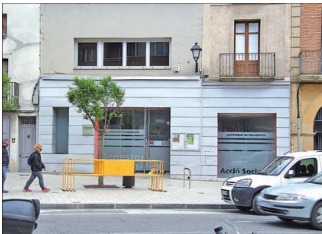
Façana de la seu de l'àrea de Benestar Social i Ciutadania de l'Ajuntament de Mollerussa

Per altra banda, O. G. impartia conferències com expert en bones pràctiques, tècnic en Participació i Mediació adolescent,