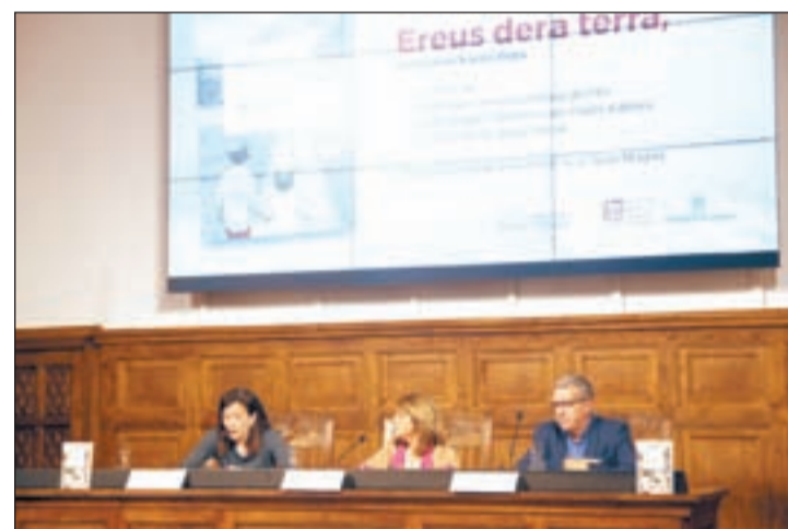
Boya, ahir durant la presentació a Lleida

Enguany es compleixen cent anys de l'arrencament de les pintures romàniques de la Col·legiata de Santa Maria de Mur (Pallars Jussà). Aquest diumenge, coincidint amb l'aplec de Mur, es donarà el tret de sortida al programa en commemoració del centenari de l'arrencada de les pintures.