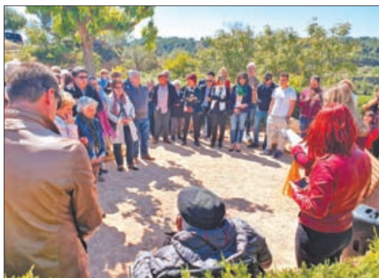
Un moment de l'acte celebrat

Almenar ha retut un doble homenatge als almenarencs deportats durant la II Guerra Mundial a Mauthausen i a altres camps nazis amb la col·locació de sengles plaques commemoratives al poble, duna banda, i al mateix camp de concentració, de l'altra. Els dos actes formen part de les activitats del 74è aniversari de la finalització de la II Guerra Mundial.