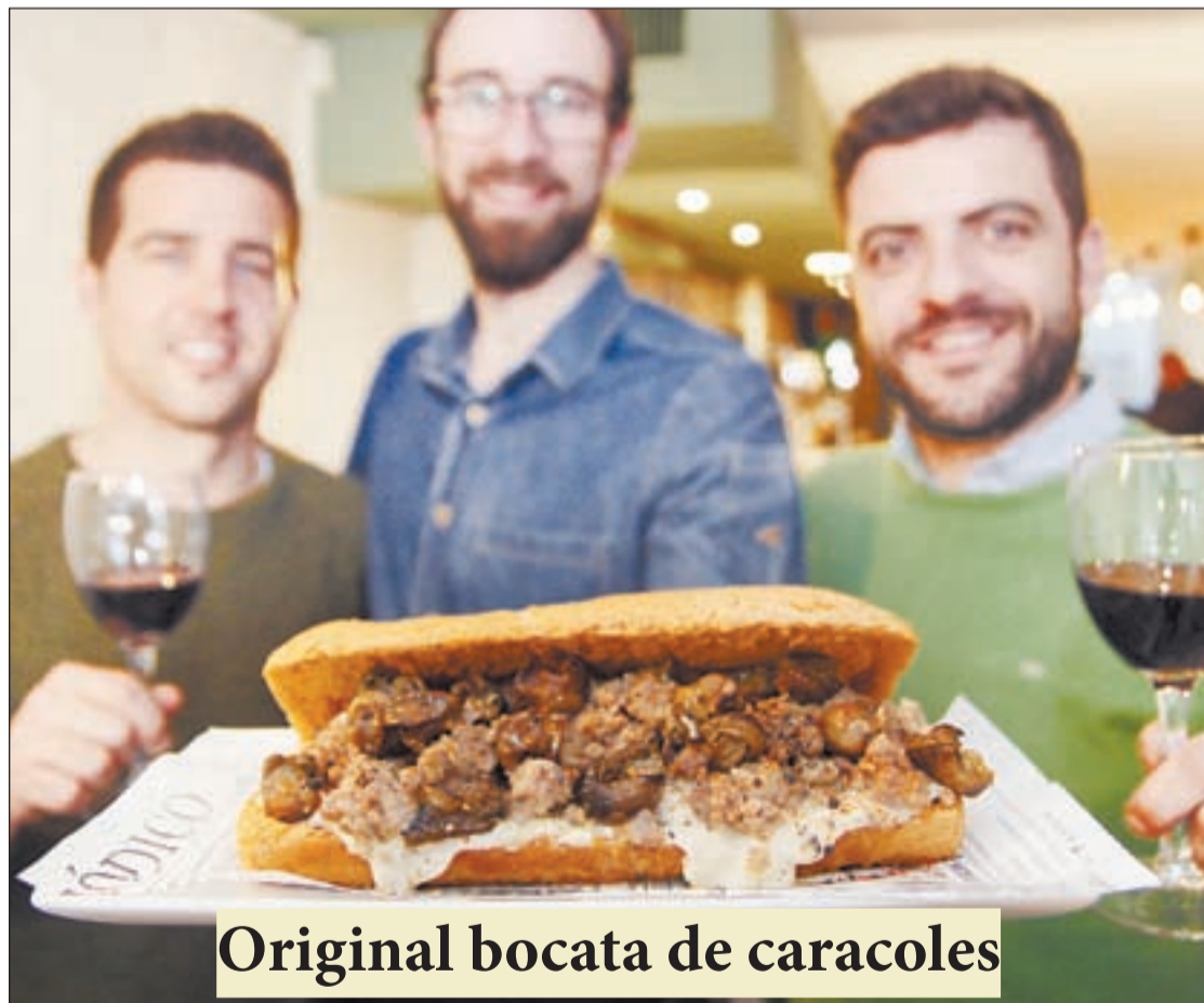
Original bocata de caracoles

Un total de 197 mujeres, poco más del 25% de las 745 candidaturas presentadas optarán en las municipales del próximo 26 de mayo a ser alcaldes. Cabe destacar la capital del Pallars Jussà, Tremp, donde las tres candidaturas que se presentan están encabezadas por una mujer. | PÁG. 16