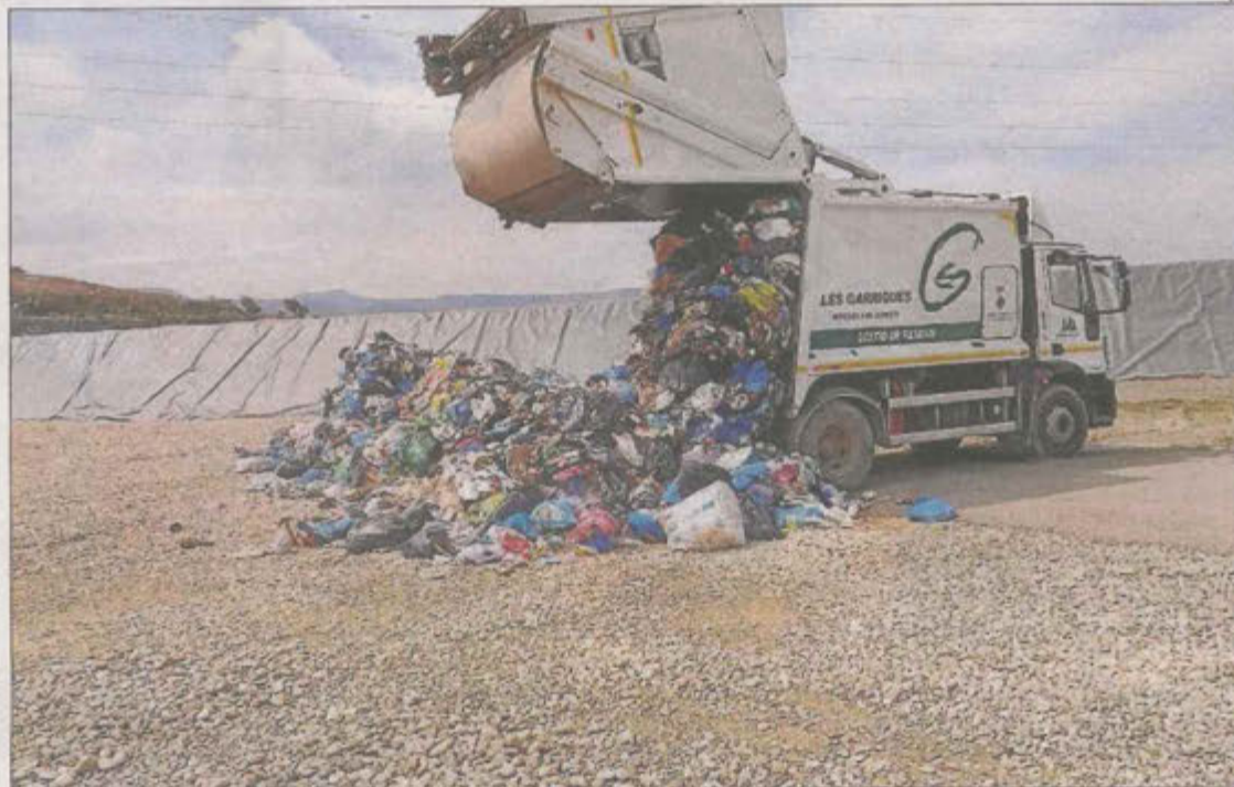
El nou vas, que té una capacitat per a 68.000 metres cúbics, ja està en funcionament.

Per la seua part, la Generalitat continua immersa en el seu estudi per unificar la gestió en un sol abocador de les escombraries que es generen a les Garrigues, el Pla, la Noguera i l'Urgell, ja que la idea és reduir al màxim el nombre d'aquests