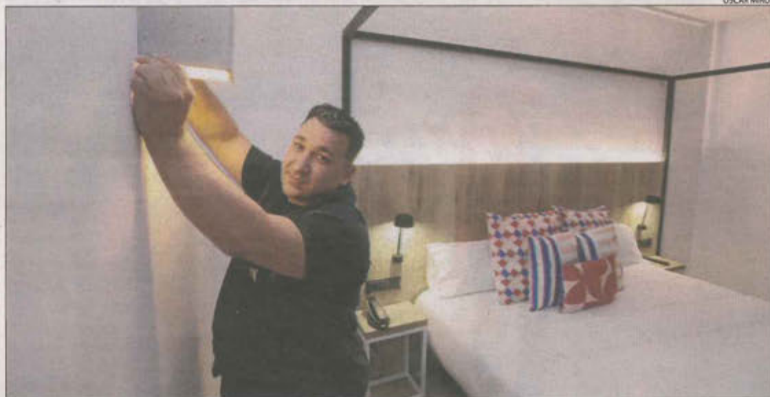
L'Adil va trobar feina a l'hotel Acta Rambla gràcies al programa d'inserció d'Aspid.