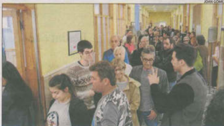
Cues per votar diumenge en un col·legi electoral de Mollerussa.

Cap dels principals partits va fer ahir valoracions, més enllà de compareixences davant dels mitjans diumenge a la nit, després del recompte de vots. Els responsables de les campanyes dividien la seua atenció entre analitzar els resultats de les generals i ultimar llistes de les municipals que se celebraran en menys d'un mes, el 26 de maig. Després d'expirar la setmana passada el termini per presentar candidatures, avui es publicaran les proclamades com a definitives.