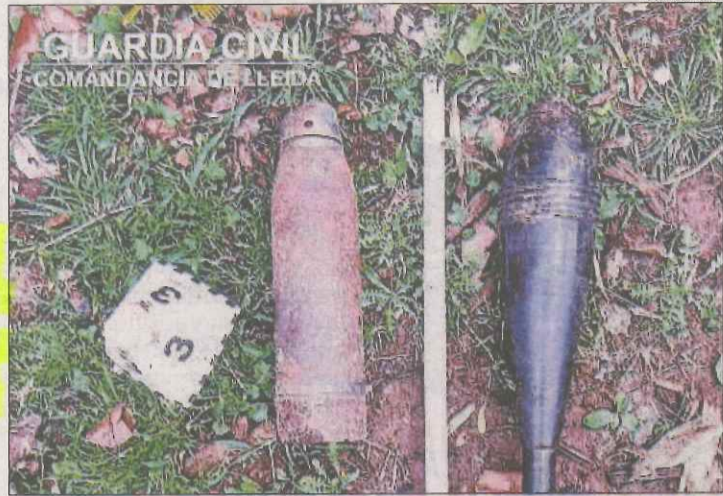
El projectil i la granada de mà que es van trobar a Conca de Dalt.

LLEIDA | La Guàrdia Civil ha desactivat un total de tretze artefactes explosius de la Guerra Civil en el que va d'any a la província de Lleida. Desactivacions que s'han dut a terme en un total de vuit actuacions de la Guàrdia Civil. L'última actuació es va portar a terme dimarts quan un veí de Conca de Dalt, al Pallars Jussà, va alertar la Guàrdia Civil després de trobar un projectil d'artilleria i una granada de mà a les ruïnes d'una torre abandonada. Fins al lloc es van traslladar efectius del Grup Especialista en Desactivació d'Explosius de Lleida i de la Pobla de Segur, que van trobar un projectil d'artilleria de 75 mm per a canó d'artilleria de muntanya i una granada de morter reformat de 81 mm, aparentment utilitzats durant la Guerra Civil. Una vegada comprovat l'estat dels dos artefactes i de prendre les mesures de seguretat oportunes, es van traslladar a un lloc segur per analitzar-los i destruir-los immediatament. En aquesta troballa, la Guàrdia Civil va recalcar que el veí que els va alertar va seguir correctament els consells de seguretat en cas que qualsevol ciutadà localitzés un artefacte.