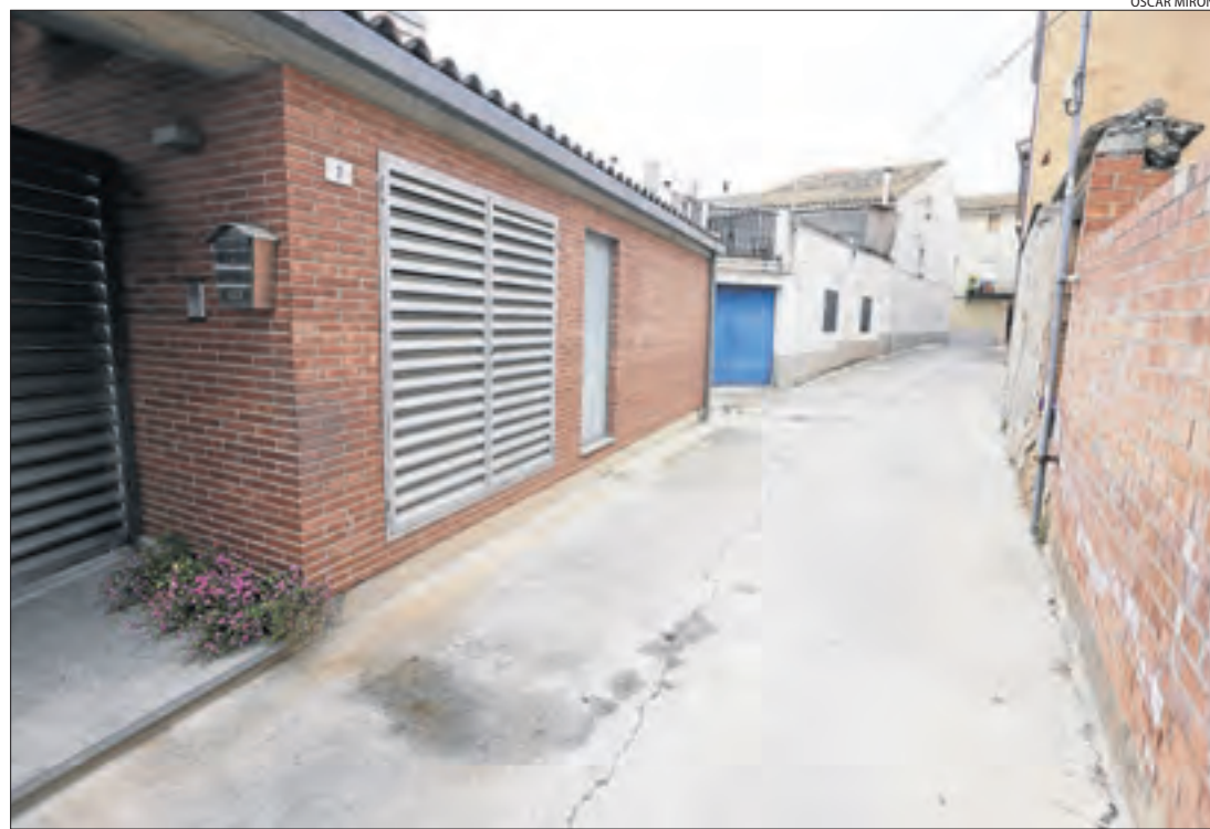
Vista del lloc on es va produir ahir l'incendi en un habitatge de Corbins.

La dona, evacuada a l'Arnau amb pronòstic lleu || Cuinaven en el moment que van prendre un palet i una marquesina exterior