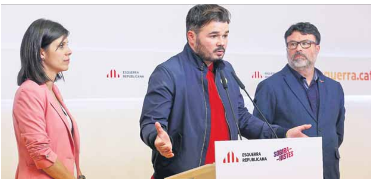
Gabriel Rufián va comparèixer ahir acompanyat de Marta Vilalta i Joan Josep Nuet