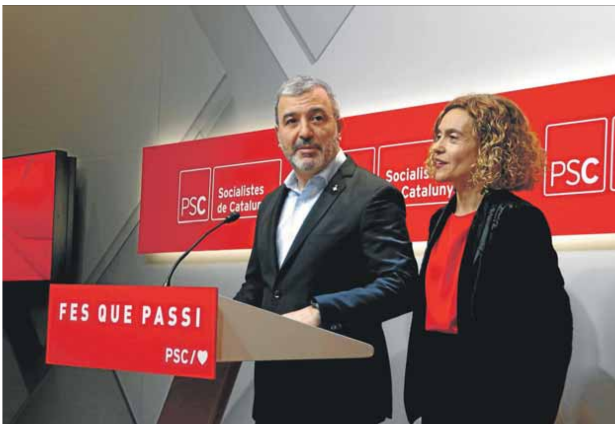
Collboni i Batet compareixien ahir per fer balanç dels resultats després de la reunió de l'executiva