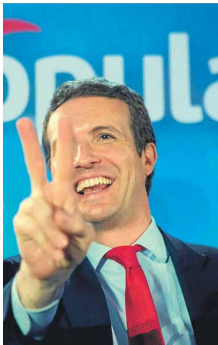
Sánchez i Casado s'han presentat triomfalment com els presidenciables al bloc de l'esquerra i al bloc de la dreta, respectivament

xa espanyolista contra el diàleg amb la Generalitat.