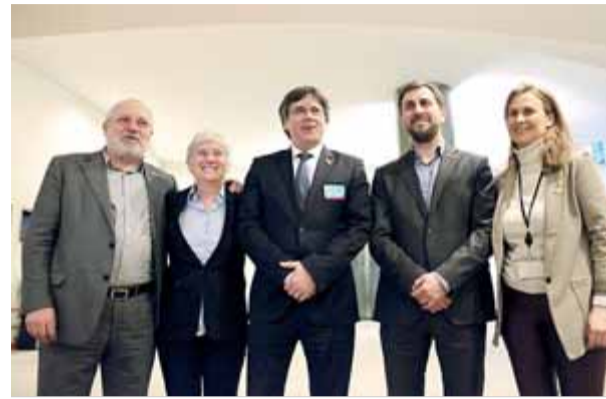
L'expresident i els quatre exconsellers a l'exili, durant la seva visita a l'eurocambra, el març passat

candidatura al Senat de l'exconseller de Cultura Lluís Puig, que també és a Bèlgica des de la mateixa data que ells. Segons Puigdemont, Comín i Ponsatí, la petició de PP i Cs vol "privar-los de manera antijurídica dels seus drets civils i polítics i del seu dret fonamental de sufragi passiu", ja que el seu processament per rebel·lió al Tribunal Suprem no comporta una inhabilitació per concórrer a les eleccions. A més, critiquen que el PP pretengui que la JEC creï