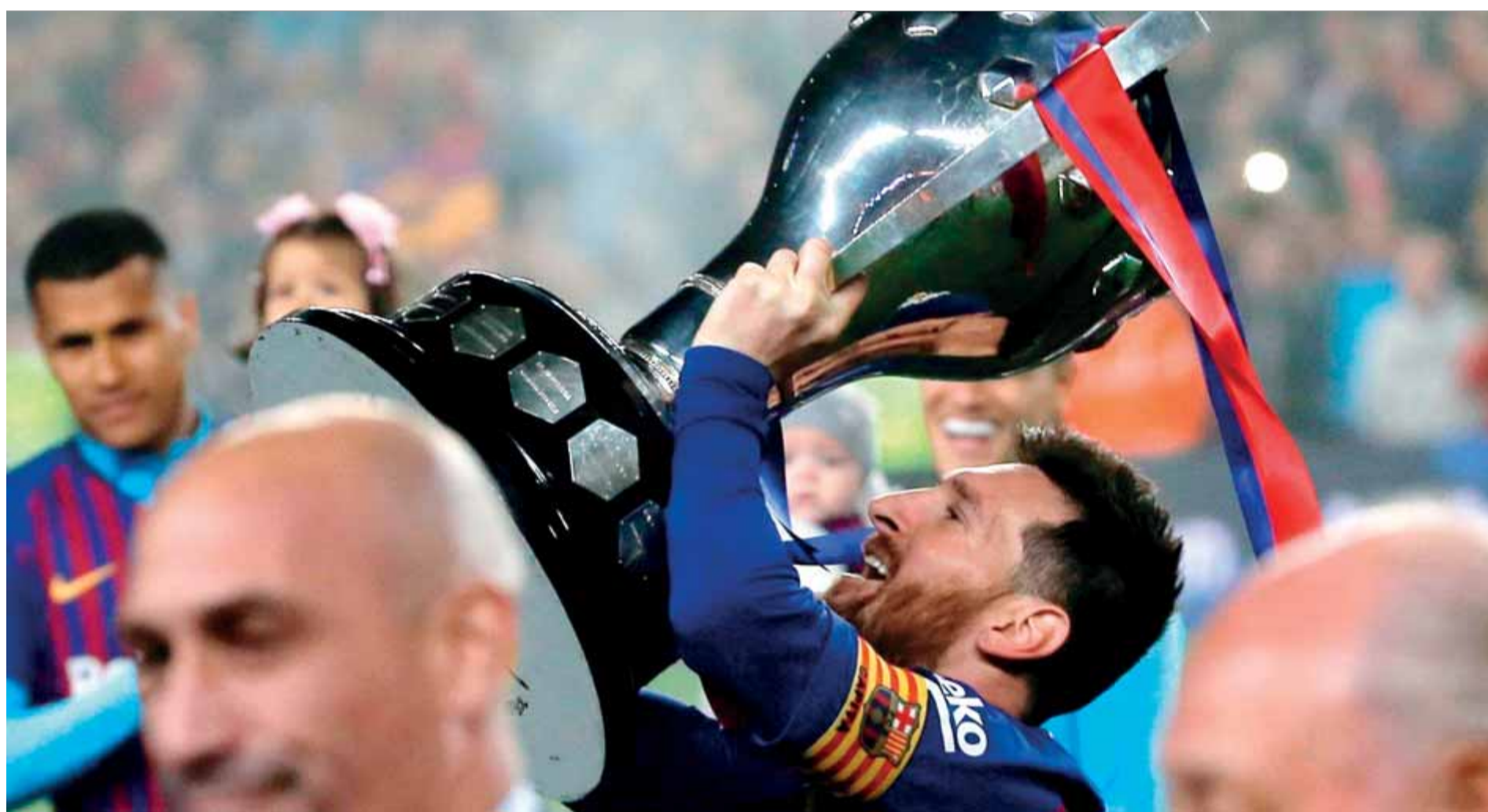
Leo Messi, ahir, amb el trofeu de la lliga, que per primer cop es va lliurar el mateix dia que es guanyava. L'argentí ja suma 10 lligues

FUTUR • Amb la feina feta, dimecres arriba un potentíssim Liverpool a la Champions i es pot somiar amb un altre triplet si es guanya la copa