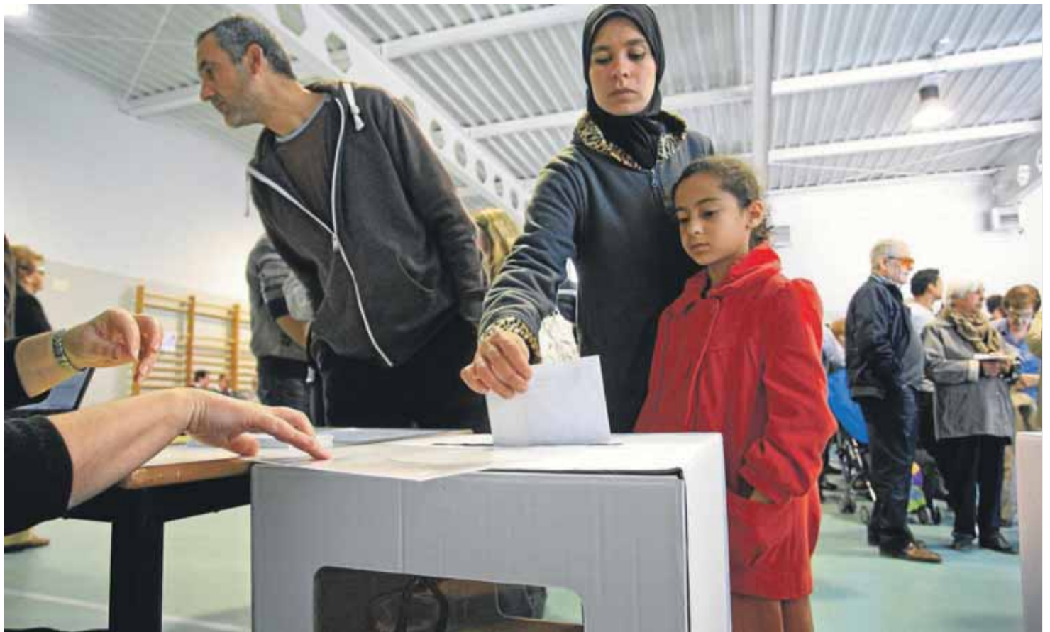
Votació durant la consulta del 9-N sobre el futur polític de Catalunya a l'INS Vallvera de Salt (Gironès)

A Safia El Aaddam, en el moment de néixer, se li va atorgar un