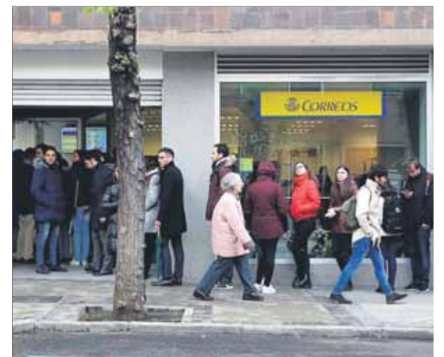
Cues ahir per votar per correu en les eleccions de diumenge en una oficina de Correus de Madrid

116.218 les persones que han demanat el vot per correu, i en el conjunt de l'Estat s'han superat els 1,3 milions. Pel que fa al vot exterior, s'han rebut 29.301 peticions entre les quatre circumscripcions. Seran comptabilitzats tots els que arribin als seus col·legis diumenge abans de les vuit del vespre. ■