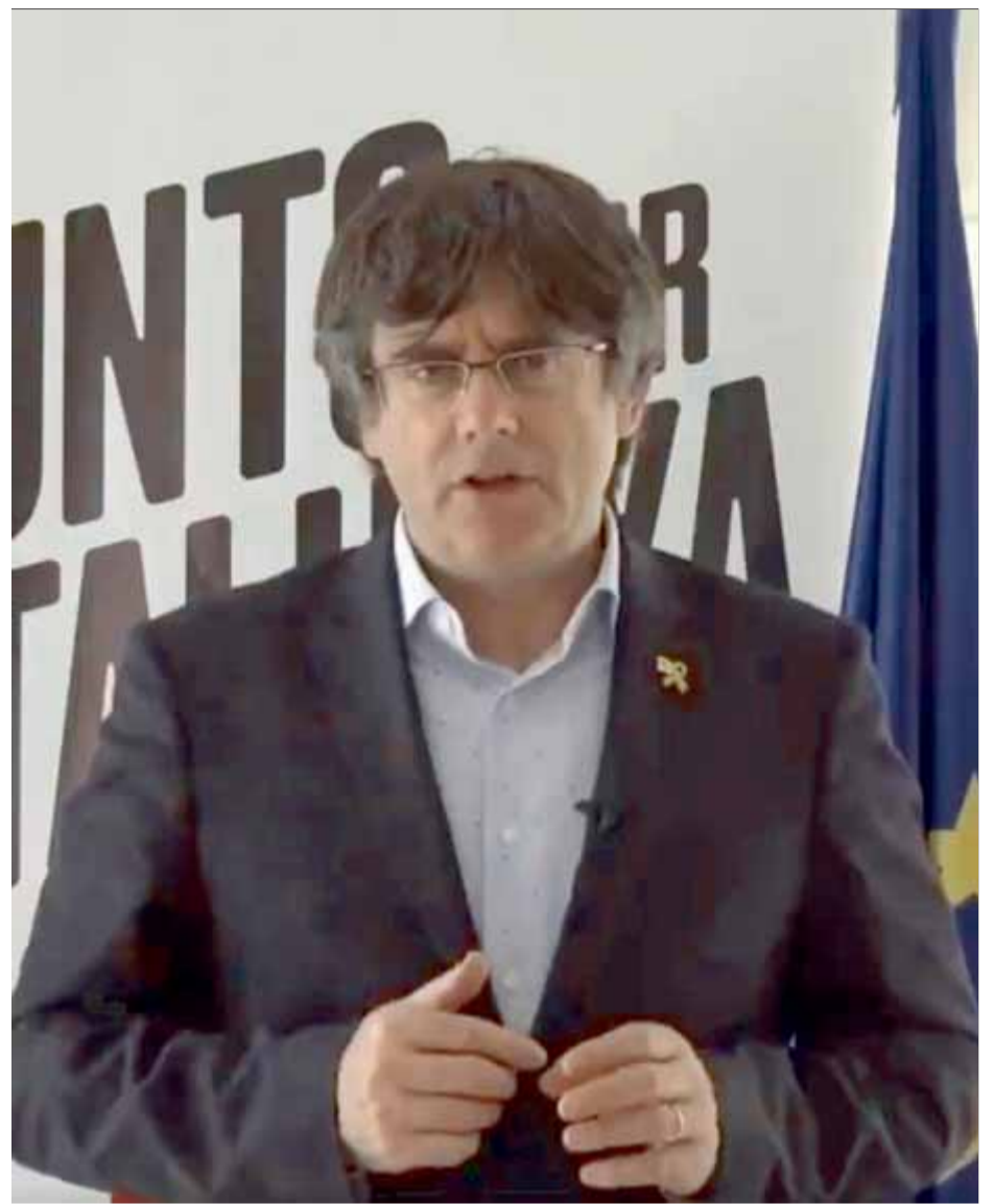
Puigdemont va intervenir ahir en l'acte final de JxCat a Lleida des de l'exili ■ EL PUNT AVUI

I Artur Mas va dirigir-se als independentistes indecisos que puguin tenir alguna "confusió", per dir-los que "JxCat és el que més s'assembla a Junts pel Sí, la coalició de CDC, ERC i independents que va fer possible la primera majoria absoluta independentista, amb la CUP. ■