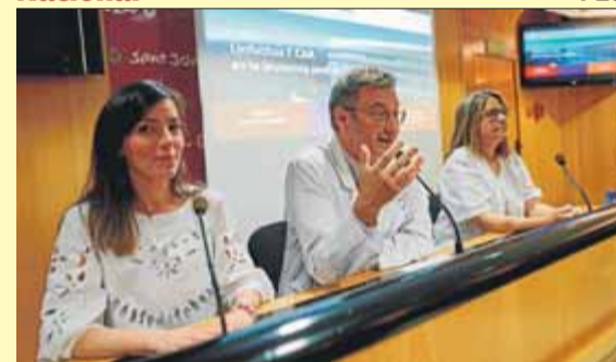
El director mèdic de Sant Joan de Déu, al centre