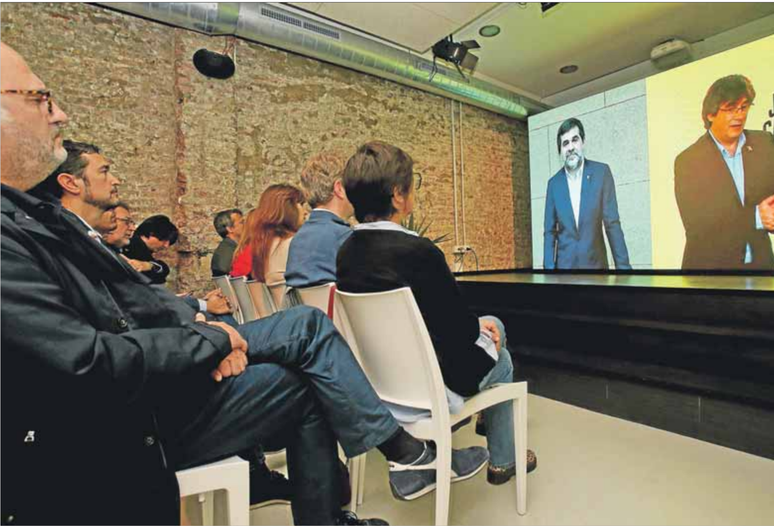
Sánchez i Puigdemont conversant per videoconferència des de Waterloo i Soto del Real, seguits per dirigents de JxCat a la seu de la formació