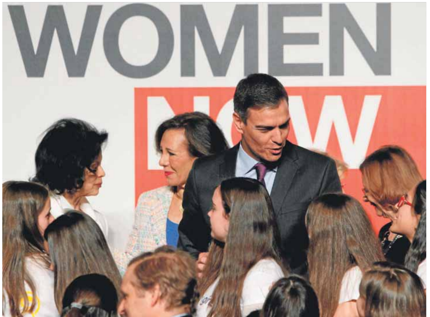
Els socialistes, amb Pedro Sánchez al capdavant, són l'únic partit que ha situat menys dones que el 2016 a les llistes electorals

El 88% de la població considera que la igualtat és una assignatura pendent, segons el baròmetre del CIS. Dels més de 36,8 milions d'electors cridats a les pròximes eleccions, les dones són un milió més que els homes. Les enquestes avalen que la igualtat de gènere s'ha situat, per fi, en la llista de qüestions que preocupen la societat. I en conseqüència, la batalla pel vot femení és més aferrissada que mai. Els partits de la dreta que fins ara no havien situat la igualtat com una prioritat s'han espavilat a incorporar propostes que pretenen afavorir-la. Quan era al govern, el PP no considerava necessari prendre cap mesura per posar fi a les diferències de salari entre gèneres, mentre que ara defensa un pacte d'Estat sobre aquesta qüestió. Els populars, però, no volen deixar cap zona per cobrir, i van participar amb Vox en la ma-