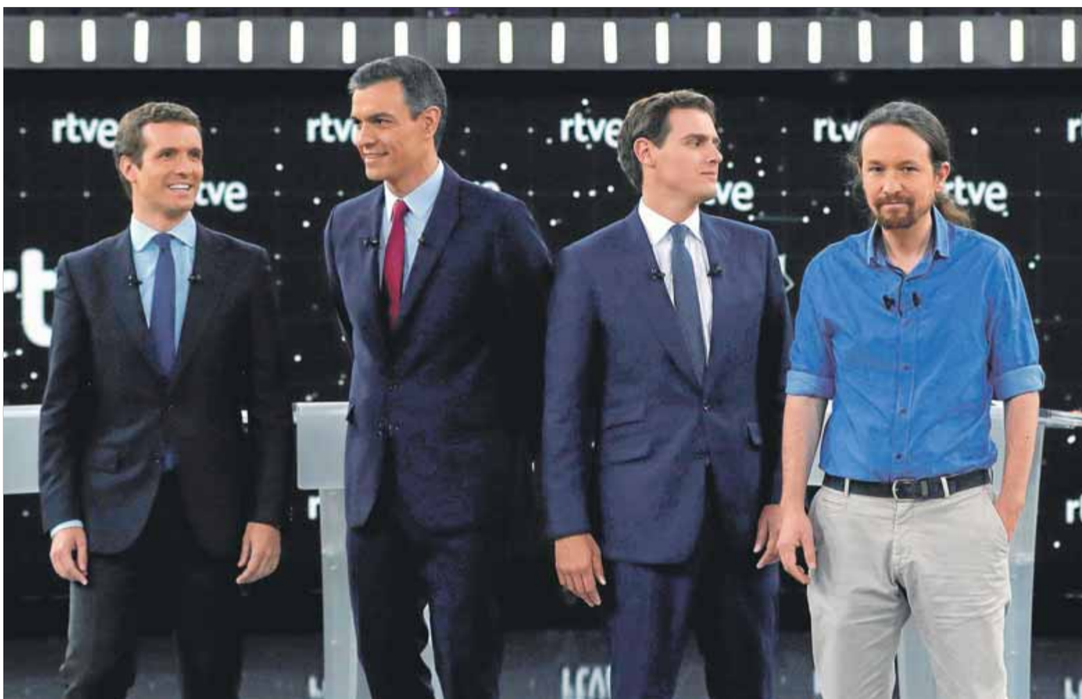
Casado, Sánchez, Rivera i Iglesias, ahir, al primer debat presidencial a TVE