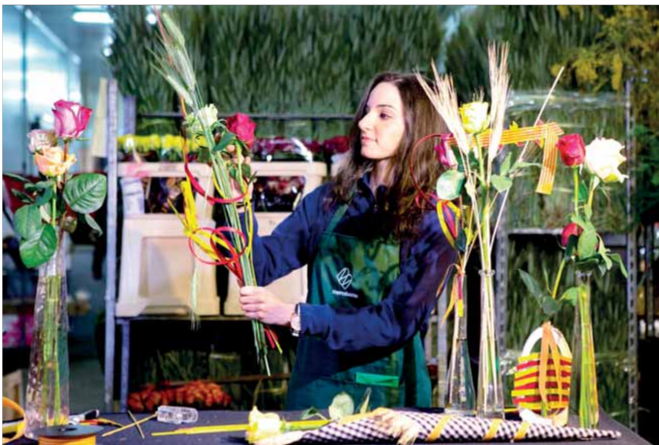
Una florista de Mercabarna prepara roses amb tots els detalls per a la diada de Sant Jordi d'avui

SANT JORDI • Els editors preveuen vendre un milió i mig d'exemplars d'entre els 50.000 títols de les parades