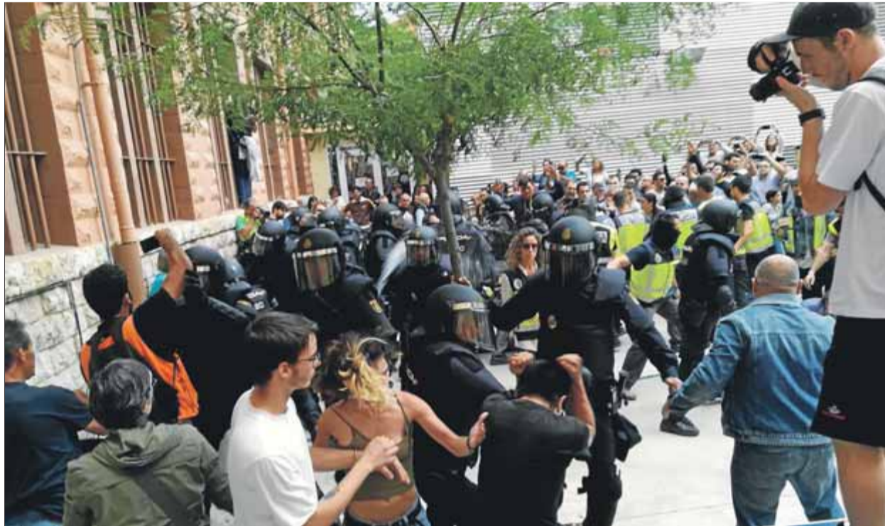
Agents de la policia espanyola donen cops de porra als concentrats a l'institut Tarragona l'1-O

Les defenses no es van arronsar pas i van seguir preguntant als 23 agents de la policia espanyola, amb tasques d'antiavalots i de policia judicial, si la reacció irada d'alguns veïns era pels seus cops de porra i la seva acció violenta. Tots ho van negar i van explicar