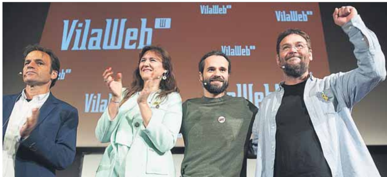
Asens, Borràs, Gómez del Moral i Fachin, ahir en el debat de Vilalweb al CCCB