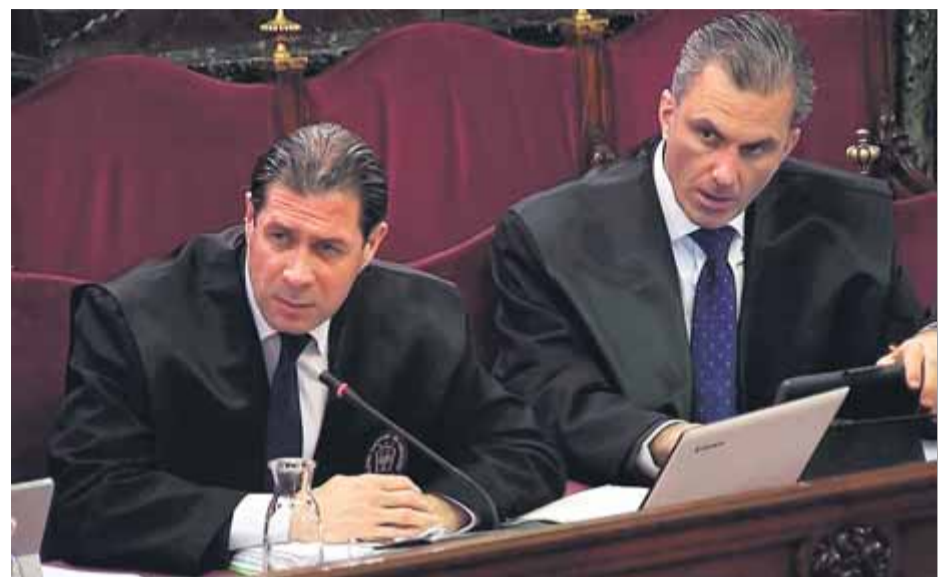
El secretari general de Vox, Javier Ortega Smith, a la dreta, en una sessió del judici

Seria el mateix que un bipartit entre el PSOE i Ciutadans. Amb l'avantatge que un tripartit de la dreta ens ajudaria molt en la batalla d'opinió que estem duent a terme a Europa. Al meu parer, el conflicte es desencallarà amb la intervenció d'Europa, però no vindrà sola i l'hem de