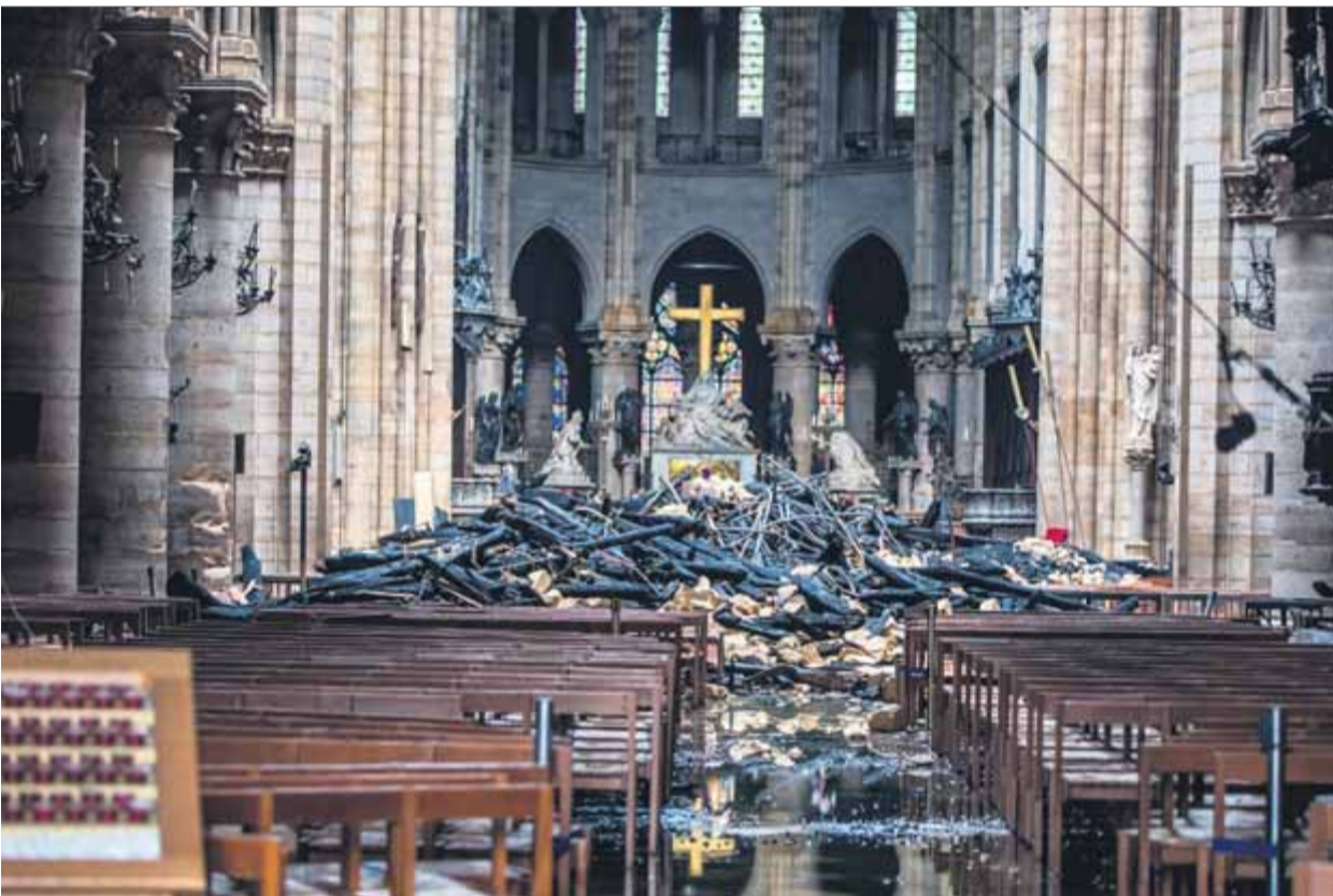
Vista de l'interior de Notre-Dame, ahir al matí, després de l'actuació dels bombers

DONACIONS • Les grans empreses franceses donen més de 600 milions per refer la catedral