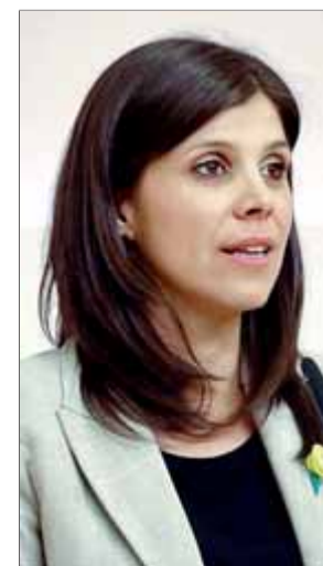
Vilalta, ahir en la compareixença a ERC ■ ACN

El decàleg d'Esquerra inclou la promoció "dels valors republicans, la transparència i el retre comptes enfront d'un Es-