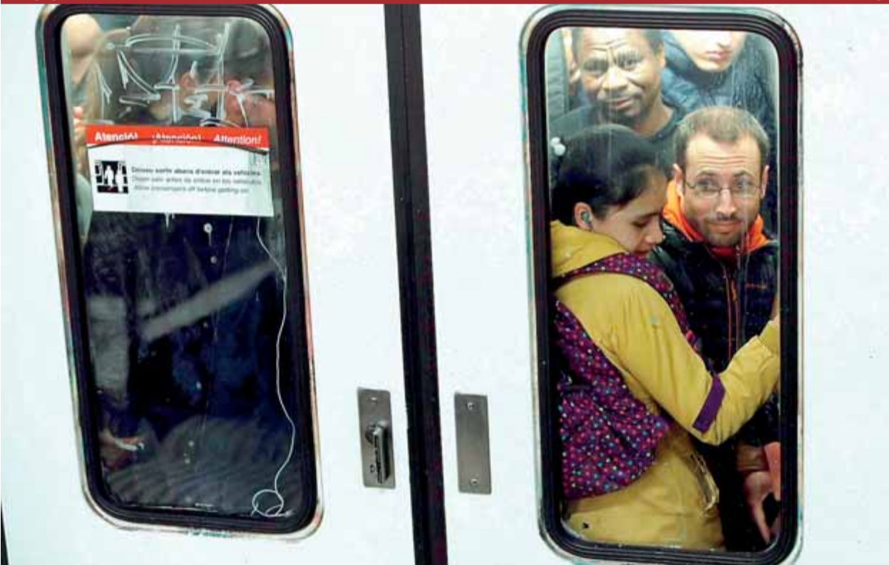
Passatgers d'un vagó del metro viatjant sense espai vital ahir al matí

PENDENTS • També decidirà avui si poden sortir de la presó per la campanya o fer debats i actes a Soto del Real