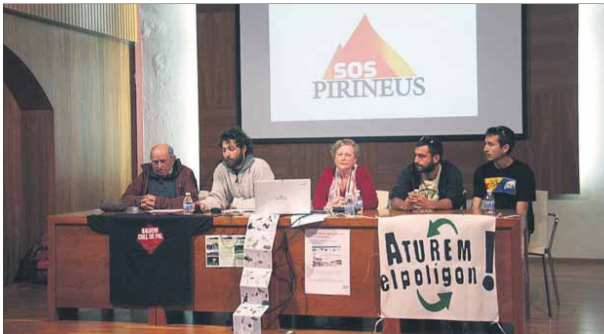
Presentació de la coordinadora SOS Pirineus a la Seu d'Urgell amb representants de diverses entitats que la integren