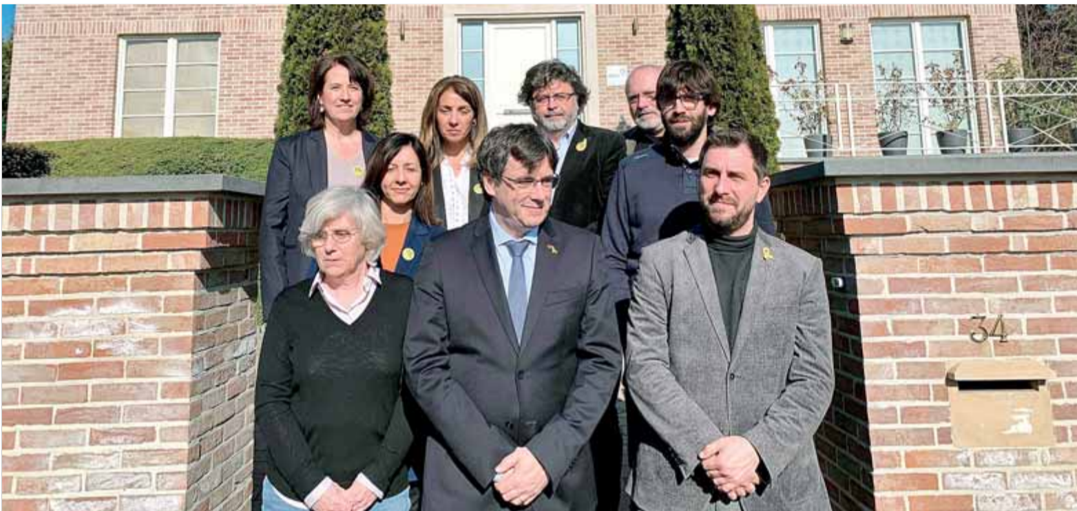
Puigdemont, Comín i Ponsatí, el febrer passat a Waterloo, després del Consell per la República

■ Carles Puigdemont manté l'oferta perquè Oriol Junqueras encapçali una llista sobiranista unitària ■ ERC no demanarà l'acta de diputat a Comín, però l'avis que la decisió té conseqüències