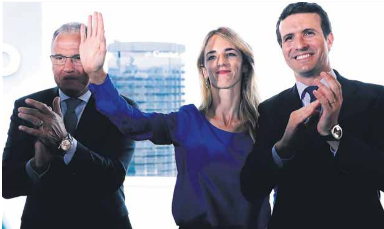
Els candidats del PP Josep Bou, Cayetana Álvarez de Toledo i Pablo Casado ahir a Barcelona

Per garantir la unitat de la nació, el PP inclou l'aplicació del 155, durant el temps que calgui i amb les mesures necessàries, en els àmbits de l'ensenyament, els centres penitenciaris, els mitjans públics de comunicació i la hisen-