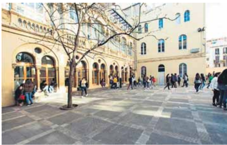
El pati de l'escola Vedral de Gràcia, a Barcelona

Venim d'una llarga tradició pedagògica; moltes escoles perviuen des de la segona meitat del segle XIX. Aquestes escoles van sorgir en un context de forta iniciativa social per millorar la qualitat de vida de la gent i enfortir la cultura del moment.